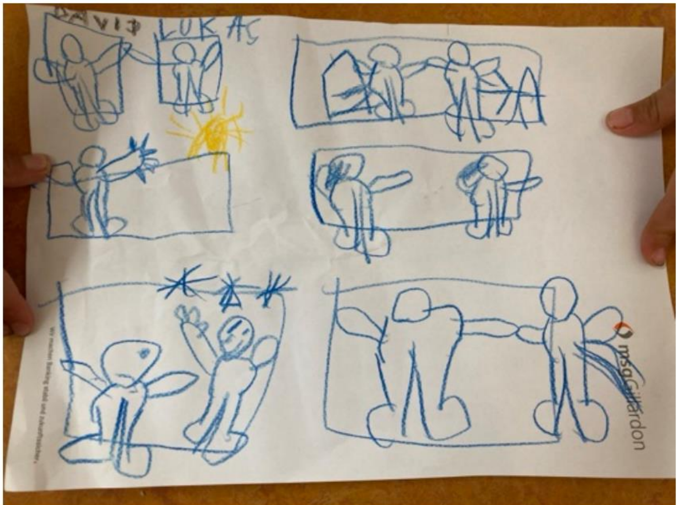
Manuskript eines Kindes, für Verabredungen beim Theaterauftritt

Nachhaltigkeit der Maßnahme: Aus anfänglich schüchternen und introvertierten Kindern entwickeln sich spielerisch Kinder die sich sprachlich besser äußern, sich einbringen und zurücknehmen können. Beim Übergang in die Grundschule verlassen das Projekt begeisterungsfähige Kinder, die gelernt haben sich zu konzentrieren und aufnahmefähig geworden sind.