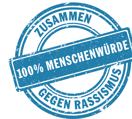
Stand Februar 2026