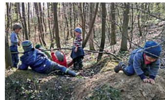
Waldkinder beim Spielen

Interessierte Familien können sich vor Ort über die Einrichtung und die Betreuungsmöglichkeiten (Waldkindergarten und Waldspielgruppen) informieren und sich bei Bedarf gern auch gleich im Kindergarten anmelden oder sich für das nächste Kindergartenjahr 2017/2018 unverbindlich vormerken lassen.