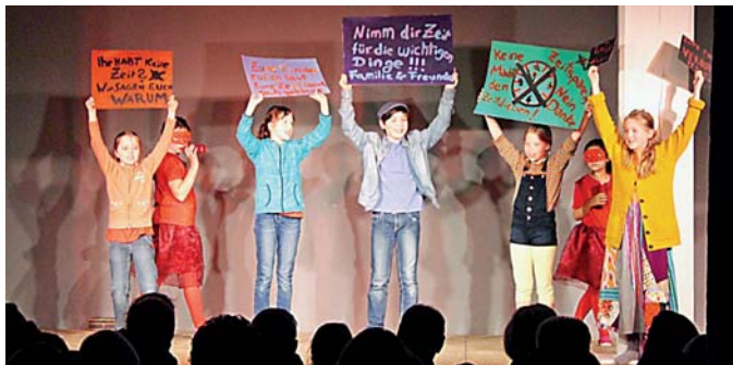
Theaterklasse der MuKs mit „Momo“