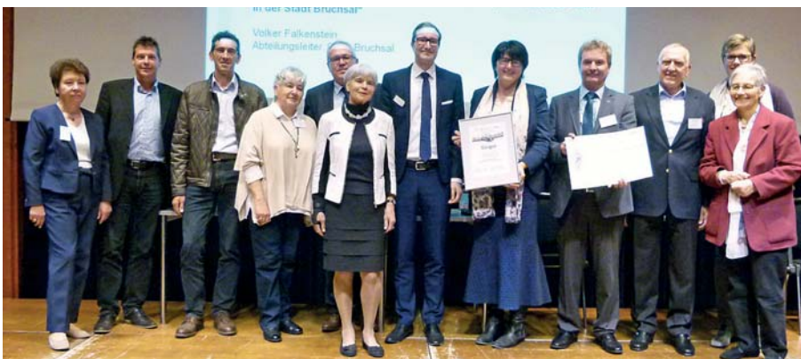
Bruchsal mit dem Förderpreis „Gesunde Kommune“ der B 52-Verbändekooperation ausgezeichnet.