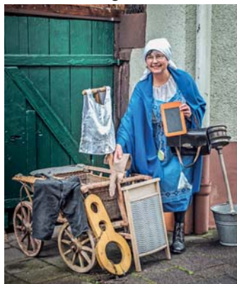
Unterwegs mit Rosa ...

Bis 1936 lebte Rosa mit ihrem Mann und ihrer Tochter im Katzenturm – ohne Wasser und ohne Strom. Gekleidet im Stil der 30er Jahre des 20. Jahrhundert erzählt sie bei einem Rundgang durch die Stadt nicht nur aus ihrem Leben, sondern auch von bekannten Personen, die in Heidelberg lebten. So verbrachten beispielsweise ein Innenminister und ein Privatbankier aus der Schweiz hier einst ihre Jugend. Der Urenkel einer hiesigen Familie wurde im neu gegründeten Staat Israel sogar Justizminister. Einiges zu berichten gibt es aus dem Linsenviertel, über den Törlles- oder Diebsturm und über das älteste Gebäude der „alten