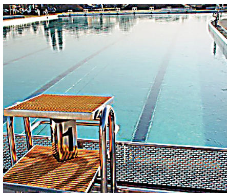
Die Stadtwerke möchten in Bruchsal, Heildelshem und Obergrombach gern am Samstag, 20. Mai, zeitgleich in die Freibadsaison starten.

Die Freibäder in Bruchsal, Heildelshem und Obergrombach sind bereits bestens auf den Start vorbereitet