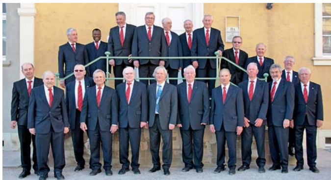
Männerchor des Polizeichors Bruchsal