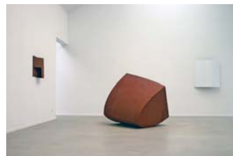
Freiplastik vor dem Damianstor von Gert Riel

Ausstellungseröffnung am Sonntag, 21. Mai um 15 Uhr. Einlasskarten hierfür sind erforderlich; diese können bestellt werden per E-Mail bei kultur@bruchsal.de, telefonisch unter 07251-79-380 oder schriftlich bei der Stadt Bruchsal, Hauptamt, Abt. Kultur, Kaiserstraße 66, 76646 Bruchsal.