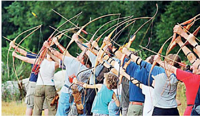
Auch Bogenschießen kann am Naturtag ausprobiert werden.