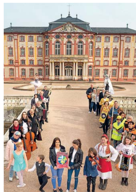
Zahlreiche Vereine, Institutionen, Künstler und Musiker beteiligen sich am Bruchsaler KulturFestival Utopolis vom 12. bis 21. Mai.

Telefon: (07251) 79-380, -183 und -103 | Fax: (07251) 79-11-380 | E-Mail: kultur@bruchsal.de