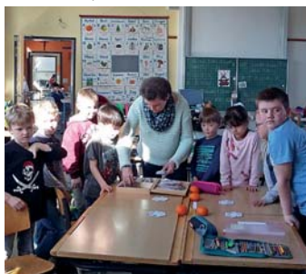
Die Kinder erarbeiten gemeinsam Lerninhalte

Diese Frage stellten sich die Kinder der ersten und zweiten Klasse, als sie zum ersten Mal vom neuen Projekt der Burgschule hörten. Aus der Neugierde wurde recht schnell Begeisterung und so treffen sich an jedem Donnerstag in der vierten Stunde die Schüler beider Klassen in altersgemischten und wöchentlich wechselnden Gruppen. In vier verschiedenen Räumen beschäftigen sie sich mit unterschiedlichen Aufgabenstellungen.