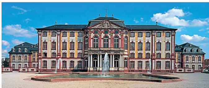
Bruchsaler Kultureinrichtungen präsentieren gemeinsam ihr Angebot.