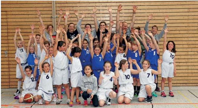
Bruchaler und Speyerer U9- und U11-Mädchen

Sehr aktiv waren die U11- und U9-Mädchen an den beiden letzten Wochenenden. Zunächst stand ein Turnier in Ettlingen an. Da beide Mannschaften derzeit boomen, konnte die TSG Bruchsal als einziger Verein gleich zwei reine Mädchen-Mannschaften stellen und hier auch Kinder aus beiden Altersklassen zum Einsatz bringen. Durch die hervorragende Ettlinger Organisation konnte die eine Mannschaft bei den Profis und die andere bei den Anfängern mitspielen. Von den jeweils fünf Spielen des Tages wurden zwei bzw. drei gewonnen, was ein toller Erfolg für die Bruchsaler Basketball-Mädchen war, so dass sie ausgepowert und glücklich nach Hause fuhren.