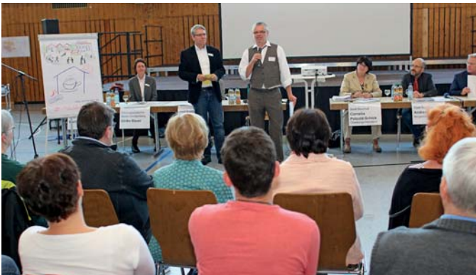
Aufmerksam lauschten die Zuhörer der Bürgerversammlung der Ergebnispräsentation der Arbeitsgruppe „Büchenau“.