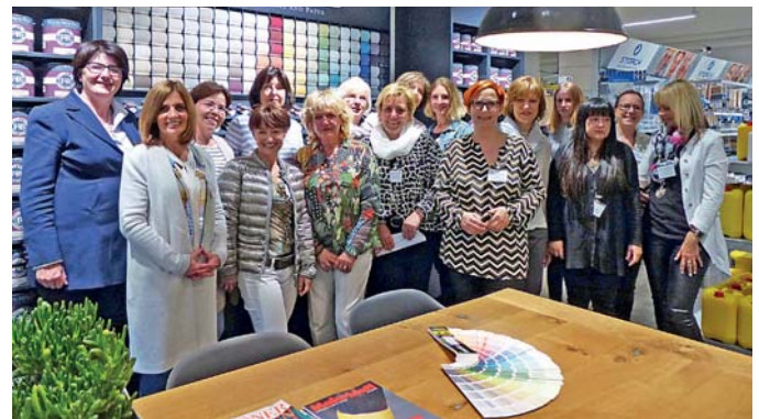
Unternehmerinnennetzwerktreffen der w-lounge vom 3. Mai bei der Firma Farbenkontor