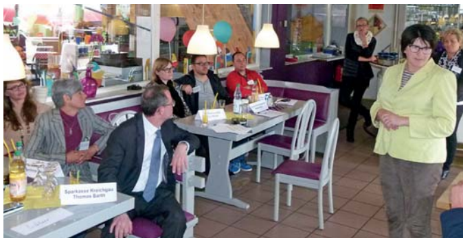
Heildelshemer Unternehmer beim Lokalen Netzwerktreffen am 2. Mai