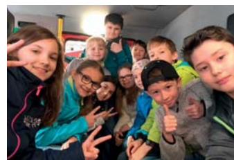
Klasse 4b bei der Feuerwehr