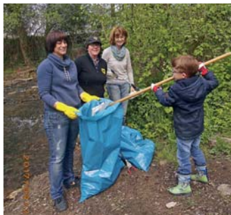
Bürgerwehrmitglieder in Aktion

Mitglieder der Bürgerwehr haben am Freitag die Fläche rund um der „Rum Bum“ gesäubert.