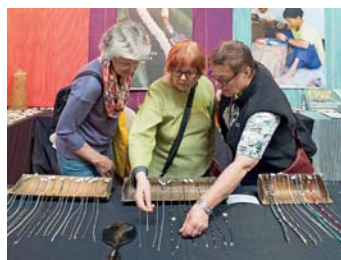
Besuch des Weltladens auf Fairhandelsmesse Stgt.

Eine kleine Delegation vom Weltladen Bruchsal reiste im April zur internationalen Fach- und Verbrauchermesse „Fair Handeln“ in Stuttgart. Diese Messe informiert über faires, global verantwortungsvolles Handeln mit Blick auf Entwicklungs- und Schwellenländer und der Entwicklungszusammenarbeit für Fachleute und Verbraucher.