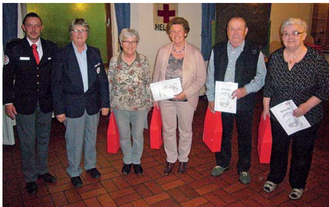
Ehrungen für 60 Jahre Mitgliedschaft