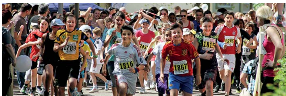
Mit Rücksicht auf den Hoffnungslauf gibt es am 20. Mai Umleitungen auf einigen Stadtbuslinien.

„Siemens-Wohnheim“ folgt die Linie 185 in Bruchsal dem Linienweg der Linie 181 und bedient die Haltestellen „Eisweiher“, „Paul-Gerhardt-Straße“, „Ernst-Blickle-Straße“, „Stadtwerke“ und „Bahnhof“, bevor der Rundkurs am Bahnhof, Spur 2, endet. Der Bus der Linie 186 bedient ab 13:30 Uhr in Bruchsal zunächst den Bahnhof und die Haltestelle „Saalbachcenter“ sowie anschließend die Haltestelle „Ernst-Blickle-Straße“. Dann fährt der Bus die Haltestellen „Paul-Gerhardt-Straße“, „Eisweiher“, „Siemens-Wohnheim“, „Florian-Geyer-Straße“ und „Josef-Heid-Straße“ an, bevor er weiter dem regulären Linienweg folgt. Nach der Haltestelle „Heildelshem Schwimmbad“ entfallen die Haltestellen in Bruchsal. Die Linie 186 fährt über die B 35 und B3 zur Haltestelle „Saalbachcenter“ und weiter zum Bahnhof, Spur 2. Das letzte reguläre Rendezvous in der Bahnhofstraße findet um 12:30 Uhr statt. Die Linien 181 bis 183 fahren noch einmal in die Quartiere und enden dann. Die Linien 185 und 186 folgen der Umleitung. tw