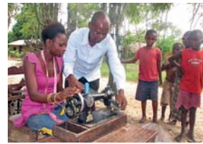
Näherinnenbildung vom letzten Kurs im Ost-Kongo!

schon 2014 besuchte) unterstützen wir dort die Ausbildung von ehemaligen Kindersoldaten und jungen Frauen, die bei den vielen Konflikten im Ost-Kongo verschleppt, missbraucht, vergewaltigt und meist schwer verletzt wurden. Besonders tragisch ist, dass kongolesische Männer diesen kein „zurück“ in ihre Familien mehr gestatten. Diese Frauen werden praktisch ein zweites Mal vertrieben.