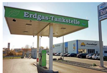
Die ewb-Erdgastankstelle ist wegen Wartungsarbeiten an der Zapfsäule am 16. Mai ganztägig geschlossen.

nicht erfolgen kann. Da die am Vortag gewartete Zapfsäule am Mittwoch, 17. Mai, vorschriftsgemäß nachgeiecht wird, ist die Zapfsäule an diesem Tag nur eingeschränkt nutzbar, die Betankung entsprechend nicht immer möglich. Die ewb bittet ihre Kunden, zumindest am 16. Mai auf die nächstgelegene Erdgastankstelle in Weingarten, Duracher Straße 82, auszuweichen. tw