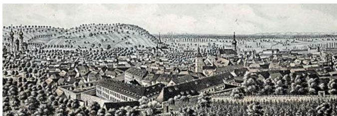
Gemälde aus Bruchsal werden im Rathaus am Marktplatz ab 17. Mai gezeigt. Am Eröffnungsabend ist das Rathaus aus diesem Anlass bis 22 Uhr geöffnet.

Eröffnet wird die Ausstellung am Mittwoch, 17. Mai um 17 Uhr mit einer Vernissage im Sitzungssaal des Rathauses am Marktplatz (Kaiserstraße 66); am Eröffnungsabend sind die Bilder im ersten Obergeschoss bis 22 Uhr zu besichtigen. Gesamtdauer der Ausstellung ist bis 15. September, der Eintritt ist zu den regulären Öffnungszeiten des Rathauses frei (Mo-Mi 8-16 Uhr, Do 8-17 Uhr, Fr 8-12 Uhr).