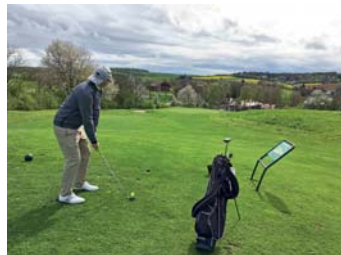
Keine Scheu! Sie sind herzlich willkommen.

Burn-Out? Streß? Jede Menge Belastung? Zu wenig Bewegung? Dann sollten Sie mal versuchen, das mit Golfsport auszugleichen. In unserem Golfclub Bruchsal e.V. müssen Sie dazu nicht gleich Mitglied werden. Schnupperangebote vielfältiger Art geben Ihnen einen Eindruck davon, ob dieser Sport zu Ihnen passt. Sie können das jeden Samstag von 14-16 Uhr oder sonntags von 10-12 Uhr einfach mal kostenlos ausprobieren und brauchen sich vorher lediglich telefonisch anzumelden (07251 302270).