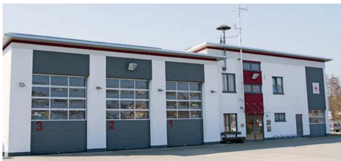
Das jetzige Feuerwehrhaus in der Joss-Fritz-Straße

Das im Jahre 1974 erbaute Feuerwehrhaus in der Obergrombacher Straße war mittlerweile in die Jahre gekommen. Das damals moderne Flachdach war an etlichen Stellen undicht, die Umkleidemöglichkeiten der Mannschaft in der Fahrzeughalle bei den Abgasen der Fahrzeuge und die sanitären Einrichtungen waren nicht mehr zeitgemäß.