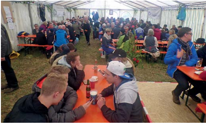
Wieder ein gut besuchtes Maifest