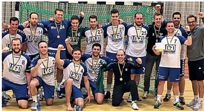
Sieger im Kreispokal 2017: TV Büchenau