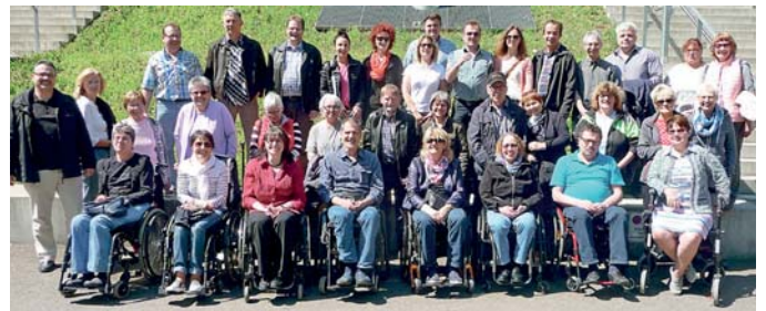
Die AMSEL-Kontaktgruppe Bretten-Bruchsal

Am 30.04.2017 fand der Jahresausflug der AMSEL-Kontaktgruppe Bretten/Bruchsal statt. Ziel war die in der Hanns-Martin-Schleyer-Halle in Stuttgart gastierende Ausstellung „Körperwelten – Zyklus des Lebens“ von Gunther von Hagen. Nachdem 35 Mitglieder der Kontaktgruppe an den jeweiligen Zustiegsorten in Weingarten, Bruchsal und Bretten vom Busfahrer der Firma HolgerTours eingesammelt wurden ging es zum gemeinsamen Mittagessen ins Hotel Hilton in Stuttgart. Frisch gestärkt machten sich die Teilnehmer dann zu Fuß bzw. per Rollstuhl auf in die ca. 200 Meter entfernt liegende Ausstellung. Die in der Ausstellung gezeigten Exponate konnte jeder Teilnehmer in seinem ganz eigenen Tempo erkunden. Viele Informationen und Bilder gab es an diesem Tag zu verarbeiten, bevor gegen 17.30 Uhr die Heimfahrt angetreten wurde.