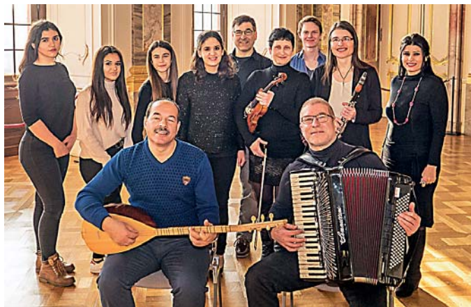
Spielt's noch mal!

„Musaik“-Konzert wird ein zweites Mal gespielt Wiederholung am Samstag, 20. Mai / Eintritt frei, Reservierungen erbeten