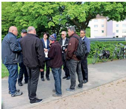
Bei der Vor-Ort-Begehung wurde in der Südstadt die Situation in der Franz-Sigel-Straße in Augenschein genommen und der Platz neben dem Spielplatz besichtigt, der mit einem Backshop belebt werden soll.

Bruchsal (pa) | Bruchsal wächst! Ein Teil des Wachstums wurde im Baugebiet Oberer Weiherberg aufgenommen. Schon heute ist es beschlossene Sache, dass dieses Gebiet weiter wachsen wird. Gegenwärtig werden die Voraussetzungen für den Oberer Weiherberg II geschaffen. Neben dem Umlegungsverfahren finden gegenwärtig Kanalarbeiten im Schattengraben statt. Mit dieser Maßnahme wird die Entwässerung des Gebiets sichergestellt. Eine weitere Entwicklungsperspektive könnte sich für den Weiherberg im Bereich der Alten Landesfeuerwehrschule ergeben. Dieses Areal, so die Vorstellung des Landes Baden-Württemberg (Eigentümer) und der Stadt, könnte langfristig für eine Wohnbebauung genutzt werden. Grundsätzlich möglich wäre dort die Ent-