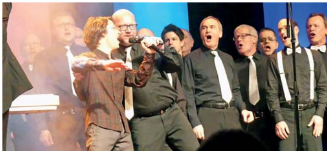
„Let me entertain you“

Da stimmte einfach alles! Witzige, freche, selbstgedichtete Liedtexte aus allen Bereichen des Lebens wie Liebe (das bisher einzige Liebeslied an die Männer „Jochens“), Urlaub „Sodom und Gomera“ oder Hundehaltung, dazu fünfstimmiger Gesang mit allem was der Mund hergab. Von feinfühligem Akkordbegleitung zu den Liedtexten bis zu Vocal Percussion wurde alles stimmig und stimmlich geboten. Beeindruckend war, wie tief basta-Arndt im Lied „Ich, Bass“ mit seiner Stimme kam. Die Moderation verband die Lieder mit lustigen Geschichten aus dem Leben, die die Liedtexte inspiriert haben. So begründete das jüngste basta-Mitglied Hannes seinen Zugang zu der Truppe mit seinem Interesse an Menschen aus den Siebzigern (seinen basta-Kumpels), „...wie sie so gelebt haben,... was sie so essen...“ um dann das Lied vom „Alter“ anzustimmen. Auf die Schippe genommen wurden auch die modernen Essgewohnheiten mit dem Lied „Laktosetolerant“, ein Gebrechen, das bisher nicht anerkannt wurde. Show- und Lichteffekte taten dann ein Übriges das Publikum gänzlich mitzureißen und zu begeistern. Spätestens bei „Legalize a cappella“ sangen dann auch alle mit.