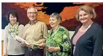
Jubilare 25jährige Mitgliedschaft