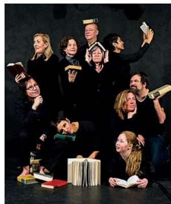
Bürgertheater der BLB