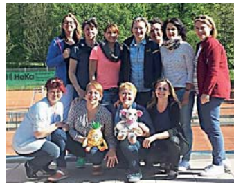
Freundschaftsspiel mit dem TC Kieselbronn

Für die TCO Damen war dies schon einmal ein erstes Testspiel für die kommende Saison, in mehreren Doppel- und Einzelspielen konnte zusätzliche Spielpraxis gesammelt werden.