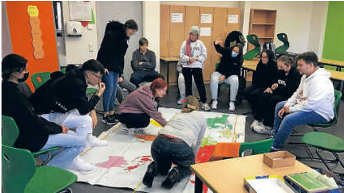
Wo wächst überhaupt der Kakao? Unterwegs auf der begehbaren Weltkarte in der Käthe-Kollwitz-Schule

Wenn Sie auch Ihre Veranstaltung mit einem Workshop z.B. über Kakao/Schokolade, den „Siegeldschungel“ oder die „Lieferkette der Jeans“ buchen wollen, besuchen Sie uns gerne zu den aktuellen Öffnungszeiten oder nehmen Sie via E-Mail Kontakt auf; weitere Themen sind in Vorbereitung.