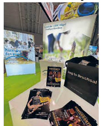
Der Messestand der BTMV auf der CMT in Stuttgart

Keine Frage, dass darüber hinaus die Radwanderkarte „ Tour de Spargel “ bei den Besucher:innen besonders gut ankam. Vom beliebten Bruchsaler Spargelschnaps ganz zu schweigen.