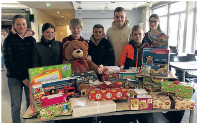
Ein Tisch voller Gaben

Mit vier musikalischen Stücken Weihnachten erleben - das war darüber hinaus das Ziel der Weihnachtsfeier. Jede Klasse führte Theaterstücke auf, bei denen die Schülerinnen und Schüler ihre Kreativität voll ausleben konnten. Bei netten Gesprächen versorgte die SMV die Gäste mit Suppe und Getränken. Verstärkt wurde die Weihnachtsstimmung durch musikalische und tänzerische Einlagen. Bruno Unterhauser/Hi