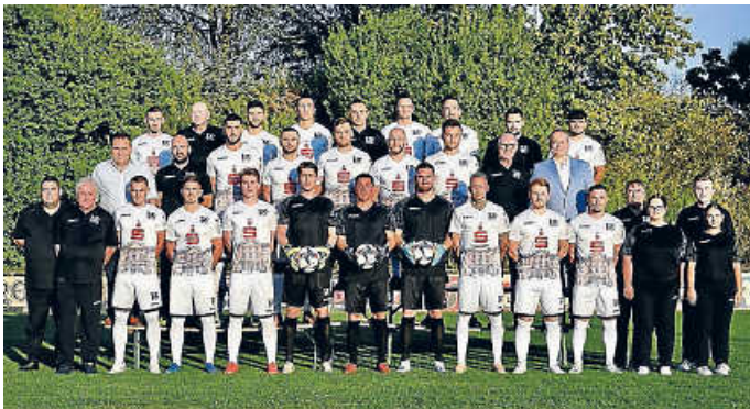
Mannschaftsfoto Saison 2022/23

Bitte unterstützen Sie durch Ihren zahlreichen Besuch unsere Mannschaft.