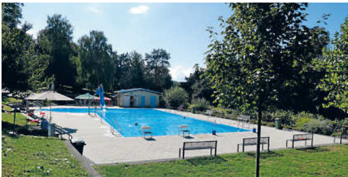
Vorfriede auf die kommende Saison

Noch liegt unser Schwimmbad im Winterschlaf. Aber um es für die bevorstehende Saison auf Vordermann zu bringen, haben wir den ersten Arbeitseinsatz auf Samstag, 11. Februar, 9 bis 12 Uhr festgelegt. Bei diesem frühen Einsatz liegt der Schwerpunkt auf dem Rückschnitt der Hölzer und den Hecken, um zu verhindern, dass wir mit der Brutzeit der Vögel in Konflikt geraten. Aber auch unsere Teams können an diesem Tag sicherlich wieder auf die tatkräftige Unterstützung der Mitglieder zählen.