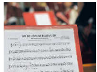
Ein Stück unseres Programmes

Der Neujahrsempfang der Untergrombacher Vereine am vergangenen Freitag war ein voller Erfolg und es hat uns eine Menge Spaß bereitet, die Gäste musikalisch mit verschiedenen Stücken zu unterhalten. In diesem Zuge möchten wir uns für Ihr zahlreiches Erschei-