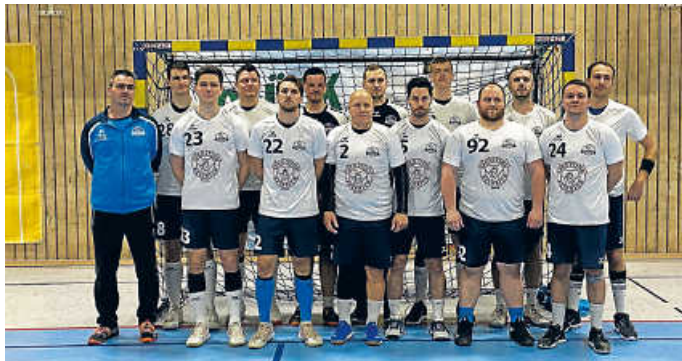
1. Herrenmannschaft der HSG Bruchsal/Untergrombach

Nach einer deutlichen Leistungssteigerung nach der Halbzeitpause nahm unsere 1. Herrenmannschaft zwei Punkte aus der harzlosen Halle des Sportinstituts des KIT mit nach Bruchsal.