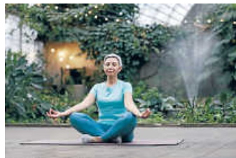
Yoga-Kurs für Trauernde

Lockere Kleidung (gerne schon angezogen, da es keine Umkleidekabine gibt), eine Matte (Gymnastik- oder Yogamatte), eine Decke für die