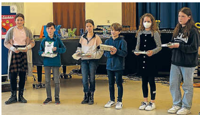
Die stolzen Gewinner