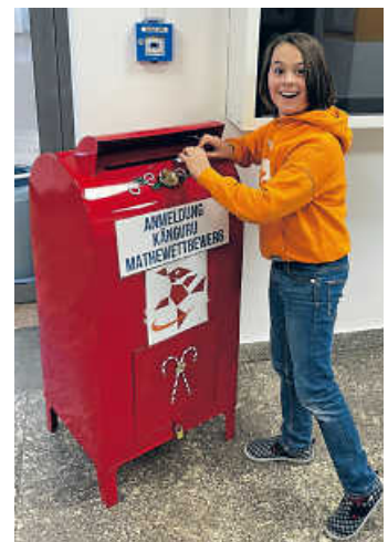
Erste Anmeldung für den Wettbewerb!