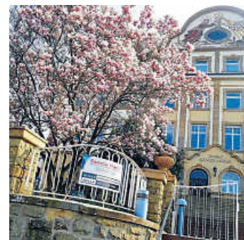
Schule ohne Rassismus - Schule mit Courage: Sancta Maria in Bruchsal

Weitere Informationen unter: www.fsp-sanctamaria.de