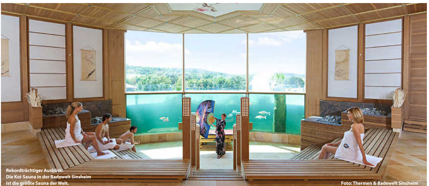
Rekordträchtiger Ausblick: Die Koi-Sauna in der Badewelt Sinsheim ist die größte Sauna der Welt.