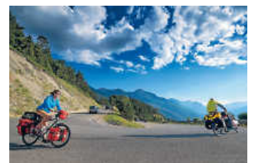
Abfahrt