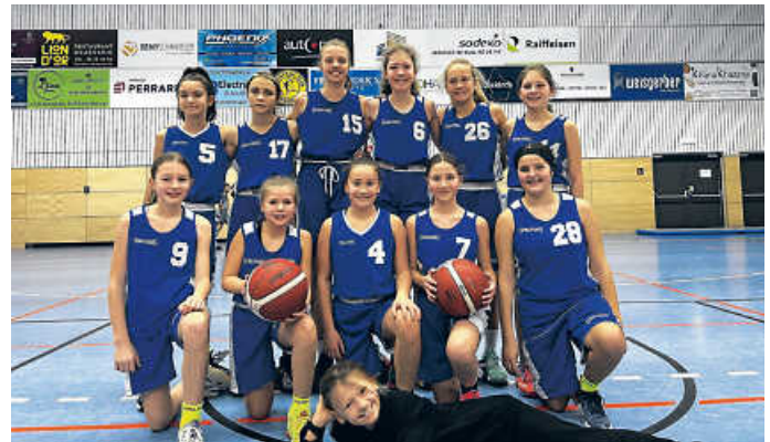
U14-Turnier in Luxemburg