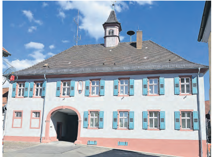
Das barocke Rathaus, heute Verwaltungsstelle, in Obergrombach