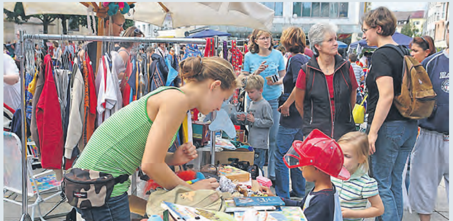
An 120 Ständen wird am 9. September gefeilscht und gekauft.

Von 13 bis 18 Uhr bieten die 6- bis 16-Jährigen alles an, was es in Kinder- und Jugendzimmern gibt.