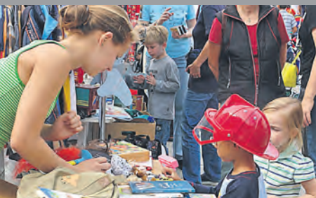
Kinderflohmarkt am Samstag, 9. September