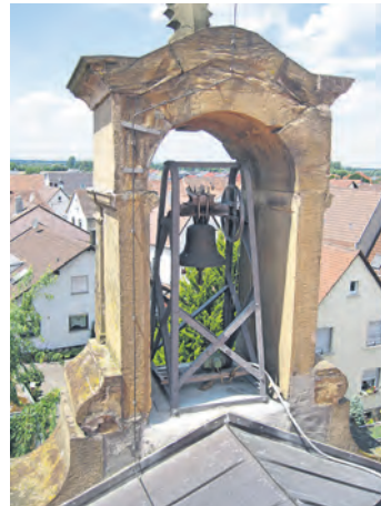
Das Glockentürmchen mit der Schulglocke (Rückseite, vom Dach aus aufgenommen) auf der Alten Schule

Büchenau beteiligt sich am kommenden Sonntag zwischen 14 und 18 Uhr wieder am gesamtstädtischen Programm zum „Tag des offenen Denkmals“ 2016. Als Thema hat der Arbeitskreis Ortsgeschichte ausgewählt: Altes Schulhaus (Gustav-Laforsch-Str. 27) mit der im Kellerschoss eingerichteten „Heimatkundlichen Sammlung“ und hierbei speziell das Glockentürmchen auf dem Gebäude mit dem Schulglöckchen.