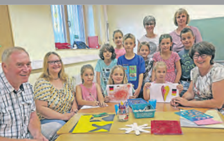
Neues Ferienbetreuungs- konzept für Grundschul- kinder