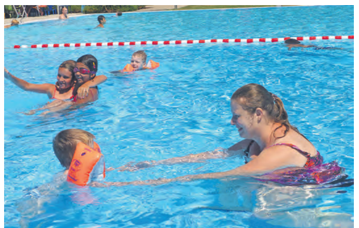
Badespaß beim Freibadfest des Fördervereins

Vor zehn Jahren gründete sich der rund 500 Mitglieder starke Förderverein. Seinem ehrenamtlichen Engagement mit zahlreichen Dienstleistungen und finanziellen Mitteln ist es mit zu verdanken, dass das damals von der Schließung betroffene Bad geöffnet blieb. Unter anderem ist der Förderverein für die Pflege des Liegerasens und der sanitären Anlagen zuständig. Er brachte sich in die Anschaffung der Wasserrutsche, dem Anlegen des Beachvolleyballfelds, des Kinderspielplatzes, der Grünanlagen sowie des Kioskbereichs ein.