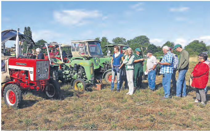
Lauter nicht mehr ganz junge Schätzchen