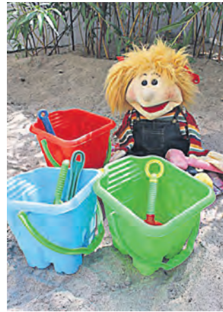
Babysitterkurs im November 2016