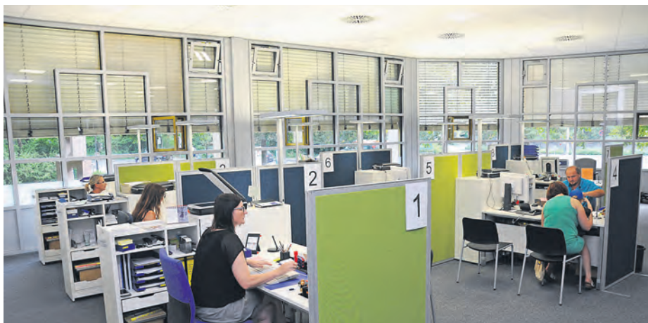
Trennwände und neue Deckenelemente sorgen im modernisierten Bürgerbüro für mehr Privatsphäre.

Umbau beauftragten futureworks GmbH aus Mannheim. Außerdem wurden die Deckenelemente komplett ausgetauscht, so dass die Akustik gedämpft wird und die Beleuchtung den Richtlinien des Arbeitsschutzes entspricht. Trennwände zwischen den Arbeitsplätzen und eine räumliche Trennung sensibler Bereiche gewährleisten, dass die Privatsphäre der Kunden geschützt ist. „Unter Berücksichtigung der finanziell angespannten Lage haben wir nur das nötigste Inventar ausgetauscht“, berichtete Büroleiterin Ingrid Riede. Das werde nun in anderen städtischen Einrichtungen verwendet. Dank der Unterstützung durch Gemeinderat, Ausschüsse und den Mitarbeitern im Rathaus seien die geplante Umbauzeit und das Budget eingehalten worden. Auch die Wahl des ausführenden Unternehmens habe sich als „Glücksfall“ erwiesen, so Gondulf Schneider. Die Mitarbeiter des Bürgerbüros waren in den Umbau einbezogen worden und konnten noch Ende August vom Campus in ihr optimiertes Domizil zurückkehren.