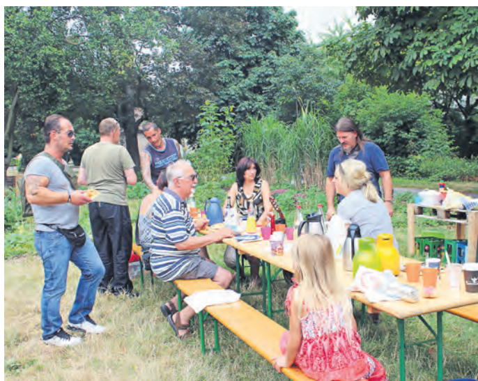
Spiele, Begegnungen und Energieprojekte zum Anfassen gibt es beim zweiten Energiewendetag im Bruchsaler Bürgergarten.