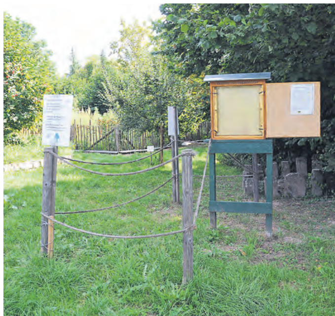
Vergiftete Bienen im Heubühl.