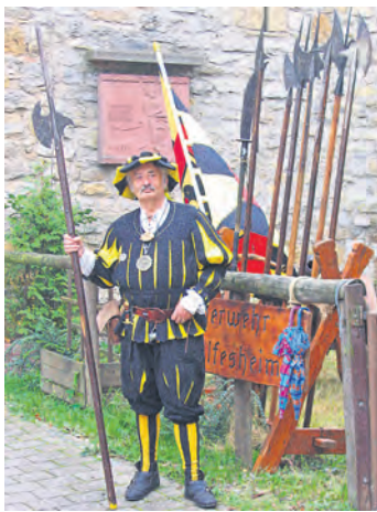
Die Bürgerwehr Heydolfesheim schlägt zum Denkmaltag an der Stadtmauer ein kleines Lager auf

Gemeinsam Denkmale erhalten – dafür setzt sich – neben der Stadtverwaltung – auch die Bürgerwehr Heydolfesheim ein