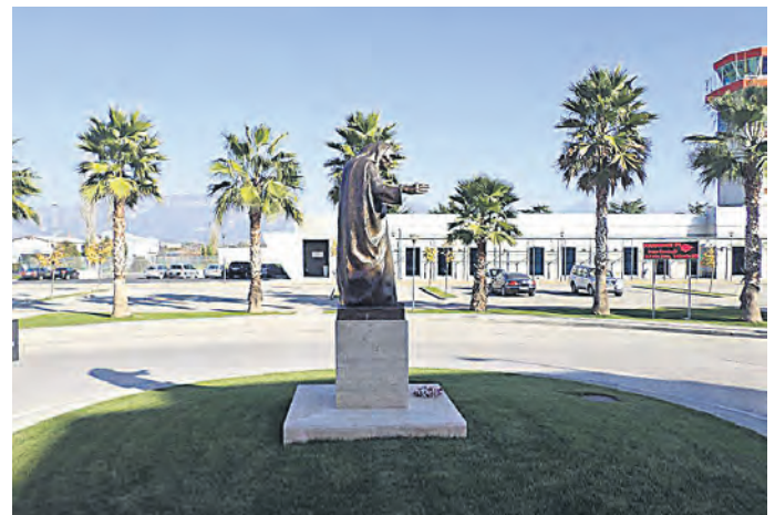
Mutter Theresa aus Albanien, Heiligsprechung 4.09.2016