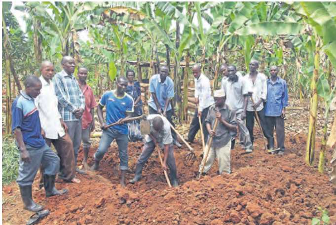
Die Bevölkerung von Kyamulibwa bereitet Gemüsebeete zur Ernährungssicherung vor!

Ziel des Projektes ist neue hygienische Standards zu setzen und weitere Möglichkeiten zum Aufbau von einkommensschaffenden Projekten mit Ernährungssicherung aufzuzeigen.