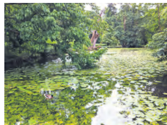
Achtsamkeit und Ruhe