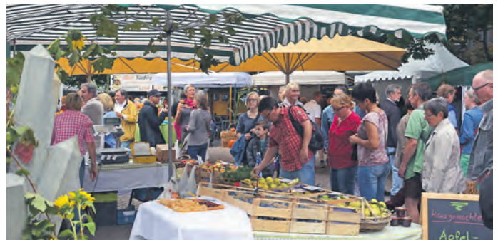
Kürbisse, Handwerk, Bio-Gewürze, Käse, Wein und viele Überraschungen auf dem Herbstmarkt 2016

Bereits am 10. September (Samstag) gibt es auf dem Europaplatz Live-Musik mit der „Uptown-Band“ ab 19 Uhr, die durch Musiker der Bruchsaler „Heizölbänd“ verstärkt wird. Unter anderem sind akustische Interpretationen von Songs der Rolling Stones, Beatles und U2 bis hin zu Reamonn, Green Day oder Mumford & Sons zu hören. Unterstützung gibt es von zwei Urmitgliedern der legendären „Heizölbänd“ – einer Formation, die den Brus'ler Dialekt beherrscht, wie keine andere. Schon beim Konzert gibt es „wilde Köstlichkeiten“ der Jäger vom Revier Bruchsal 2, leckeres aus dem Backhäusle sowie den Stand des Skiclub Bruchsal mit Weinen vom Weingut Klumpp.