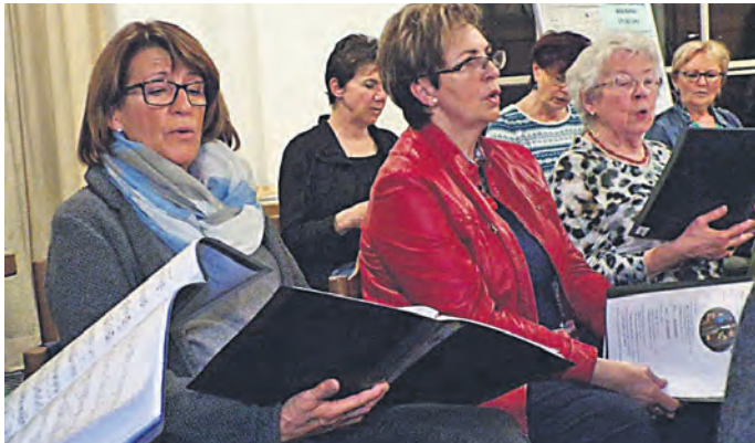
Auf zum Projekt 101