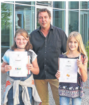
Die Preisträgerinnen aus der 4a

... klang es am Dienstag vor den Sommerferien nach der Aktivpause durch die Klassenzimmer und Rektor Ries verkündete gut gelaunt, dass auf dem Schulhof der Eiswagen auf die rund 200 Grundschüler wartet. Ob Himbeere, Schokolade oder Waldmeister, ein jedes Kind und auch das Kollegium ließ sich im Schatten der Bäume eine leckere Eiskugel schmecken.