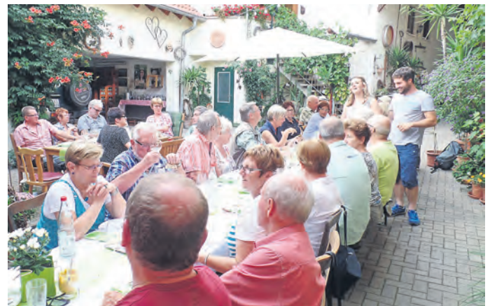
Besuch beim Weingut Zimmer