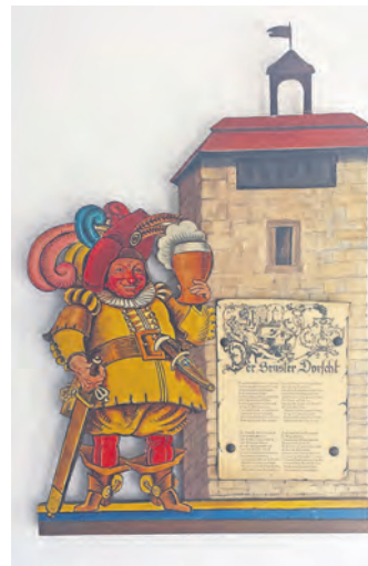
Leihgabe der OWK-Hütte