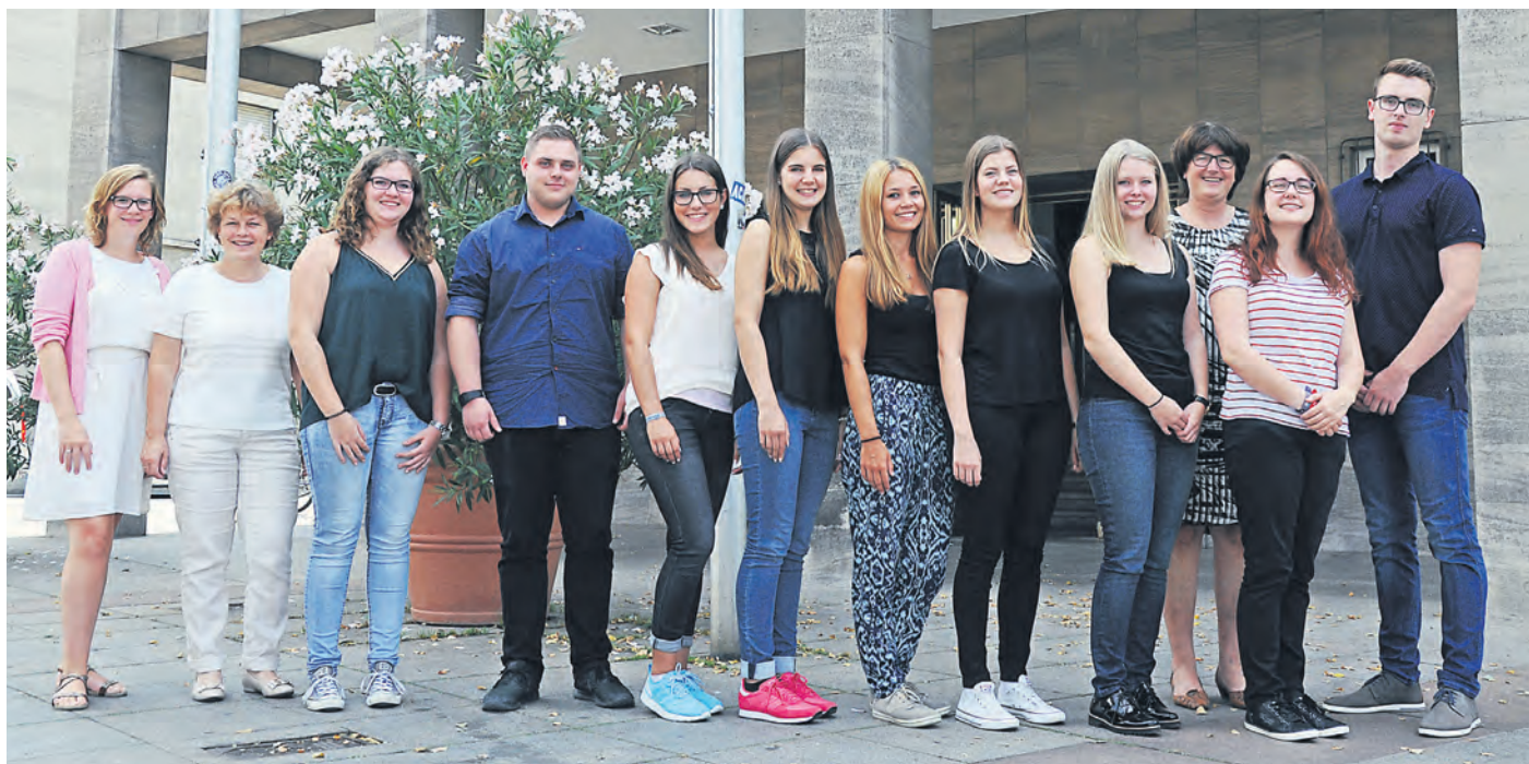
Ausbildungsstart der neuen Verwaltungsauszubildenden am 1. September.

Bewerbungsschluss für das Ausbildungsjahr 2017 ist der 15. September 2016.