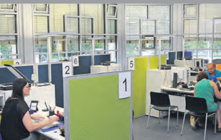
Bürgerbüro im technischen Rathaus wurde modernisiert