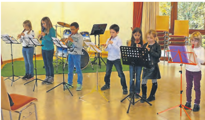
Die letzte Blockflötengruppe beim Jugendvorspiel 2016

Mit dem Blockflöten-Unterricht werden folgende Lernziele verfolgt: Gemeinschaftsgefühl, Teamfähigkeit, Disziplin, Selbstbewusstsein und natürlich das Erlernen des Umgangs mit der Blockflöte. Bist Du noch unentschlossen? Kein Problem, Du kannst an einem kostenfreien Probeunterricht teilnehmen. Haben wir Dein Interesse geweckt? Am 13.09.2016 findet um 19 Uhr ein Informationsabend im Musikerheim statt, bei dem alle offenen Fragen geklärt werden können.