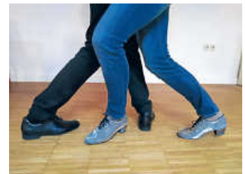
Beinarbeit beim TSC

Interessierte können sich unter kontakt@tsc-bruchsal.de unverbindlich zum Probetraining anmelden. Informationen zu unserem Verein und unseren Gruppen finden Sie unter www.tsc-bruchsal.de .