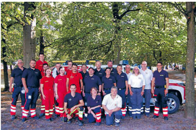
Die Einsatzkräfte beim PUR-Konzert

Dabei steuerte jede Hilfsorganisation verschiedene Komponenten zur medizinischen Absicherung bei, so dass bei jeder Veranstaltung ein Behandlungsplatz, ein Rettungswagen, ein Notarzt und eine Vielzahl an Sanitätstrupps vor Ort waren. Wir übernahmen an mehreren Tagen die medizinische Einsatzleitung und stellten immer mehrere Sanitätstrupps.