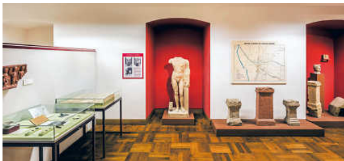
Römische Exponate im Städtischen Museum Bruchsal

Tag des offenen Denkmals im Heimatmuseum Heildelshaus und im Städtischen Museum am 11. September