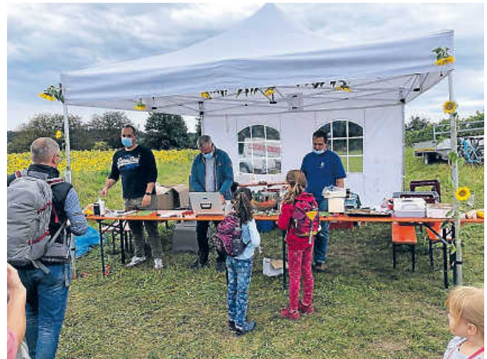
Dieses Jahr brauchen wir zum Glück keine Masken an den Weinständen!