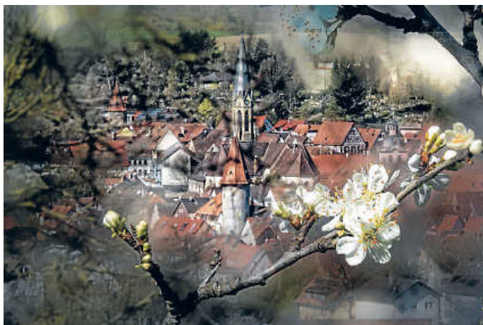
Blick auf Heidelheim

Zum diesjährigen Tag des offenen Denkmals am Sonntag, 11. September, bietet Bruchsal wieder – wie stets in den vergangenen zwei Jahrzehnten – ein umfangreiches ganztägiges Veranstaltungsprogramm. Auch sämtliche fünf Stadtteile sind in diesem Jahr wieder mit attraktiven kostenfreien Angeboten vertreten.