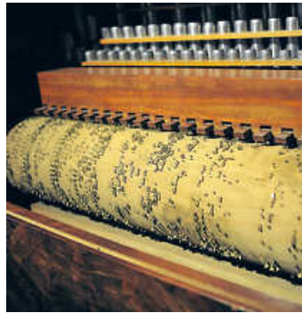
Detail Salonorgel, Frankreich, um 1840

Sonntag, 11. September, 14 Uhr, Themenführung mit Kristin Gaßner Bei Ihrem Besuch im Museum „dreht“ sich dieses Mal alles um die Königin der Instrumente: die Orgel. Sie kann leise hauchen, aber auch richtig donnern und klingt dabei wie ein ganzes Orchester. Das Instrument mit dem längsten Atem erklingt üblicherweise am Sonntag in der Kirche zum Gottesdienst – deren kleine Schwester, die Drehorgel, kennen wir hauptsächlich als Straßeninstrument. In Frankreich und England hingegen dienten Drehorgeln dem Amusement der gehobenen Gesellschaft im feinen Salon. Wahrlich große Instrumente spielten aber auch für Besucher von Kaufhäusern, auf einer Schiffspassage oder auf dem Jahrmarkt. Und das alles ohne die Anwesenheit eines kunstfertigen Organisten.