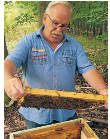
Der Kneipp-Verein besucht die Imkerei Rehm