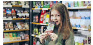
Nicht viele Kinder wissen, wo die Kakaobäume wachsen

Ladentelefon: (072 51) 39 26 960, www.weltladen-bruchsal.de , https://www.facebook.com/weltladen.bruchsal/ , Instagram: @weltladen_bruchsal