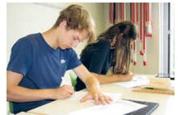
Physik-Studie am HBG