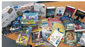
Neue Bücher und Spiele vom Flohmarkt-Erlös

Und für die Erwachsenen haben wir viele neue Romane, Krimis und Thriller. U. a. der einzige Krimi, den Lucinda Riley (Autorin der „Sieben-Schwestern“-Saga) je geschrieben hat und den ihr Sohn nach ihrem Tod nun veröffentlicht hat: „Die Toten von Fleet House“. Der von vielen Fans der „Sieben-Schwestern“-Bücher lang ersehnte achte Band soll im Frühjahr 2023 erscheinen. Und natürlich werden wir ihn auch in unseren Bestand mit aufnehmen.