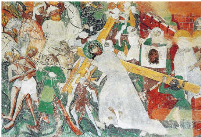
Gotische Malereien in der Burgkapelle Obergrombach

Von 13 bis 17 Uhr ist die Burgkapelle Obergrombach zu besichtigen (Brunnenstraße 7), ein kunstgeschichtliches Kleinod mit spätgotischen Wandfresken zur Heils-, Passions- und Märtyrergeschichte aus dem 15. Jahrhundert. Bis 1844 katholische Pfarrkirche, wurde das Gotteshaus an die jüdische Gemeinde zur Nutzung als Synagoge verkauft und dient heute, seit 1888 im Besitz der Familie von Bohlen und Halbach, der evangelischen Gemeinde als Kirche. Führungen werden von Mitgliedern des Heimatvereins Obergrombach im Halbstundentakt angeboten.