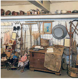
Heimatstube Büchenau

Zwischen 13 und 17 Uhr geöffnet ist die Heimatstube Büchenau mit ihrer thematisch weit gefächerten Sammlung ortsgeschichtlicher Objekte aus Landwirtschaft, Handwerk, Haushalt und Religion (Gustav-Laforsch-Straße 27). Kostenfreie Führungen werden vor Ort von Mitgliedern des Arbeitskreises Ortsgeschichte nach Bedarf individuell angeboten.