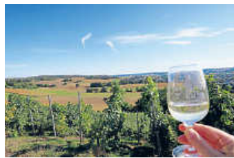
Schöne Aussichten bei der Heidelheimer Weinwanderung

Die beliebte Heidelheimer Weinwanderung über den Altenberg findet dieses Jahr am Sonntag, 18. September statt. Die fünf Weinstationen sind von 11:00-19:00 Uhr geöffnet. Die Beschilderung beginnt an der Stadtbahnhaltestelle Nord. An den fünf Weinstationen werden unterschiedliche Weine aus Heidelberg angeboten, und an vier Stationen gibt es außerdem etwas zu essen zu kaufen, nämlich Bratwurst im Weck, Rahmfleck, mediterrane Brote oder Schweizer Raclette auf Brot.