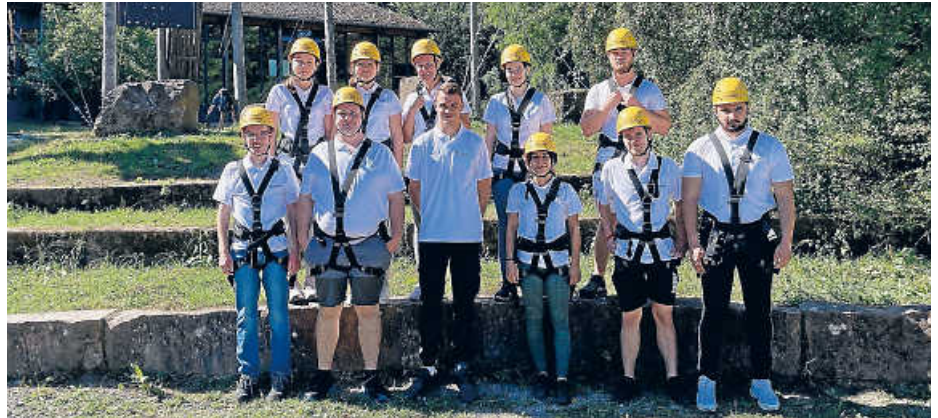
Die SWB-Auszubildenden bauen gegenseitiges Vertrauen auf in der erlebnispädagogischen Hochseilanlage GATE in Ettlingen.

Am 2. September folgte ein Ausflug zum „Großen Abenteuer Turm Ettlingen“ (GATE), der beliebten erlebnispädagogischen Hochseilanlage in Ettlingen. Dort ist man auf Kennenlern-Events für Auszubildende spe-