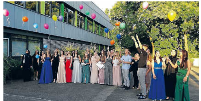
Das Fliegenlassen der Luftballons als Symbol für Freiheit und das Kundtun individueller Wünsche

„Schmeiß den Ballast weg, denn es reist sich besser mit leichtem Gepäck“ – Die Abteilung 2 der Käthe-Kollwitz-Schule gratuliert 106 Absolventinnen und Absolventen zu ihrem Schulabschluss