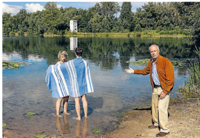
Herr Puntila und sein Knecht Matti

Ist eine Freundschaft oder gar eine Beziehung zwischen Herrschenden und Untergebenen stets ein Fass mit doppeltem Boden? Wir zeigen Brechts Gesellschaftskritik als berauschende Komödie mit Live-Musik.