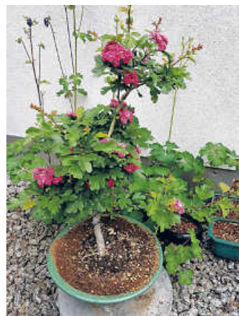
Rotdorn-Nachwuchspflanze in der Blüte