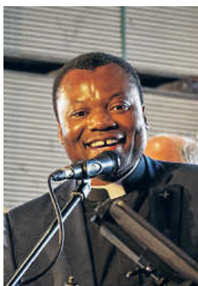
Pater DD im Rockkonzert

Das Benefizkonzert findet ab 18 Uhr im Rohrbacherhof zwischen Bruchsal, Ubstadt und Unteröwisheim statt. Anmeldung dazu sind möglich über den Link https://rockntary.vereinsticket.de