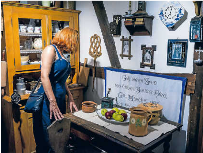
Im Heimatmuseum Untergrombach