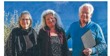
Konzert für Sopran, Tenor & Orgel 11.9. 18 Uhr: „Oasen des Lebens“