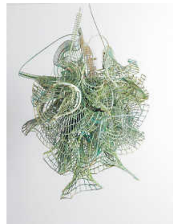
SKB Wirbel#3, grün, 2011-2017, Ansicht 2