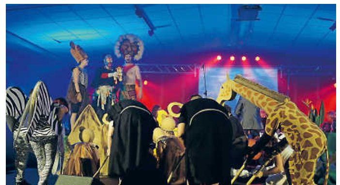
Ein Löwe wird König

Nach zweijähriger coronabedingter Pause feiern die Harmonika-Freunde dieses Jahr am 17./18. September wieder ihr traditionelles Mostfest in der passend dekorierten Veranstaltungshalle. Samstagabends findet in diesem Rahmen ein Konzert des Vereinsorchesters