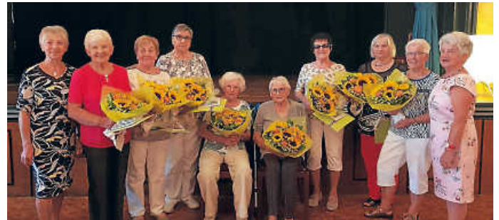
Fröhliche Gesichter bei der Ehrung der Gründungsmitglieder

herigen Vorsitzenden, die mit viel Engagement den Verein über all die Jahre geführt und das Vereinsleben geprägt haben, aber auch bei allen Mitgliedern für ihren Einsatz in der Gemeinschaft der LandFrauen. An einer liebevoll gestalteten Bildergalerie konnten sich die LandFrauen an vielen schönen Erinnerungen dieser erlebnisreichen 40 Jahre erfreuen. Eine besondere Ehrung gab es für die Gründungsmitglieder, die der Einladung gefolgt waren. In Anerkennung ihrer Verdienste um die LandFrauenarbeit wurde den Mitgliedern der „ersten Stunde“ die Ehrenurkunde des Landesverbandes, ein Fotobuch und ein Blumengebinde überreicht. Kulturell bereichert wurde die Jubiläumsfeier durch die Line-Dance-Gruppe der LandFrauen und lustige Sketche. Bei einem guten Essen und interessanten Gesprächen verbrachten alle einen schönen, unvergesslichen Abend.