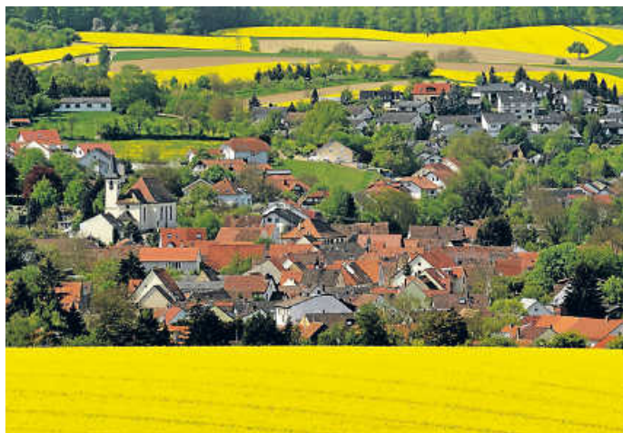
Blick auf Helmsheim

Zu einer Führung durch Helmsheim unter dem Motto des Denkmaltages, „KulturSpur“, lädt Stadtführer Maic Lindenfelder um 14 Uhr ein. Treffpunkt des rund anderthalbstündigen Rundgangs ist der Helmsheimer Dorfplatz bei der Verwaltungsstelle (Kurpfalzstraße 58). Die Gemeinde im Saalbachtal weist einige sehenswerte Bauwerke aus der Zeit des Barock und späteren Epochen auf. Der Rundgang führt vorbei an der im 18. Jahrhundert errichteten Kelter, der katholischen Sebastianskirche mit Turm aus dem 16. Jahrhundert und der evangelischen Melancthonkirche aus dem Jahre 1911.