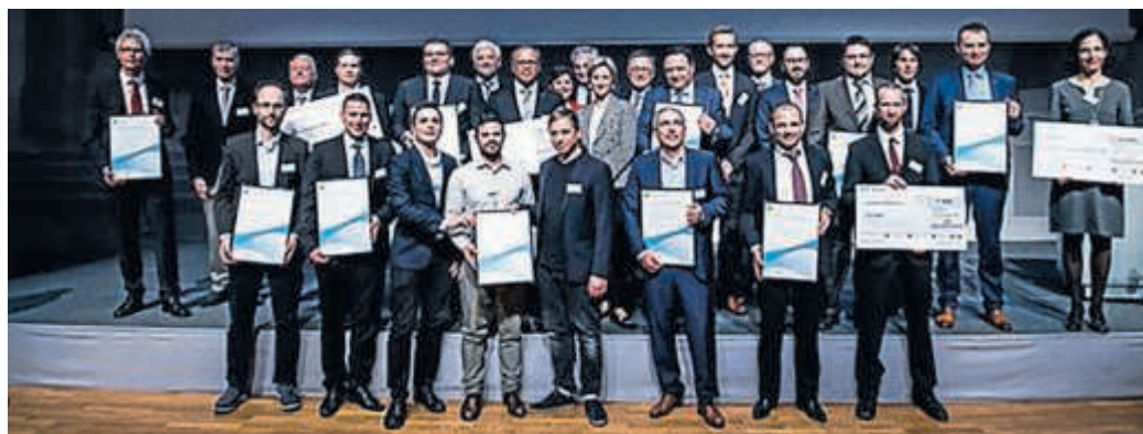
Mit dem insgesamt mit 50.000 Euro dotierten „Dr.-Rudolf-Eberle-Preis“ werden alljährlich mittelständische Unternehmen für ihre herausragenden Entwicklungen und Anwendungen neuer Technologien ausgezeichnet.

Für den Innovationspreis des Landes wurden in diesem Jahr drei Unternehmen durch das Preiskomitee ausgewählt: Die Rosswag GmbH aus Pfinztal bekam ein Preisgeld in Höhe von 25.000 Euro verliehen. Mit 15.000 Euro prämiert wurde die Swabian Instruments GmbH aus Schwieberdingen und 10.000 Euro erhielt die Dr.-Ing. Max Schlötter & Co. KG, Geislingen. Zusätzlich erhielt die ioxp GmbH aus Mannheim den mit 7.500 Euro dotierten Sonderpreis der MBG Mittelständischen Beteiligungsgesellschaft für Innovationen von jungen Unternehmen. Sechs weitere Unternehmen wurden mit einer Anerkennung ausgezeichnet.