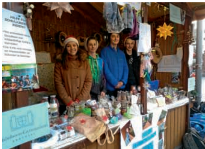
Soziales Engagement macht Spaß und schweißt zusammen