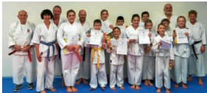
Prüflinge Kyu-Gürtelprüfung Karate