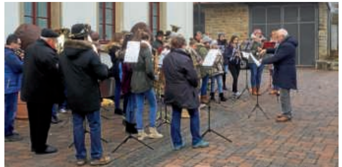
Die Helmsheimer Adventsmusiker auf dem Rathausplatz