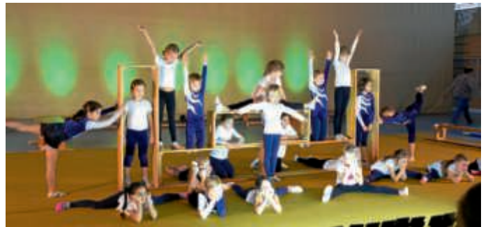
Darbietung der 6- bis 9-jährigen Mädchen