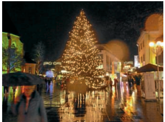
Weihnachten – Marktplatz 2018