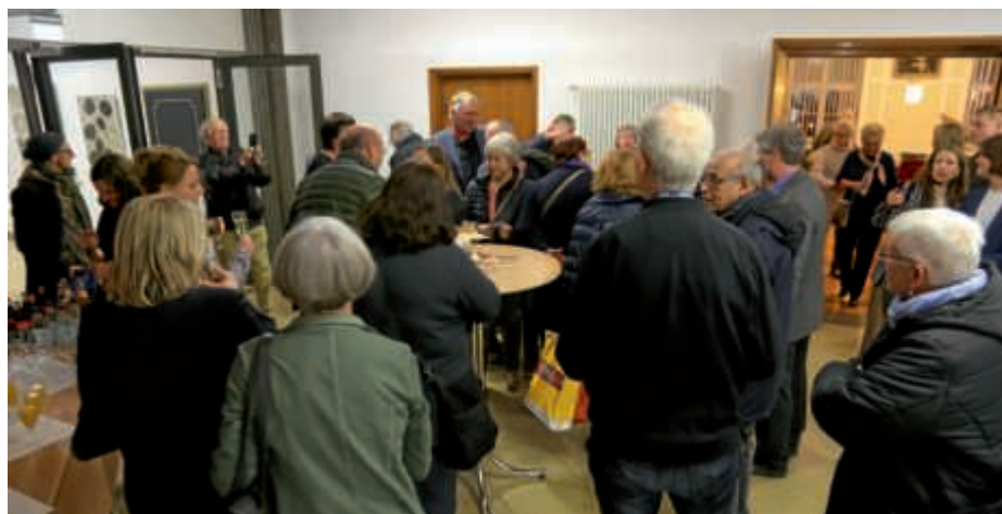
Zahlreiche Besucher bei der Eröffnung