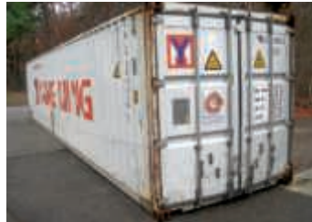
Der 100. Schiffscontainer geht nach Thailand.

Während die neuen Räumlichkeiten für unsere Rollstuhlwerkstatt im Handwerkerhof beim Rheinhafen Karlsruhe bezogen wurden, wurde auch der 100. Schiffscontainer mit Behindertenhilfsmitteln für die „Ärmsten der Armen“ in Entwicklungsländern an der ehemaligen Notkirche beladen.