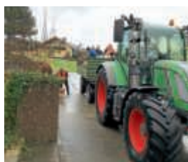
Altpapiersammlung bei Wind und Regen

Der TV Heidelberg bedankt sich recht herzlich bei den Einwohnern für die große Bereitschaft, Papier und Kartonagen für den Turnverein zu sammeln. Durch Ihre Unterstützung kann die Vereinskasse deutlich aufgebessert werden. Deshalb freuen wir uns über jedes Bündel Papier, das nicht in die Grüne oder Blaue Tonne wandert, sondern für unsere Altpapieraktionen gesammelt wird. Ein ganz großes Dankeschön an unsere fleißigen Helfer, die letzten Samstag bei Wind und Regen gesammelt haben. Danke auch an unsere Fahrzeugsteller, ohne die wir eine Altpa-