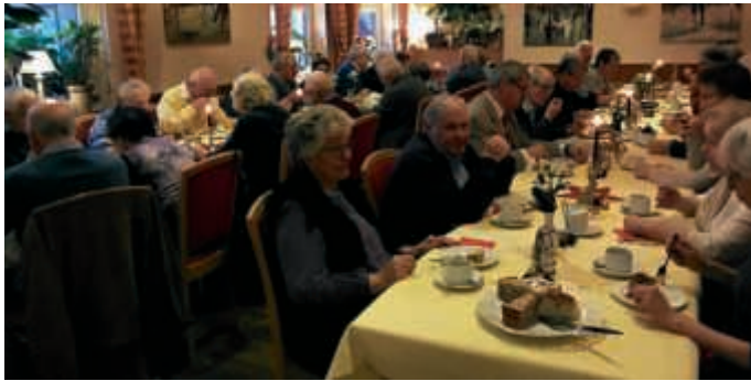
Kaffee zum 2. Advent