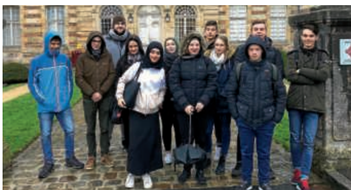
Der Jugendgemeinderat in Ste. Ménehould