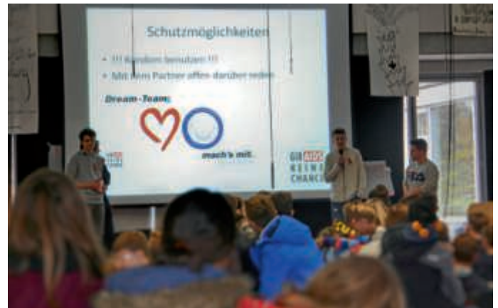
Die SMV klärte über AIDS auf