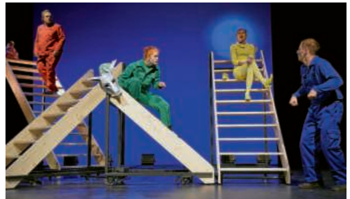
Die Bremer Stadtmusikanten