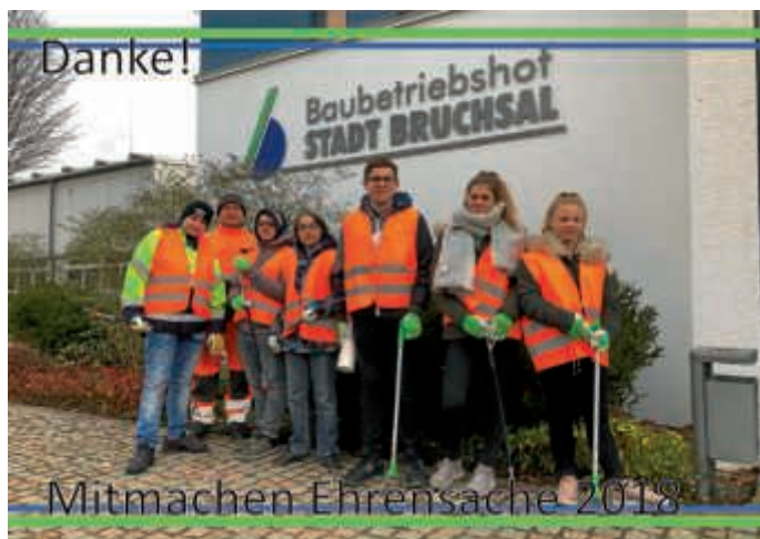
Das war „Mitmachen Ehrensache 2018“ beim Baubetriebshof der Stadt Bruchsal

Wir bedanken uns für das Engagement der Jugendlichen als auch bei den städtischen Mitarbeiterinnen und Mitarbeiter, die sich die Zeit für den Aktionstag genommen haben.