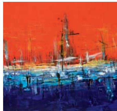
Ein Bild der Ausstellung