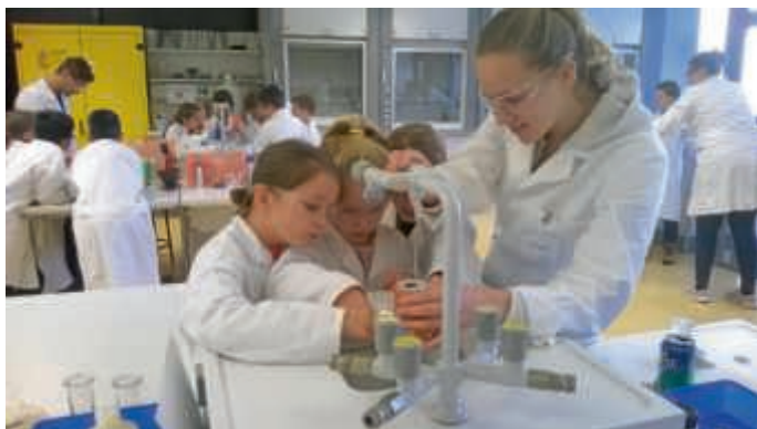
Kinder als kleine Forscher im Labor der PH Karlsruhe