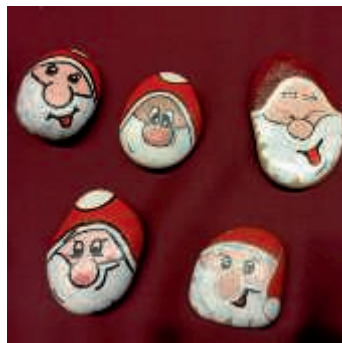
Einstimmung auf den Advent 2018;

Bildernachlese auf www.jossfritzsschule.de .