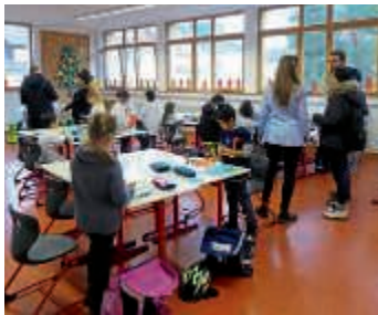
Besuch der Eltern in der VKL Grundschulklasse 1/2

Am Freitag, 7. Dezember fand in der Stirumschule zum zweiten Mal ein Schnuppertag statt. Eingeladen waren die Eltern der aktuellen Grundschüler sowie die Eltern der kommenden Schulanfänger der Stirumschule. Die Eltern der Schulanfänger sollten die Gelegenheit bekommen, sich einen Eindruck über den künftigen Lernort ihrer Kinder zu verschaffen.