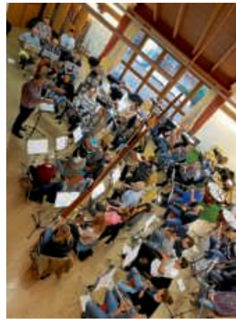
Vorbereitung in der Villa Eintracht