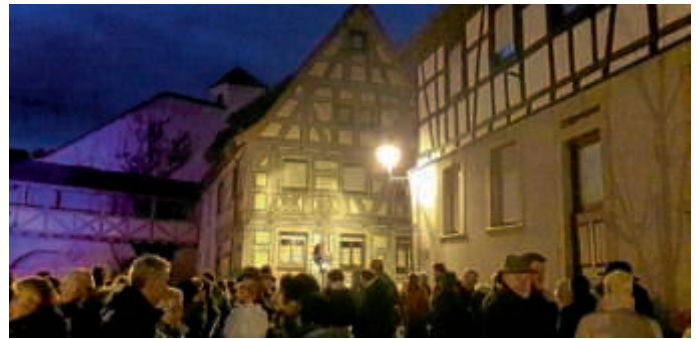
Adventsstimmung im Städt'l