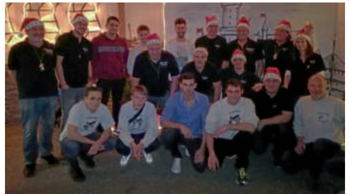
BKG – Männerballett und Bürgerweh