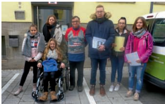
Gleich mehrere Schüler/-innen unterstützten die Arbeitsgruppe Menschen mit und ohne Handicap am Internationalen Tag des Ehrenamts.

Bruchsal (PM) | Im Rahmen der Aktion „Mitmachen Ehrensache“ am Internationalen Tag des Ehrenamts jobben Jugendliche bei Arbeitgebern ihrer Wahl und spenden das verdiente Geld für den guten Zweck. Im Auftrag des Agendabüros der Stadtverwaltung konnten Schülerinnen und Schüler in Bruchsal gleich doppelt Gutes tun – eine kleine Gruppe unterstützte am 5. Dezember 2018 die Arbeitsgruppe Menschen mit und ohne Handicap bei der Aktualisierung ihres Wegweisers „Barrierefrei durch Bruchsal“.