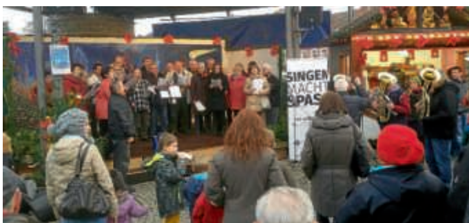
2016 – Der Gesangverein auf dem Bruchsaler Weihnachtsmarkt