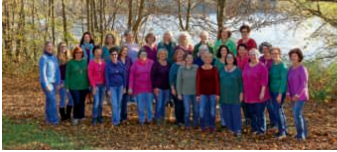
All Cantare lädt zum Singalong auf den Weihnachtsmarkt ein

Am Mittwoch, 19. Dezember, singt um 18 Uhr der Frauenchor All Cantare Advents- und Weihnachtslieder auf dem Weihnachtsmarkt in Bruchsal. Alpenklänge und Glockenklang stehen auf dem Programm als auch allseits bekannte Weihnachtslieder. Alle sind herzlich eingeladen, mit dem Chor die Stimmen zur Weihnachtszeit erklingen zu lassen oder einfach nur zuzuhören. Kommen Sie herbei und lassen Sie uns zusammen mit Ihnen eine weihnachtliche Stimmung zaubern – in Gemeinschaft wird es sicherlich gelingen! (IB)