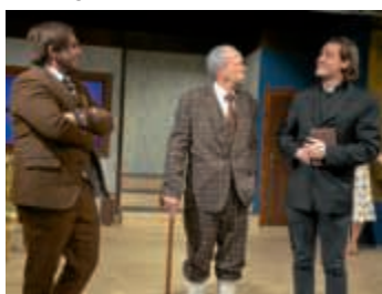
Was will Sir John im Hotel Red Bonnet? (B. Geißler, Joh. und F. Fuchs); Foto: Exil Theater

„Adel verpflichtet“ – wozu? Diese Frage stellt sich in der Kriminalkomödie mit dem gleichnamigen Titel mehrfach. In Szene gesetzt von Bernhard Wendel, startet das Exiltheater mit diesem Stück in die Wintersaison. Gespickt mit britischem Humor lebt es vom Tempo, von Ver(w)irrungen und grotesken Situationen. Den Akteuren gelingt es, sowohl knisternde Spannung aufzubauen als auch gelöste Heiterkeit hervorzuführen.