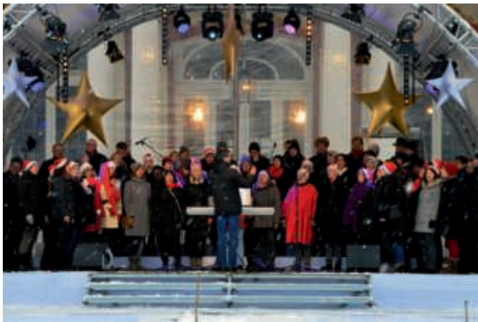
Der Sängerbund auf der Schlossweihnacht

Adventssingen im Bruchsaler Schloss am Samstag, 15. Dezember um 13 Uhr