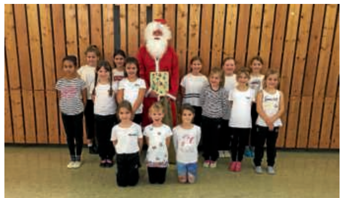
Der Nikolaus bei der Prinzengarde