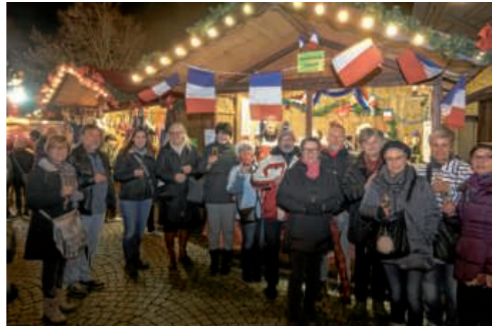
Ein Glas auf die Freundschaft auf dem Bruchsaler Weihnachtsmarkt