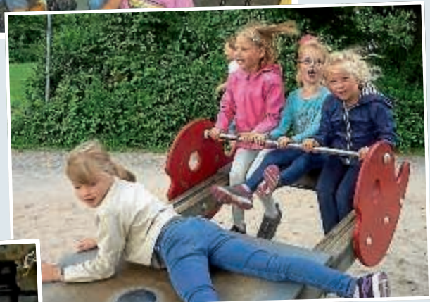
▲ Viel Spaß haben die Kinder immer wieder beim Aufsuchen der zahlreichen Spielplätze in Bruchsal.