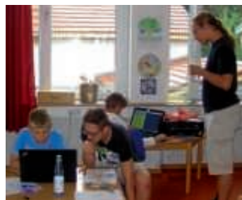
Das Turnierbüro bei der Arbeit!