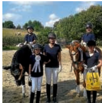
Strahlende Gesichter bei den Heildesheimern nach dem Führzügel

Auch zahlreiche Reiter (vor allem aus dem Jugendbereich) haben an verschiedensten Prüfungen teilgenommen und konnten zahlreiche Schleifen sammeln – eine Übersicht finden Sie hier: