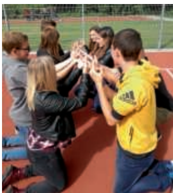
Teambuilding bei den Auszubildenden der Stadtverwaltung Bruchsal.

Sobald einer ein bisschen mit den Fingern nach oben gegangen ist, mussten die anderen folgen, damit sie den Kontakt zum Stab nicht verlieren. So ging der Zollstock oft statt nach unten, wie von Geisterhand nach oben. Erst, wenn man als Gruppe ein gemeinsames Tempo zum Absenken gefunden hat, war die Aufgabe lösbar.