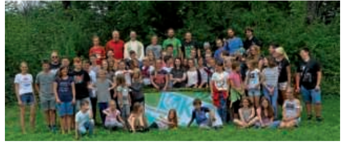
Zeltlager der KjG St. Peter und Paul