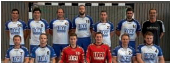
1. Mannschaft des TV Büchenau