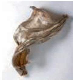
„Flying Torso“, Flachs- faser und Kupferdraht- zeichnung

Die Materialität des Papiers zu verstehen und es selbst herzustellen gehört für Wilhelm Morat zum künstlerischen Schaffensprozess und ist integraler Bestandteil seiner Arbeit. Dazu stellt er das Papier mit eigens dafür angebautem Hanf und Flachs in seiner Papiermühle her und erforscht die Materialeigenschaften des Naturfaserstoffes. So entsteht beim Gestaltungsprozess eine fruchtbare Kooperation zwischen