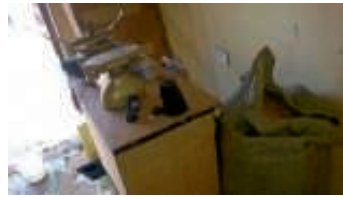
Uganda: Blick auf den Arbeitsplatz eines Händlers in Kyamulibwa

Neben der HIV – Bekämpfung beschäftigt sich der Konvoi – Partner KAP nun schon einige Zeit erfolgreich mit landwirtschaftlichen Projekten. Ziel hierbei ist die Bevölkerung in Lohn und Brot zu bringen und die Ernährung zu sichern. Neuerdings aber auch Einkommen für die Organisation selbst zu erwirtschaften, um zukünftig beispielsweise die HIV – Aufklärung unabhängig von Spendeneingängen gestalten zu können.