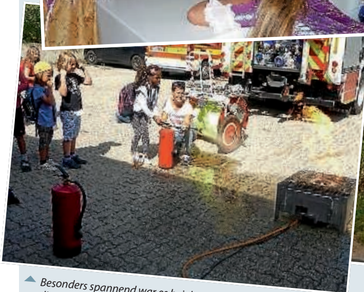
▲ Besonders spannend war es bei der Heidelheimer Feuerwehr, wo die Kinder u.a. aktiv einen Löschvorgang miterleben konnten.