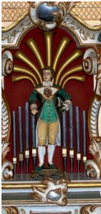
Dirigent, Karussellorgel A. Ruth & Sohn, Waldkirch 1903