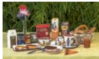
Faires Frühstück

Der Weltladen Bruchsal veranstaltet in Kooperation mit der FairTrade Stadt Bruchsal und den FairTrade Partnern REWE, Füllhorn und dem E-Center am Samstag, den 16. September ab 9.00 Uhr auf dem Kübelmarkt ein „Faires Frühstück“. Fair-wöhnen werden die Gäste mit Produkten aus Fairem Handel und regionalen Produkten. Das gleichzeitig auf dem Kübelmarkt stattfindende Fest „Spaß und Genuss“ bietet regionale Brotspezialitäten an. Mit ihnen wird es eine duftende Grundlage für die herzhaften oder süßen, fair gehandelten Brotaufstriche geben. Dazu werden frischer Kaffee, aromatischer Tee und erfrischende Säfte angeboten.