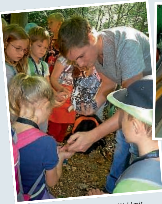
▲ Ausflug in den Heidelheimer Wald mit interessanten Informationen zur heimischen Tier- und Pflanzenwelt.