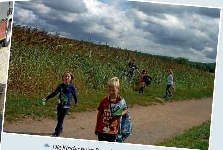
▲ Die Kinder beim Besuch des Hirsellabyrinthes in Büchenau.