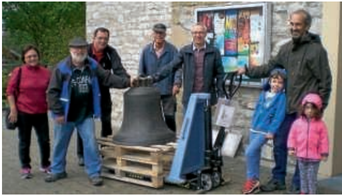
Rückkehr in die Pfarrkirche nach 104-jähriger Abwesenheit: Transport der „Hosanna“-Glocke durch den Arbeitskreis Ortsgeschichte und unterstützenden Helfern.

die Büchenauer Variante des gesamtstädtischen Programms zum „Tag des offenen Denkmals“ am letzten Sonntag fand eine erfreuliche Resonanz. Rund 160 Besucher interessierten sich für das, was vom Gebäude der Pfarrkirche aus dem Jahr 1742 anlässlich der Schönborn-Weihe noch vorhanden ist. Dazu zählt ein großer Teilbereich des Kirchturms, von dessen Besteigungsmöglichkeit 60 Besucher Gebrauch machten. Flankierend zur Besichtigung der „Hosanna“ von 1476 und des Originals der „Schulglocke“ von 1768 sowie zweier Bilderwände im Kirchenschiff rundeten vier Vorträge, welche zusammen nahezu 100 interessierte Zuhörer fanden, das Programm ab.