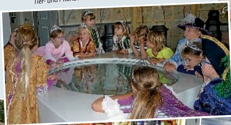
◀ Ein aufregender Museumsbesuch im Schloss Bruchsal begeisterte die Kinder.