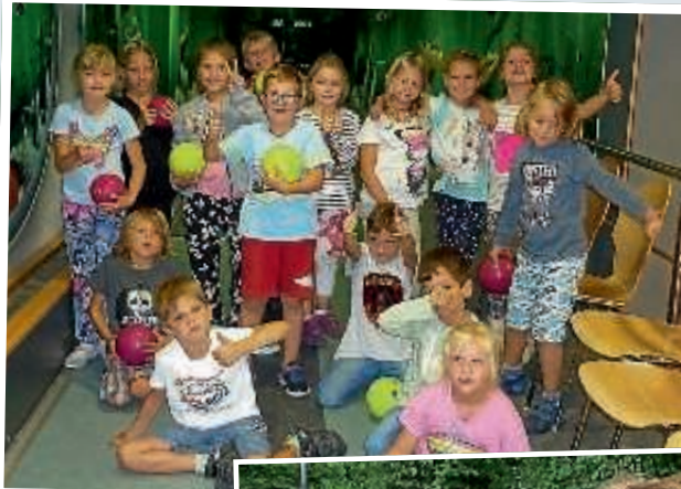
◀ Wie hier beim Kegeln im Haus der Begegnung ging es durchaus öfter sportlich zu.