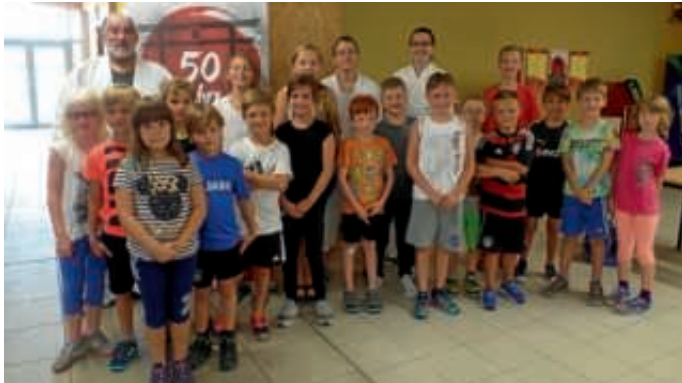
Ferienprogramm beim 1. BBC