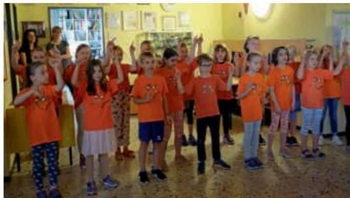
Der Schulchor eröffnete schwungvoll das Jubiläumsfest