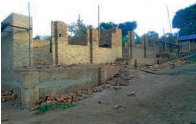
Kiwaawo/Uganda: Die Außenwände des neuen Gebäudes werden gerade hochgezogen.

Am letzten Wochenende bekamen wir den neuesten Bericht und Fotos vom Baufortschritt unseres Erweiterungsbaus in Kiwaawo/Uganda. Derzeit werden die Außenwände des neuen Blocks hochgezogen, an den drei Gebäuden, die renoviert werden, wurden bereits Fenster und Türen eingebaut, auch an den neu zu bauenden sanitären Anlagen wird kräftig gearbeitet. Der lokale Förderverein beteiligt sich mit freiwilligen Helfern an den Arbeiten, um die Baukosten gering zu halten. Nach Abschluss der Bauarbeiten soll die Schule auch als Zentrum für die HIV – Aufklärung für Jugendliche genutzt werden.