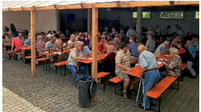
Besucher beim Grillfest der Guggenmusik Nashörner

Am Donnerstag, 20. Juni fand das Grillfest der Guggenmusik Nashörner statt. Trotz wechselhafter Wettervorhersagen hatten wir großes Glück und meist Sonnenschein. Zahlreiche Besucher haben den Weg in die Friedrich-Hebbel-Straße in Obergrombach gefunden. Ein besonderes Highlight war die ganze Rinderkeule, die zwölf Stunden lang über Nacht gegrillt wurde, bis sie pünktlich ab 11.30 Uhr serviert werden konnte. Für die musikalische Unterhaltung beim Mittagstisch sorgte die Seniorekapelle des Musikverein Obergrombach – herzlichen Dank für das gute Programm. Bis in die Abendstunden lockte es die Obergrombacher und Freunde der Guggenmusik Nashörner auf das Grillfest. Neben verschiedenen Grillspezialitäten, wurden auch leckere Kuchen und Torten angeboten. Wir bedanken uns auf diesem Weg bei unserem Grillmeister Tim Lindenfelser, welcher die Rinderkeule in der Nacht zuvor bewacht und das Grillfeuer am brennen gehalten hat (auch als Sturm aufkam). Ebenfalls bedanken möchten wir uns für die zahlreichen Kuchen Spenden, bei den Mitgliedern, die zur Verwirklichung dieses Festes beigetragen haben, bei allen Besuchern, bei den Anwohnern für die Toleranz und ganz besonders danken wir Familie Lamberth für die Nutzung der Alois-Lamberth-Halle.