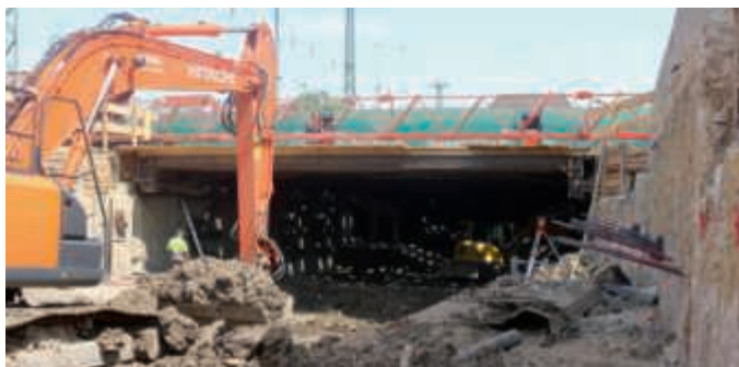
Am Bahnhof Bruchsal gehen die Arbeiten voran.