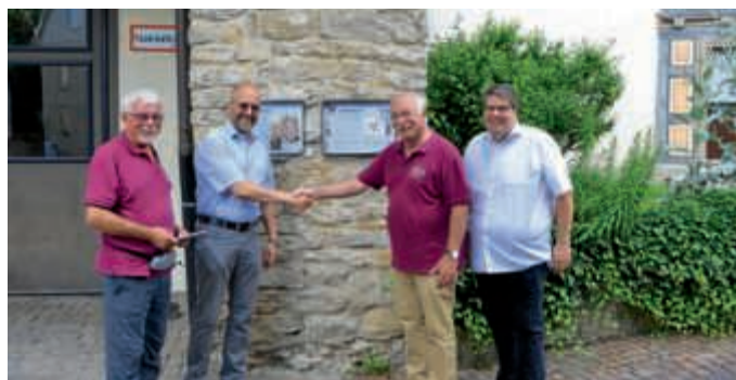
Historische Tafeln Obergrombach mit QR-Code