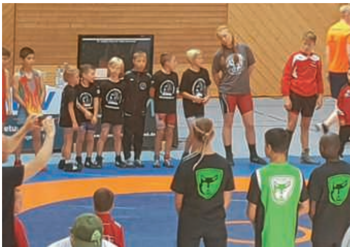
ASV Ringer beim Einmarsch