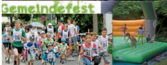
Gemeindefest der Evangelischen Kirchengemeinde