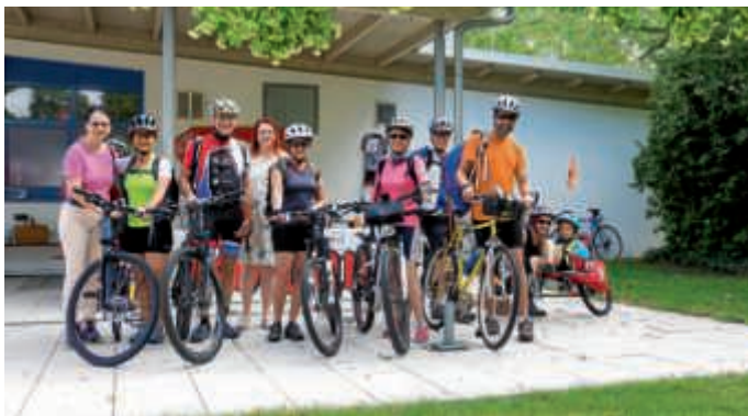
Die Radler aus Ste. Marie-aux-Mines und ein Teil der Gasteltern vor dem Start zur RTF