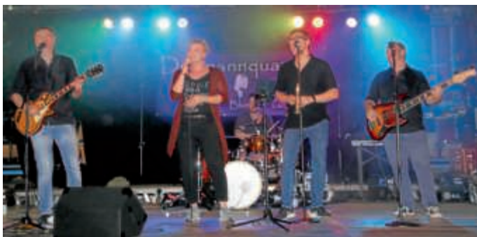
Das Dreimannquartett auf dem Marktplatzfest 2019