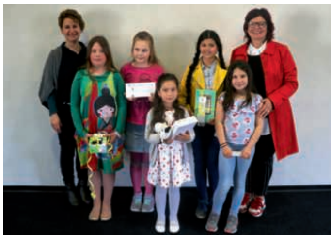
Preisträgerinnen der Stirumschule

Preisverleihung fand am Dienstag, 14. Mai in Bretten statt. Die jungen Künstlerinnen wurden geehrt und die Hauptgewinne wurden übergeben. Jede Gewinnerin bekam eine Kopie ihres Gewinnerbildes als Puzzle gerahmt überreicht.