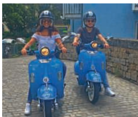
„moritz“-E-Roller auf der Nepomukbrücke

Er sieht ein bisschen nach „bella Italia“ aus, weckt in seiner Anmutung einer Vespa die Italiensehnsucht der Deutschen, wie sie besonders in den Sechzigerjahren ausgeprägt war. Im Italienischen heißt Sehnsucht u.a. „la nostalgia“. Schon sind wir bei „moritz“, dem E-Roller für Bruchsal, mit dem frau oder man es nicht nur auf kurzen Strecken gelingt, „fare bella figura“. „moritz“ ist übrigens auch ideal für die Fahrt an den schönsten Strand der Stadt, das SaSch!-Freibad. Im Rahmen der Promo-