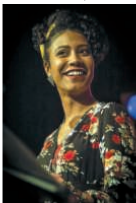
D'Cuba Son