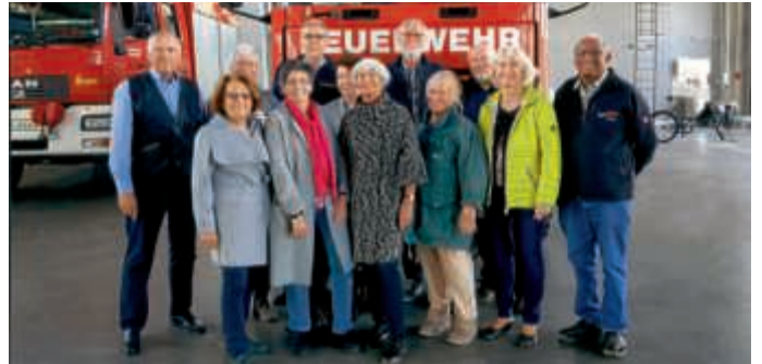
Seniorenrat zu Besuch bei der Landesfeuerwehrschule

kann. Eine zweispurige Straße mit Strassenbahnschienen, Autos und Oberleitung ausgestattet, steht ebenfalls zur Verfügung. Dort werden Übungen zur technischen Hilfeleistung bei Verkehrsunfällen durchgeführt. Eine wichtige Einrichtung ist auch die Gefahrstoff-Übungsanlage an der wir eine laufende Übung beobachten konnten. Nach dem Besuch in der Übungshalle, dort sind zahlreiche Fahrzeuge geparkt die aber ausschließlich Übungszwecken dienen und nicht außerhalb eingesetzt werden, war unsere zweistündige Führung beendet. Wir waren alle sehr beeindruckt, sind stolz auf diese Einrichtung in Bruchsal und dankbar, dass es Menschen gibt die sich zu unserem Schutz engagieren.