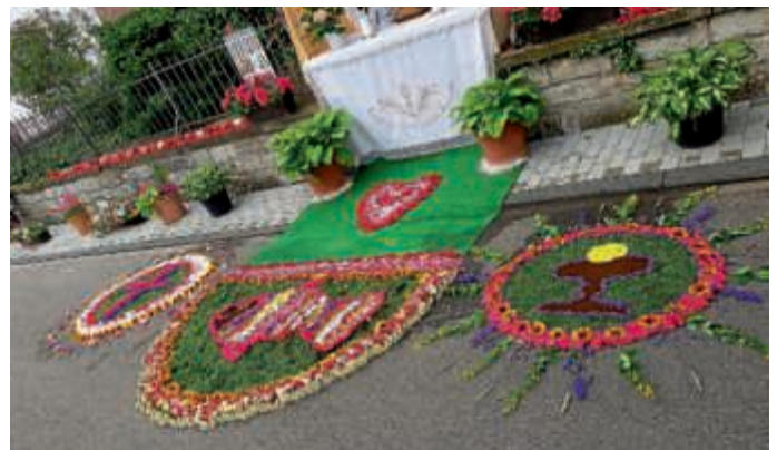
Von den Kommunionkindern gestalteter Altar