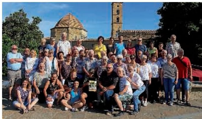
Reisegruppe vor dem Hintergrund der Kathedrale und dem Baptisterium Volterras

Der Freundeskreis Volterra organisierte vom 14. bis 21. Juni eine Reise in die bezaubernde Toskana zu unserer Partnerstadt Volterra. Kulturelle Hochgenüsse gab es natürlich in Volterra selbst, aber auch in San Gimignano und den Ausgrabungsstätten von Populonia, einer etruskischen Eisenindustriestadt. An einem Nachmittag am Golf von Baratti verwöhnten uns dann Sonne und Meer, während die kulinarischen Hochgenüsse kein Ende zu nehmen schienen: Weinproben und gute italienische Küche schon auf der Hinfahrt im Piemont, in Volterra bei der Cantina di Fabio oder beim Käsebauern Lischeto oder bei