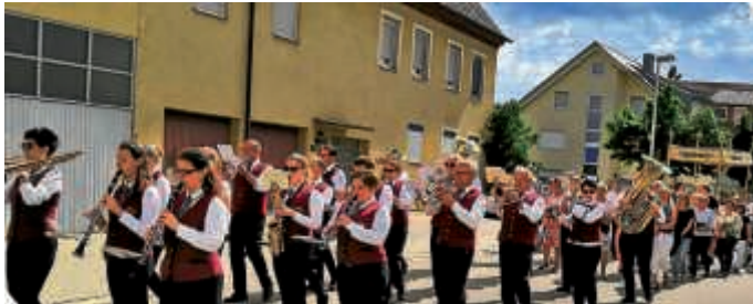
Fronleichnamsprozession untermalt vom MVO

Wie jedes Jahr umrahmte der Musikverein Obergrumbach die Fronleichnamsprozession. Mit feierlichen Märschen begleiteten die Musiker/innen die katholische Kirchengemeinde durch den Ort zu den verschiedenen Stationen mit dem Blumentepichen und Altären. Während die Orgelbegleitung nur in der Kirche möglich ist, half der MVO den Gläubigen dabei, an den einzelnen Stationen den richtigen Ton der jeweiligen Kirchenlieder anzustimmen. Es war zwar schlechtes Wetter angesagt, aber während des Festzuges kam die Sonne hervor, so dass es ein strahlendes Erlebnis wurde. Auf gutes Wetter und wunderbare musikalische Unterhaltung zählt der MVO auch am kommenden Wochenende, wenn von Sonntag bis Montag das Musikfest in der Dreschhalle steigt.