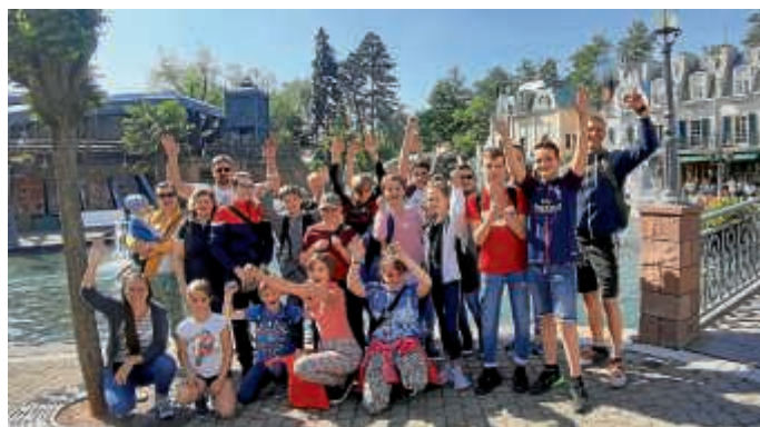
Judokas im Europa-Park

Achterbahnen fahren oder beim gemeinsamen Besuch im 2017 eröffneten Flugsimulator „Voletarium“. Dem positiven Feedback zu Folge wird das sicher nicht der letzte Vereinsausflug in Deutschlands beliebtesten Freizeitpark gewesen sein.