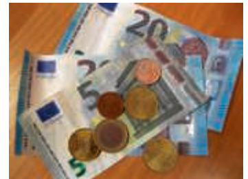
Ohne Moos nix los

Es gibt eine Projektidee, die Ihr gerne mit Eurer Gruppe umsetzen möchtet? Ihr plant eine Freizeit oder möchtet Euch mit Jugendlichen aus Eurer Partnerstadt treffen? Der Abend bietet ausführliche Informationen, wie man mit Stiftungen zusammenarbeiten kann. Von der Antragstellung bis zur Abrechnung wird erprobtes Material zur Verfügung gestellt. Außerdem geht es darum, wie mit der Finanzierungsdatenbank Baden-Württemberg gearbeitet wird. Dort finden sich Förderhinweise zu Landes- und Bundesmitteln, EU-Geldern, usw. Neben den Möglichkeiten, die die Jugendstiftung bietet, kann man auch von der Förderung des Landes über den sog. Landesjugendplan profitieren. Ziel dieser Fortbildung ist, einen Überblick über die verschiedenen Zuschussmöglichkeiten zu geben. Die Teilnehmenden können ihre Ideen und Projekte beschreiben und gemeinsam Finanzierungsmöglichkeiten erarbeiten.