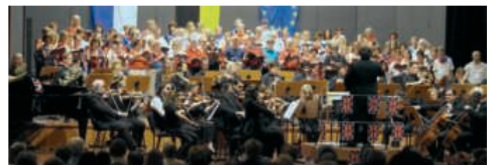
Das JKG präsentiert die Bruchsal Proms