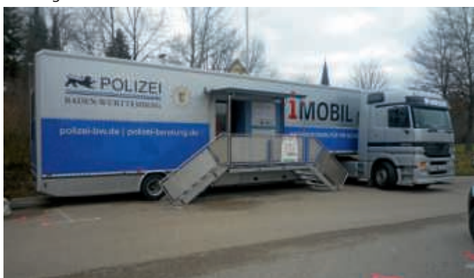
„Sicher Wohnen – Einbruchschutz“ i Moibil zu Besuch in Bruchsal

Im so genannten „i MOBIL“ bekommen Sie die richtigen Tipps zur Sicherung von Fenstern, Türen und anderen Bereichen des Hauses, der Wohnung oder auch des gewerblichen Objektes. Eine Vielzahl von Exponaten, von der einfachen Fenster- bzw. Türsicherung bis zur Überfall- und Einbruchmeldeanlage machen deutlich, wie man sich wirkungsvoll schützen kann.