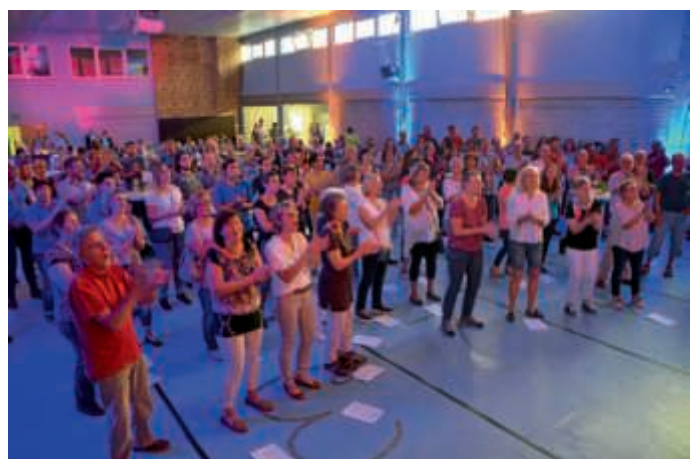
Hey brother, hey sister, let's sing!