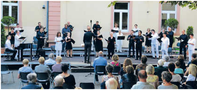
Der Kammerchor im Innenhof des Schönborn-Gymnasiums

Ein Konzert unter den Bäumen im Innenhof des Schönborn-Gymnasiums Bruchsal an einem lauen Sommerabend: Viele Besucher wollten sich den Zusammenklang von Musik und Natur nicht entgehen lassen. Und sie wurden nicht enttäuscht: Der Streifzug durch die englische Chormusik von John Dowland bis Edward Elgar zeigte den Reichtum dieser oft unterschätzten Musik. Der Chor unter der Leitung von Sebastian Hübnert setzte die unterschiedlichen Anforderungen der Stücke in gewohnter Souveränität um: Liebeslieder mit dem eindeutigen, aber nicht ernst gemeinten Wunsch, mit dem Geliebten zu sterben, die Sehnsucht nach einem Land, das nach dem Schrecken der Welt Frieden schenkt und die leichten, flockigen Sommerlieder: Der Chor sang in großer Intensität und mit viel Stilbewusstsein und entließ die Zuhörer mit einem bayerisch-englischen Wiegenlied von Edward Elgar in den Sommerabend.