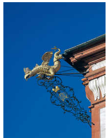
Drache an der Außenfassade

Der Eintritt beträgt 12 Euro für Erwachsene, ermäßigt 6 Euro und 30 Euro für Familien. Für die Führungen gilt die Einhaltung der Abstands- und Hygieneregulungen sowie die Pflicht zum Tragen einer medizinischen Mund-Nasen-Bedeckung. Es werden Kontaktdaten abgefragt.