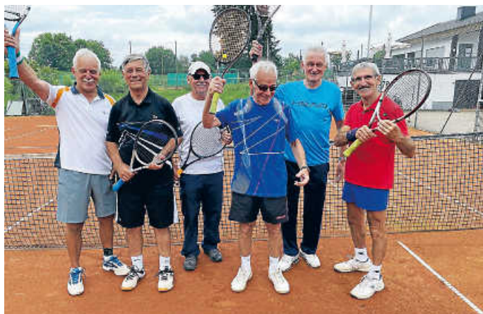
Meistermannschaft Herren 65