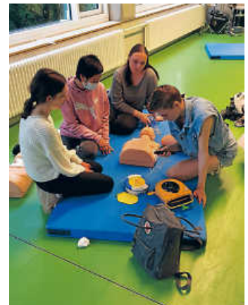
Die Ersthelfer in Aktion

29 Schüler/-innen lernten, wie man eine Notsituation einschätzt und eine Gefahrenstelle absichert. Dann stand der nächste Schritt auf dem Programm – die Lagerung von Verletzten sowie die Erstversorgung von Wunden. Bei sehr schweren Verletzungen müssen häufig auch Reanimationsmaßnahmen eingeleitet werden und der Umgang mit einem Defibrillator (AED) will geübt sein. Und genau diese Übungsmöglichkeit erhielten die Schülerinnen und Schüler an diesem Tag. Die Jungs und Mädels hatten viel Spaß und sind nun bestens für den Ernstfall gerüstet.