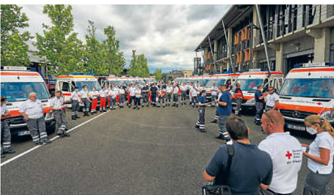
Zahlreiche Einsatzfahrzeuge trafen sich vor der Bruchsaler Feuerweherschule

In der vergangenen Woche trafen sich an der Landesfeuerwehrschule in Bruchsal rund 100 Krankentransportwagen aus ganz Baden-Württemberg, von wo aus sie in die Katastrophengebiete in Rheinland-Pfalz, voraussichtlich in die Region rund um Ahrweiler, starteten. Rheinland-Pfalz hatte angesichts der unwitterbedingten Katastrophenlage um länderübergreifende Amtshilfe gebeten. Der Einsatz fand auf Anordnung des Innenministeriums statt. Auch die Polizei, Feuerwehr und die Pfadfinder haben sich in die zerstörten Regionen am vergangenen Wochenende aufgemacht und werden dort vor Ort unterstützen.