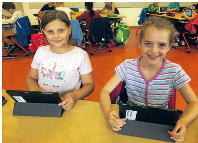
Das macht Spaß

Begeistert nutzen die Schüler/-innen der zweiten Klassen der Stirumschule seit einigen Wochen die neuen Samsung-Tablets im Unterricht. Die Einführung in die Bedienung meisterten die Kinder schnell und erkundeten unter Anleitung der Lehrkräfte spielerisch die vorhandenen Apps auf den Geräten. Jedem Kind steht hierbei ein eigenes Tablet zur Verfügung. Ob Texte verfassen mit „Word“, Lesen trainieren mit „Antonlin“, fotografieren oder Mathematikaufgaben in der App „Anton“ oder „Schlaukopf“ lösen. Die Möglichkeiten sind vielfältig und die Zweitklässler sehr motiviert bei der Sache. Vielen Dank der Elternschaft, die die Geräte eingerichtet hat und vor allem dem großzügigen Sponsor.