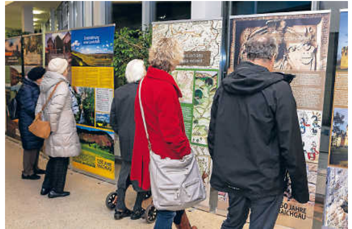
Die Wanderausstellung „1250 Jahre Kraichgau – Vielfalt in Geschichte und Gegenwart“ ist am 1. August in der Untergrombacher Bundschuhhalle zu sehen