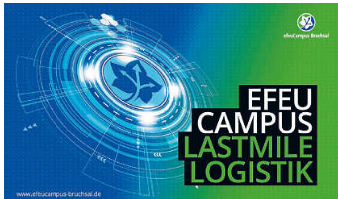
Futuristische Darstellung efeuCampus Bruchsal

Freuen Sie sich demnächst wieder auf spannende Informationen und Neuigkeiten rund um unsere Themen! Schauen Sie in der Zwischenzeit doch gerne mal vorbei! Wir freuen uns, mit Ihnen in Kontakt zu treten. Aufgrund der aktuellen Situation bevorzugt über unsere Social-Media-Kanäle (Instagram, Facebook, LinkedIn, YouTube) oder über unsere Website unter www.efeu-campus-bruchsal.de .