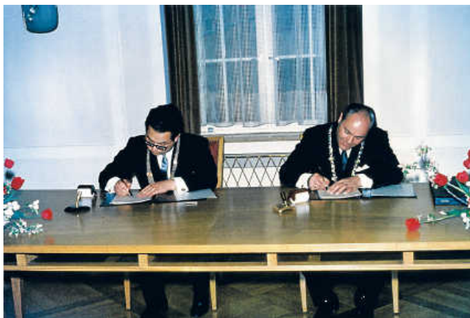
Vertragsunterzeichnung Doll/Dr. Bieringer

Alle Mitglieder und Freunde des Heimatvereins Untergrombach sind hierzu herzlich eingeladen. Martin Lauber