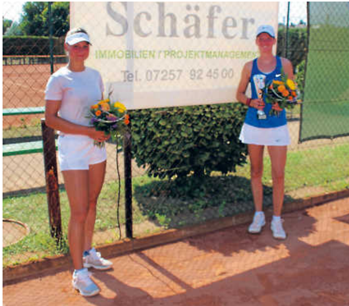
Vorjahresfinalistinnen des MBT