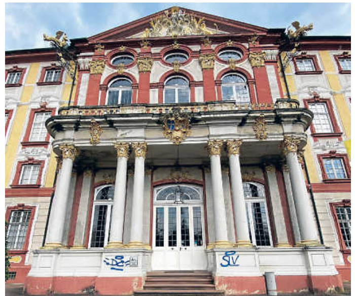
Der Haupteingang des Schlosses wurde mit Graffiti beschmier

Es waren wieder Sprayer am Werk: Sie beschmiereten Wände im Schlossbereich und vor allem am Schlosshauptgebäude. Die Graffiti finden sich auf den bemalten Wänden und sogar am Haupteingang des Schlosses. Über 20 Stellen wurden im Schlossgelände besprüht: Dieser Akt des Vandalismus – in Fotos dokumentiert – wurde unmittelbar bei der Polizei angezeigt.