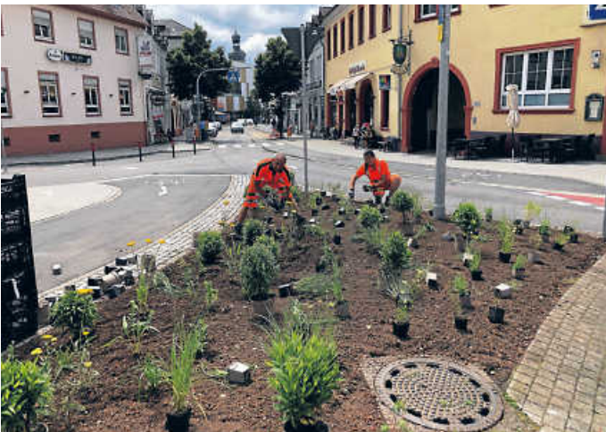
Die Mitarbeiter des Baubetriebshofs verschönen mit neuer Bepflanzung die Verkehrinseln in der Stadt