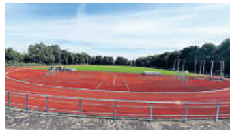
Neues Spielfeld

Am Samstag, 10. Juli, trafen sich Spieler/-innen der SG Heideisheim/Helmsheim, um auf dem Tartanplatz im Stadion Helmsheim ein Handballspielfeld zu markieren und die neu angeschafften, umfallsicheren Handballtore zu montieren. Schneller als gedacht wurden die weißen Linien perfekt auf das Kunststoffspielfeld gesprüht