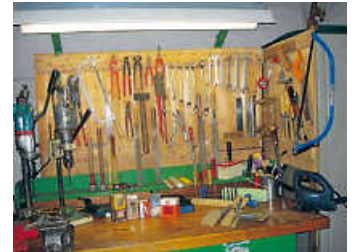
Gute Werkzeuge aller Art dringend benötigt!

Unsere nächste Sachspendensammelaktion für bedürftige Menschen ist am Samstag, 31. Juli, von 16.30 bis 19 Uhr in Oberhausen, Weiherweg 22. Wer es einrichten kann, sollte eher zwischen 17.30 und 19 Uhr kommen, um lange Wartezeiten zu vermeiden. „Wir bitten um gute, gebrauchsfähige Sachspenden, die wir direkt an Bedürftige verteilen! Damit bewahren wir auch wertvolle Wirtschaftsgüter vor der Verschrottung und führen sie direktem Recycling zu. Denn Wiederverwendung dient auch dem Umweltschutz! Wir sammeln gute Fahrräder, Werkzeuge, Gartengeräte, Kinderwagen jeder Art, Küchengeräte, Waschmaschinen, Kühl-/Gefrierschränke (nicht älter als zehn Jahre), gute, massive Kleinförmel (bis einen Meter Seitenlänge), Einzel- und Kinderbetten, schmale Kleiderschränke, Nähmaschinen und Stoffe, Wolle, Schreib- und Schulsachen, Musikinstrumente, kleine Legos, kleine Plüschtiere, Toilettenartikel, Windeln, Brillen, Hörgeräte, kleine Holz-/Kohle-Öfen, gute Laptops und Smartphones. Möglichst in Bananenkartons: gewaschene Kinder-, Jugend- und Erwachsenen-Kleidung, Bettwäsche, gute Schuhe. Flutopfer können jederzeit von unserem Lagerbestand versorgt werden!