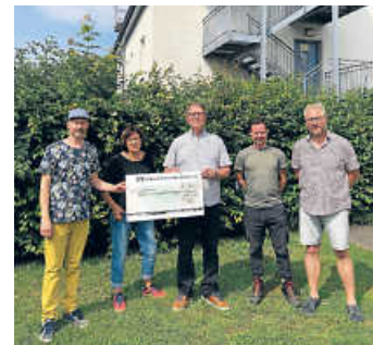
Spendenscheck-Übergabe vor dem Jugendhaus