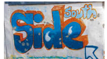
Es geht wieder los

Liebe Kids, liebe Jugendliche und Eltern, wir freuen uns, dass wir nach einer langen Zeit endlich wieder durchstarten dürfen. Zu den folgenden Zeiten haben wir coole Angebote für Euch!