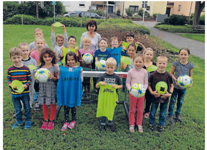
Fußballtore für die Schule