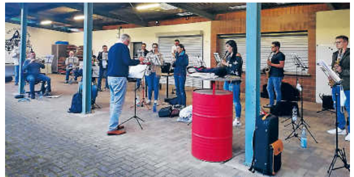
Musikprobe beim Hundeverein