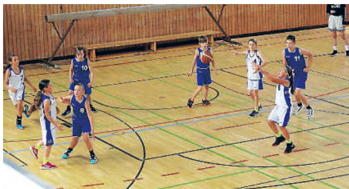
Berghausen - TSG Bruchsal