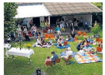
Ökum. Gottesdienst