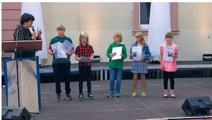
Ringer bei der Sportlerehrung 2021