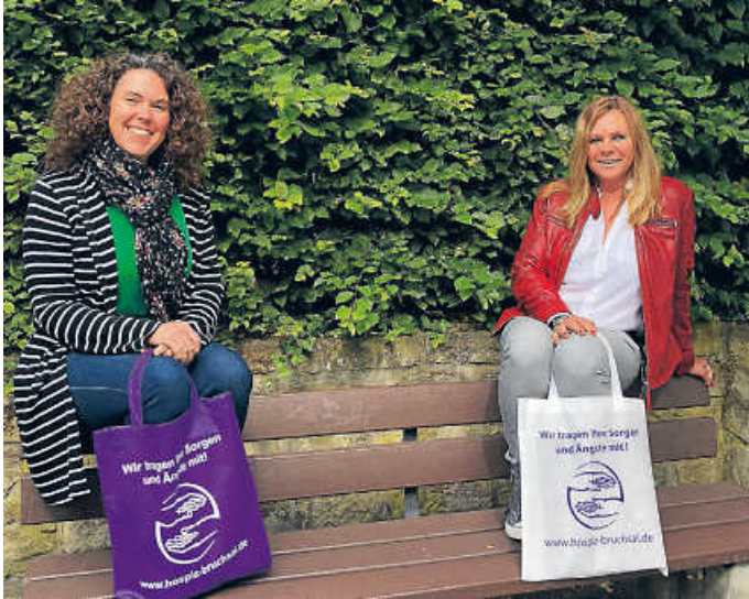
Wir sind für Sie da!