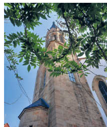
Gottesdienst unter dem Heidelshemer Kirchturm

Das Heidelshemer Reichsstadtfest konnte am vergangenen Wochenende zwar nicht stattfinden, doch zumindest wurde der zu diesem Anlass übliche Open-Air-Gottesdienst auf dem Kirchplatz gefeiert. Aufgrund der großzügigen räumlichen Lage war uns eine musikalische Umrahmung in größerer Chorstärke möglich. Mit Blick auf unseren imposanten Kirchturm erklang somit bei wunderschönem Sommerwetter ein deutliches „Lebenszeichen“ des Posaunenchores Heidelberg, zur Freude sowohl der Zuhörer als auch aller Mitwirkenden.