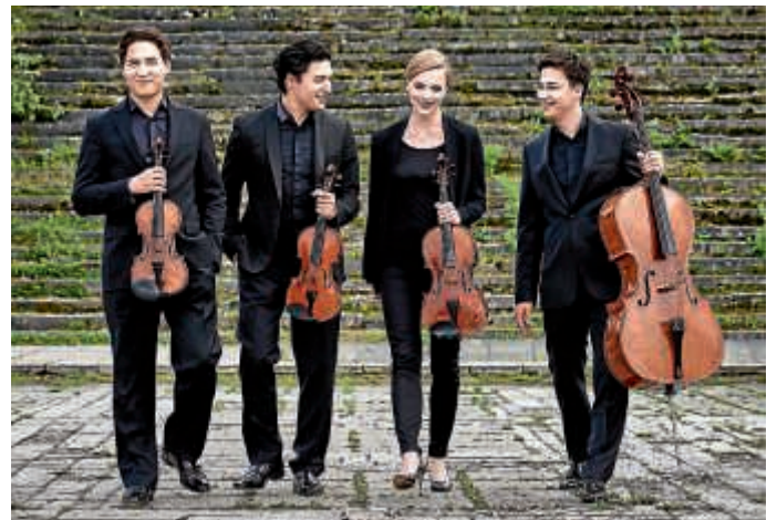
Das Schumann Quartett: „Rising Star“ der weltweiten Kammermusikszene

In diesen Tagen hat der Vorverkauf für die kommende Spielzeit der Bruchsaler Schlosskonzerte 2018/19 begonnen. Im gewohnt exquisiten Programm dieser auch überregional viel beachteten Konzertreihe finden sich erneut prominente Namen stilprägender und weltweit renommierter Interpreten und Ensembles wie auch wieder spannende Neuentdeckungen der internationalen Kammermusikszene mit aufstrebenden Musikern der jungen und jüngsten Generation.