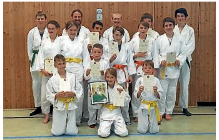
Prüflinge der Aikido Abteilung