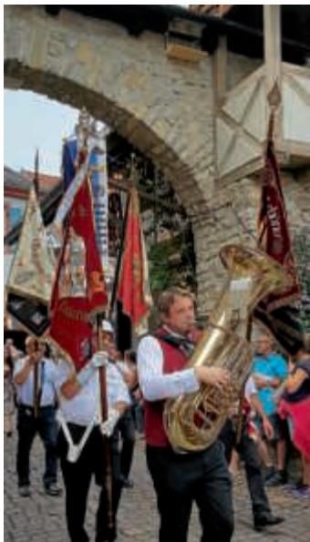
MVO führt den Festzug an

Am Samstag, 21. Juli führte der Musikverein den Festzug zur Eröffnung des 20. Burgfestes musikalisch an. Zwischen den verschiedenen Begrüßungsansprachen und dem mittelalterlichen Anspiel intonierte einige Mitglieder des Musikvereins Fanfarenstöße vom Torbogen. Das Hauptorchester ließ den Marsch „Schloss Obergrombach“, das Badenerlied und das Obergrombach-Lied erklingen, in die das Publikum sofort mit einfiehl. Ein unbeschreibliches Gefühl, wenn das ganze Städtl mitsingt. Natürlich wurde auch der gelungene Weinfassanstich untermauert.