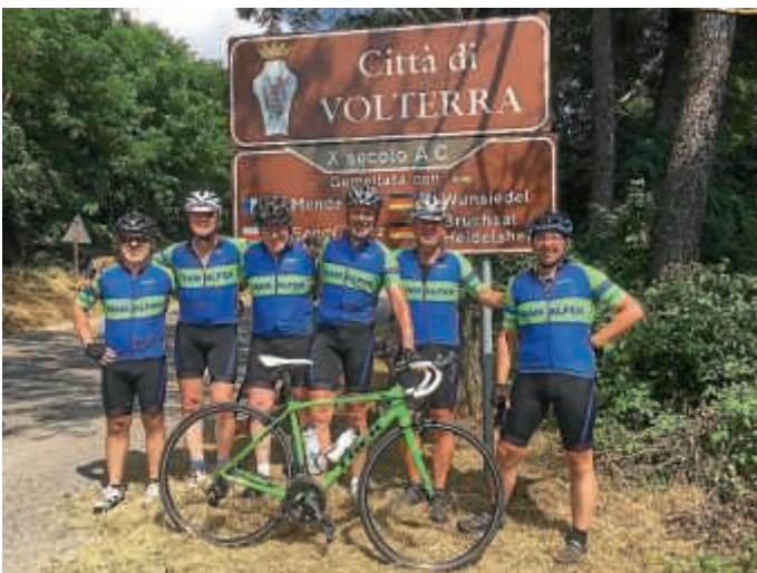
„Team Alpen“, eine Rennradgruppe aus Heidelberg

Große Hitze und Schaltungsschaden Radrennfahrer aus Heidelberg hatten auf der Fahrt nach Volterra einige Widrigkeiten zu meistern.