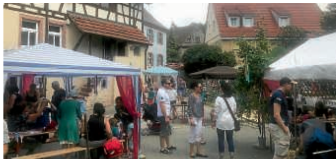
Buntes Treiben auf dem Burgfest 2018