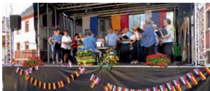
GV Auftritt beim letzten Kelterfest