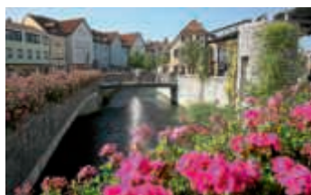
Bruchsal Kübelmarkt

Da sind das traumhafte Areal des Barockschlosses und das imposant-filigrane fürstbischöfliche Schießhaus „Belvedere“ im Stadtgarten, in dem sich dereinst feine Jagdgesellschaften getroffen haben. In der kleinen Kapelle „Heiliges Grab“ begegnen dem Besucher Barock, Historismus und Jugendstil. Und in der ehemaligen Kaserne in der Huttenstraße aus dem 18. Jahrhundert trifft man auf einen Zeitzeugen des berühmten Barockbaumeisters Balthasar Neumann.