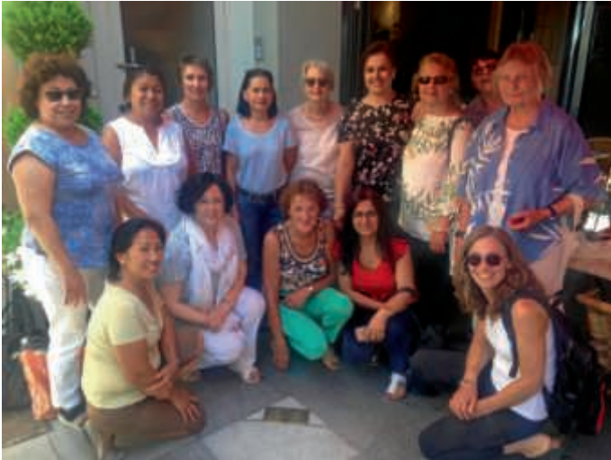
Stolperstein in der Friedrichstr. 40

Internationales Frauencafé Bruchsal beteiligte sich an der Stolperstein-Aktion