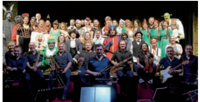
Ensemble, Crew & Band der Musikklassse 2018