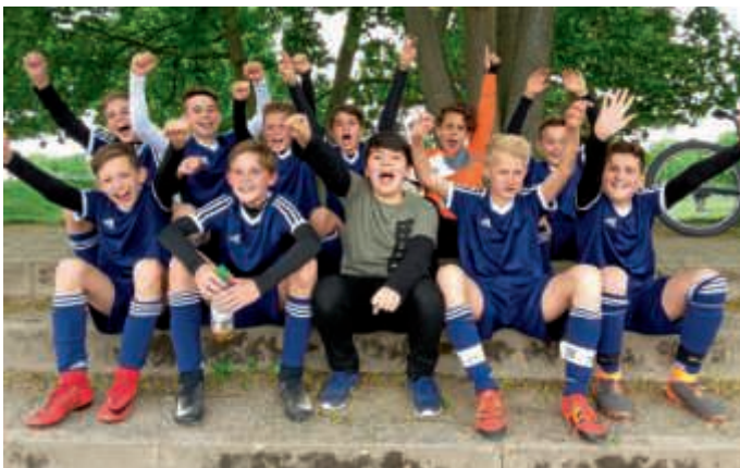
Die Mannschaft Jungen Wettkampf IV

Nachdem das Justus-Knecht-Gymnasium in den letzten Jahren mit immer mehr Fußballmannschaften an den Wettkämpfen „Jugend trainiert für Olympia“ teilnahm, durften sich die Fußballerinnen und Fußballer aller Altersklassen über neue Trikots freuen. Der Freundeskreis des JKG stiftete die Trikots und sorgte für einen einheitlichen Auftritt der Mannschaften. Mit Größen von 125 bis XL findet jede Spielerin bzw. jeder Spieler das passende Outfit. Und selbst bei gleichzeitig stattfindenden Turnieren ist für genügend Trikotsätze gesorgt. Dafür ein herzliches Dankeschön der Mannschaften.