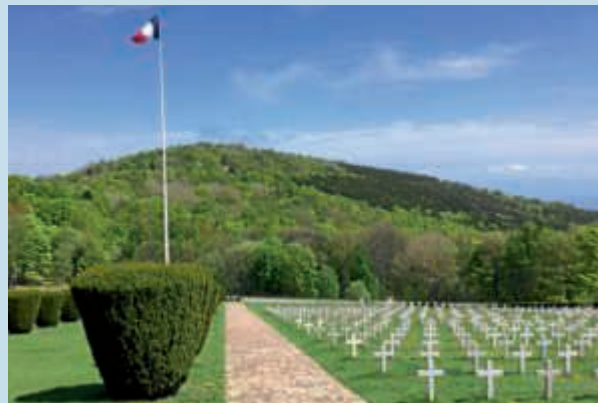
Hartmannsweilerkopf mit Blick auf das Hochkreuz

Karlsruhe, 11.07.18: 2018 jährt sich zum 100. Mal das Ende des Ersten Weltkriegs. Anlass für den Volksbund Deutsche Kriegsgräberfürsorge e.V. Nordbaden, Tagesfahrten zu Erinnerungsstätten dieses Krieges anzubieten. Diese Orte führen die Folgen des Ersten Weltkriegs vor Augen. Die Erinnerung daran wachzuhalten, ist aus Sicht des Volksbunds wichtig: Denn nur wenn die Menschen sich an die Vergangenheit erinnern, kann Zukunft gestaltet werden. Auf dem südöstlich von Freiburg liegenden Hartmannsweilerkopf wurden während des Ersten Weltkriegs zwischen den damaligen Feinden erbitterte Schlachten ausgefochten. Heute befinden sich dort die erste gemeinsame französisch-deutsche Gedenkstätte wie auch das im November 2017 eröffnete historische Informationszentrum „Historial“. Neben dem Historial wird das Schlachtfeld mit erhaltenen Gräben und Unterständen unter Leitung eines ortskundigen Reiseleiters besucht.