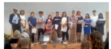
Abschlussfeier der 9. Klasse

Am Freitag, 13. Juli, feierte die 9. Klasse ihren Abschluss in der Mensa der Schule. Alle Eltern und zum Teil auch Großeltern der Entlassschüler konnten miterleben, wie die anderen Klassen mit sehr schönen und stimmungsvollen Liedbeiträgen, einer „Zirkusdarstellung“ und Mundharmonikastücken die Feier gestalteten.