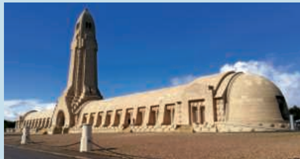
Verdun – Beinhaus von Douaumont

Kaum ein anderer Ort steht für die Menschenverachtung und das industrielle Töten im Ersten Weltkrieg wie Verdun.