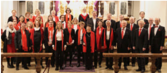
Deutsch-Französischer Chor München

Francis Poulenc, Komponist des 20. Jahrhunderts, entwickelte eine eigene, unverwechselbare Klangsprache; so ist sein „Gloria“ ein besonders farbenreiches Werk mit spannenden, ständig wechselnden Motiven. George Bizets Komposition „Te Deum“ aus dem Jahr 1848 – für einen Wettbewerb geschrieben – wurde erst 1970 wiederentdeckt und uraufgeführt; sie überzeugt mit schönen Gesangsmotiven und klaren Formen. Gabriel Faurés lyrischer „Gesang von Jean Racine“ wird der Ruhepunkt des Konzerts sein.