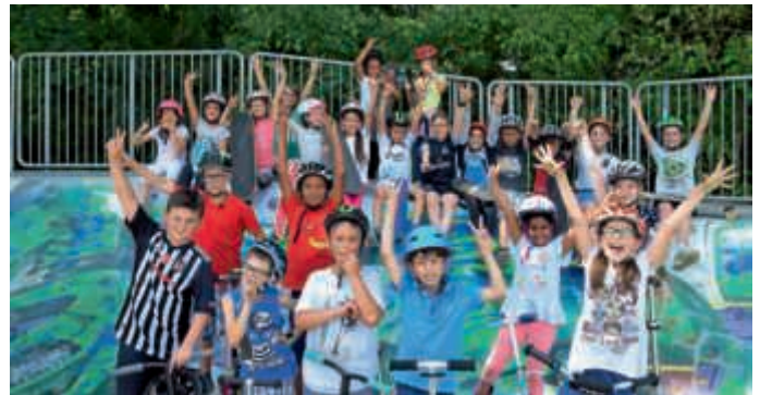
3a im Skaterpark