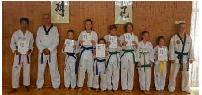
Die Teilnehmer mit ihren Trainern

Am Samstag, 21. Juni, fand um 13.30 Uhr die Kup-Prüfung in der Taekwondoschule Kwak (9. DAN) in Karlsruhe statt. Das Taekwondo-Zentrum-Bruchsal war mit insgesamt acht Teilnehmern vertreten. Alle Prüflinge haben den nächsten Gürtelgrad erreicht.