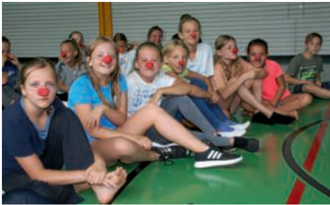
Im Zirkusprojekt gab es viel zu lachen

Schule mal ganz anders, Inhalte, die nicht auf dem Lehrplan stehen, entdecken und kennenlernen, die Neugierde wecken – dafür stehen die Projektstage der Joß-Fritz-Realschule Untergrombach. Mit vielfältigen Angeboten ermöglichte das Kollegium den Schülerinnen und Schülern über drei Tage mit viel Spaß gemeinschaftlich Neues zu erkunden.