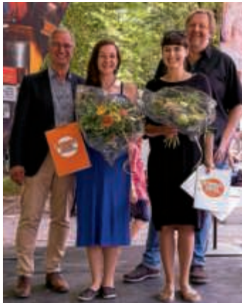
Vergabe der Förderpreise

Am Vormittag des 15. Juli fand die Spielzeitmatinee der Badischen Landesbühne statt, zu der das Theater gemeinsam mit seinem Freundeskreis in den Bruchsaler Schlosspark geladen hatte. In diesem Rahmen wurden auch die beiden Förderpreise des Freundeskreises Badische Landesbühne an zwei junge Ensemblemitglieder vergeben.