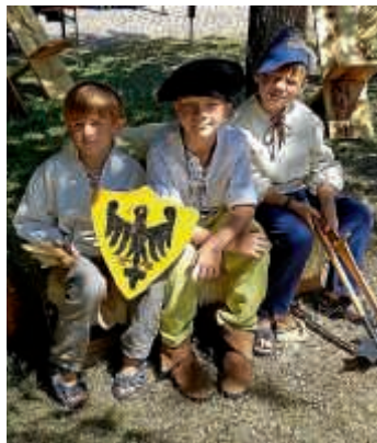
Peter und Paul 2018

Auch dieses Jahr hatte die Bürgerwehr ein Lager am Seedamm auf dem Peter und Paul Fest in Bretten aufgebaut. Mit Hilfe der Löffelstilzchen, die schon jahrelang mit der Bürgerwehr das Lager teilen, waren die Zelte, Bänke und Tische schnell aufgebaut. Doch es war noch sehr viel Arbeit vor und nach dem Lager zu bewältigen, was auch dieses Jahr wieder ohne Probleme gestemmt wurde. Es war ein super Wochenende mit einigen Tanzauftritten, Musikeinlagen und natürlich auch der Teilnahme am Festumzug am Sonntag. An dieser Stelle muss erwähnt werden, dass der reibungslose Ablauf einigen wenigen Bürgerwehrlern zu verdanken ist die