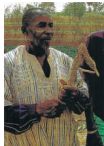
Primitives Bodenbearbeitungsgerät