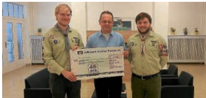
Spendenübergabe Pfadfinder Stamm Christophorus

In diesem Zuge noch der Hinweis auf das bevorstehende Jubiläumswochenende der Pfadfinder „40 Jahre DPSG Bruchsal“, welches der Stamm Christophorus am 8. und 9. September im Pfarrzentrum St. Paul feiern wird.