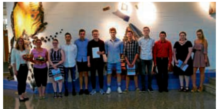
16 Schülerinnen und Schüler erhielten im Juli das Fachhochschulreifezeugnis

An der Balthasar-Neumann-Schule 1 kann die Fachhochschulreife parallel zur Berufsausbildung erworben werden