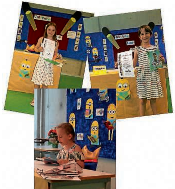
Lesewettbewerb JFGS 2018