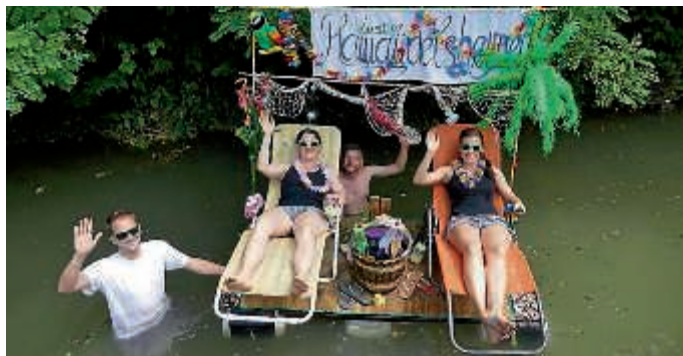
Startkiwwl beim 3. Heidelheimer Melkiwwl-Rennen