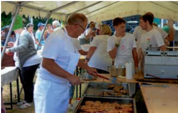
Das Grillteam bei der Arbeit