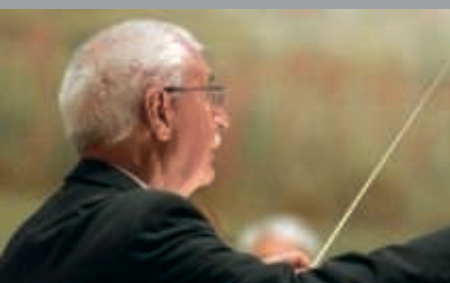
Klassik Open Air am 30. Juli - Noch freie Karten verfügbar!