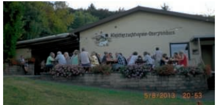
Jungtierschau mit Festbetrieb