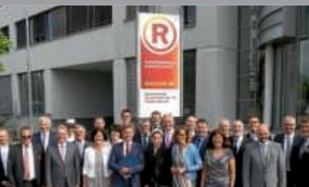
TechnologieRegion Karlsruhe (TRK) GmbH gegründet