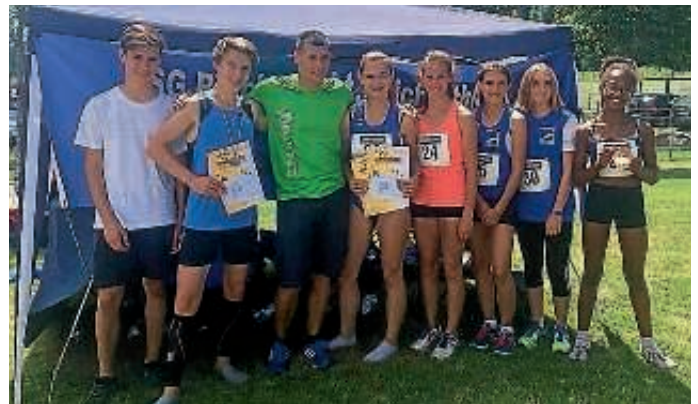
TSG Bruchsal Leichtathletik

Glückwunsch an alle Starter, da es durch die Wettkampfnorm eine Auszeichnung ist dabei zu sein und sich auf Augenhöhe mit den Besten aus ganz Baden zu messen.