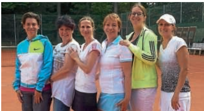
Damenmannschaft beim Auswärtsspiel in Kelttern

Beim letzten Heimspieltag gegen den Karlsruher ETV am Sonntag, 9. Juli. , konnten unsere Damen 30 durch einen souveränen 6:0 Heimsieg auf Platz 2 der Tabelle klettern.