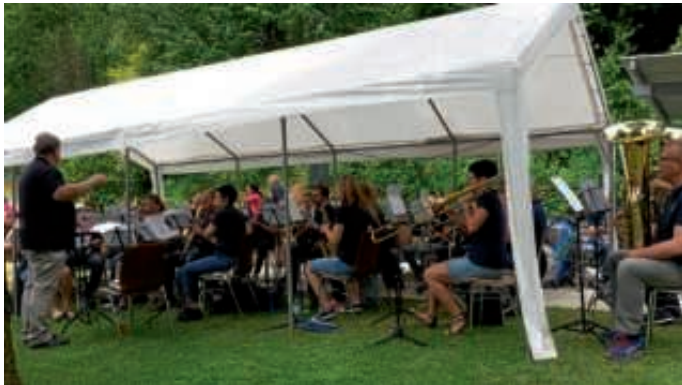
Der MVO auf dem Schwimmbadfest 2017