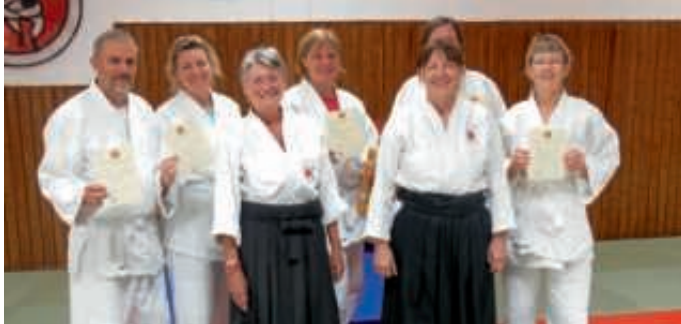
Kyu-Prüfung der Aikido Abteilung

Wir wünschen den Prüflingen weiterhin alles Gute und freuen uns schon auf die nächste Prüfung.