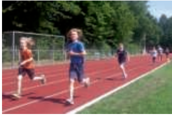
50 m Sprintdisziplin