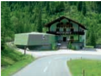
Fossilfunde im Nockalmhof

der Schiestlscharte – in 2024 m Seehöhe- konnten beim läuten der Glocke Wünsche formuliert werden, allerdings nur Fromme. Die Weiterfahrt ging nun zur SILVA MAGICA – den Naturgeheimnissen begegnen – sowie der Ausstellung „Bäume als Überlebenskünstler“ bevor wir unser Mittagessen (vorzügliche Auswahl) auf der Zechneralm einnahmen. Danach hielten wir noch am Nockalmhof. Dort konnten wir wertvolle Fossilfunde besichtigen. Zusätzlich wurde uns in einem 3D-Film „Grüne Inseln im Strom der Zeit“ beeindruckende Landschaften und Tieraufnahmen aus den Nockbergen gezeigt.