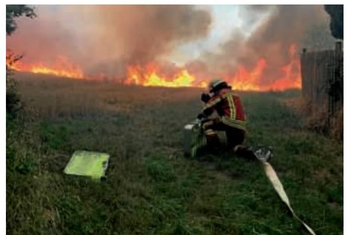
Die Feuerwehrkräfte standen sprichwörtlich vor einer Flammenwand

Beim Eintreffen stellte sich den ersten Einsatzkräften ein verheerendes Bild dar. Etwa 12 Hektar eines dortigen Weizenfeldes standen in Flammen. Das beschreibt eine Größe von etwa 16 Fußballfeldern. Aufgrund der enormen Trockenheit, breitete sich das Feuer rasend schnell aus. Die Flammen drohten auf ein direkt angrenzendes Gebäude des Hofes und an mehreren Stellen auf Bäume und Waldflächen überzugreifen.