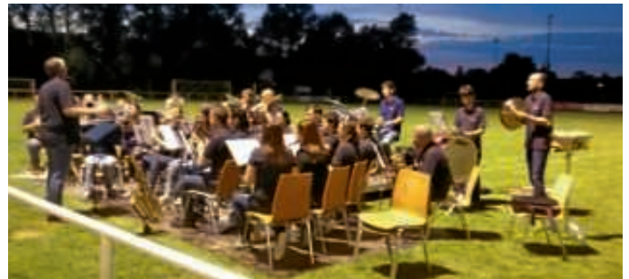
Auftritt beim Sportfest des FC Germania

Longdrinks im coolen Ambiente – willkommen in der Spacebar! Weltraum und Joss-Fritz-Fest – wie geht das zusammen? Kann man nicht beschreiben, muss man erleben! Vom Samstag, 29. Juli bis Montag, 31. Juli jeden Abend ab 17.00 in der Spacebar des GV Bruderbund. Nach der Dschungelbar beim letzten Fest hat sich unser Kreativteam diesmal in den Weiten des Alls inspirieren lassen. Ganz irdisch ist aber unser Angebot (vielleicht vom Alienschleim abgesehen...). Wir freuen uns für unsere Gäste leckere Longdrinks zu mischen, die Trendgetränke Lillet und Aperol anzubieten und mit kühlem Grape und Bionade für Erfrischung zu sorgen. Gute Musik und beste Stimmung sind dank unseres Thekenteams Programm! Wir laden herzlich ein zu einem Besuch unserer Spacebar auf dem Joss-Fritz-Fest neben der Bundschuhhalle. Unser Barzelt findet sich gleich neben der Bühne. AK.