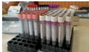
Prüf Röhrchen bereit zu Untersuchung