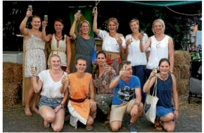
Damenmannschaft TC 76 Heidelheim

Mit durchwachsenen Ergebnissen beendeten die aktiven Mannschaften des TC 76 Heidelheim die Medenrunde 2017. Am erfolgreichsten mit einem Sieg und einem Unentschieden waren die Herren 60, während die Damen, Herren 1 und Herren 2 unterlagen. Dabei tat die Niederlage der Herren 2 besonders weh, hätte doch ein Unentschieden zur Meisterschaft gereicht. Die Sektorkorken knallten dagegen bei den Damen, die abschließende unglückliche Niederlage in Eggenstein hatte keine Auswirkungen mehr auf das Tabellenbild.