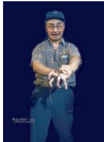
Der verrückte Kioskbesitzer