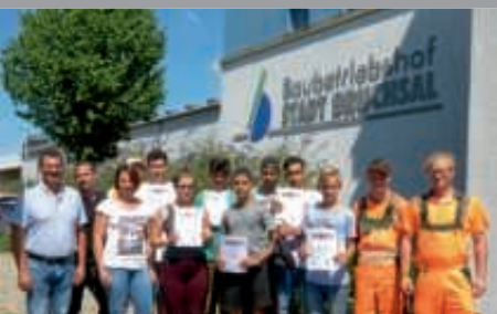
JugendTechnikSchule im Baubetriebshof Bruchsal