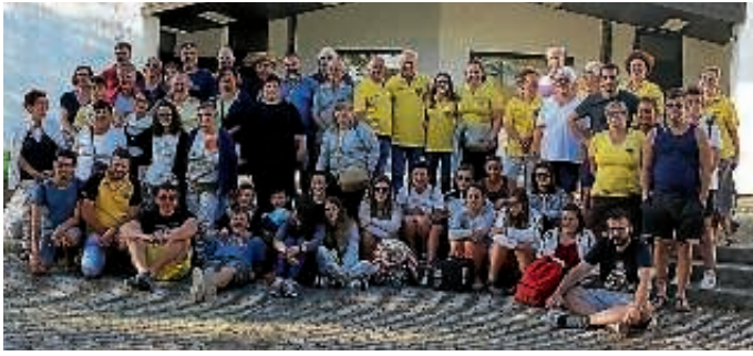
Abschiedsfoto Montag morgens