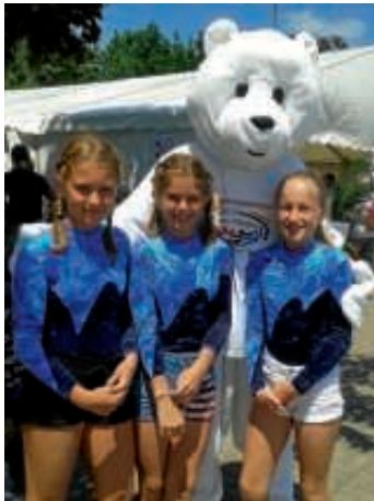
TVH-Turnerinnen mit Maskottchen OLY