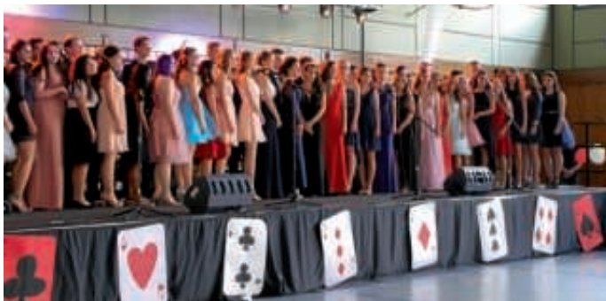
Abschlussklassen 10 Jahrgang 2017