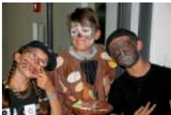
Musicalaufführung in der Johann-Peter Hebelschule