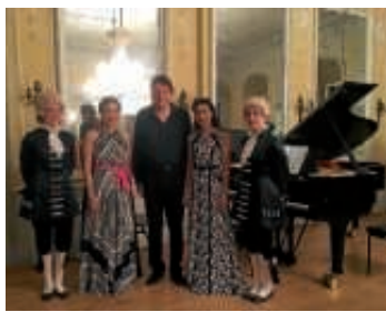
Pagen mit dem Trio con Brio Copenhagen

Rokoko-Page bei den renommierten Bruchsaler Schlosskonzerten im Kammermusiksaal zu sein, ist bei musikinteressierten Jugendlichen sehr begehrt.