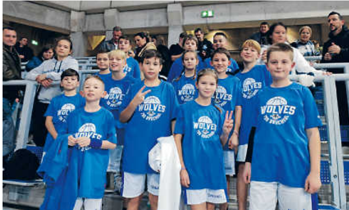
TSG Wolves bei den MLP Academics Heidelberg

Auch wenn die Heidelberger in einem packenden Spiel gegen Ludwigsburg knapp verloren haben, war es ein toller Basketballabend für uns alle!