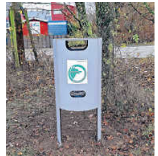
Neue Dogstation