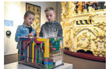
Bunte Drehorgel, Firma Jäger & Brommer, Waldkirch 2009

Kosten: Eintritt 8 Euro, ermäßigt 4 Euro (inklusive Schloss Bruchsal und Stadtmuseum), keine Führungsgebühr Weitere Informationen unter: www.landesmuseum.de/dmm oder Telefon (072 51) 74 26 52 (Dienstag bis Freitag, 9 bis 16 Uhr).