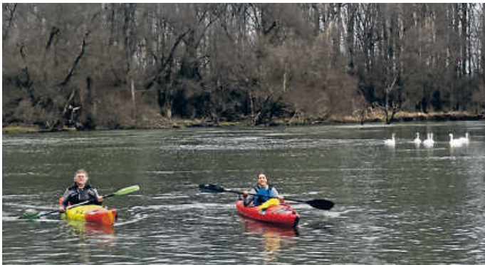
Lingenfelder Altrhein, 10. Dezember – paddeln geht bei fast jedem Wetter

Mit Kajaks und Kleinkanadiern paddeln wir verschiedene Abschnitte auf der Sauer, Prüm und Our. Letztere münden in die Sauer und diese in die Mosel. Untergebracht sind wir für die zehn Tage auf dem Campingplatz Altschmiede in Bollendorf. Dort können auch feste Unterkünfte gebucht werden. In Planung ist auch eine Brauereibesichtigung bei Bitburger. Bei uns dürfen auch gerne Nichtmitglieder an den Ausfahrten teilnehmen. Fordern Sie bitte bei der Geschäftsstelle oder Bernd Schönig (Telefon siehe oben) die Ausschreibung an.