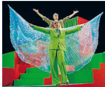
Gespensterjäger auf eisiger Spur

Badische Landesbühne, (072 51) 727 23, karten@badische-landesbuehne.de www.reservix.de