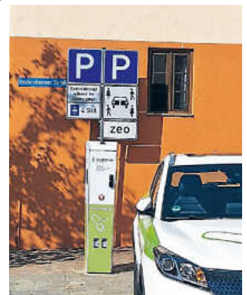
Neue Parkregelung

Die angebrachte Zusatzbeschilderung, die vier Personen und ein durchtrenntes Fahrzeug so-