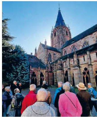
Ein Highlight des Jahres: Ausflug des Heimatvereins nach Wissembourg

Im Oktober ging der Heimatverein auf große Fahrt! Die historische Altstadt von Wissembourg, direkt hinter der pfälzisch-elsässischen Grenze, war das Ziel des Ausflugs. Das Kloster hat das Städtchen geprägt. Heute steht dort die zwischen 1200 und 1300 erbaute, zweitgrößte gotische Kirche des Elsass. Zurück über die Grenze brachte uns der „Weinexpress“, ein Touristenzug mit Ziel Deutsches Weintor, zu einem typisch pfälzischen Mittagessen. Nach dem Mahl brachte uns der Bus nach Landau, wo der Nachmittag zur freien Verfügung stand.