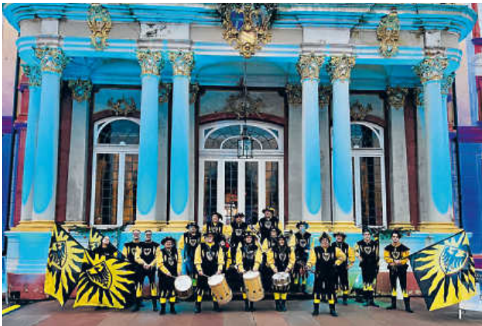
Aufstellung des Fanfarenzugs und den Fahenschwingern vor dem Bruchsaler Schloss

Ein besonderer Dank geht auch an die Veranstalter des Adventsmarkts für die Einladung, in dieser einzigartigen Kulisse auftreten zu dürfen. (NL)