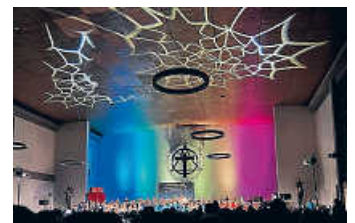
Konzert vom 4. Dezember in St. Paul