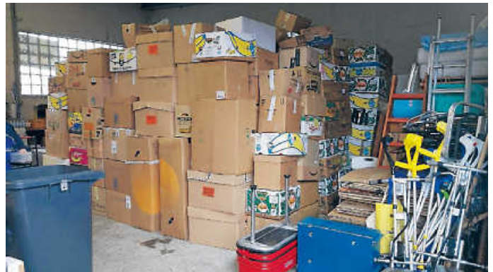
Unsere Sammelhalle und das große Zelt daneben sind voll mit vielen guten Hilfsgütern für Moldawien

Für die hungernden Menschen in Burkina Faso benötigen wir dringend Geldspenden!