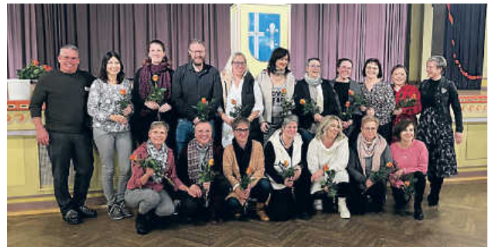
Ehrung der Dienstjubilare in Philippsburg