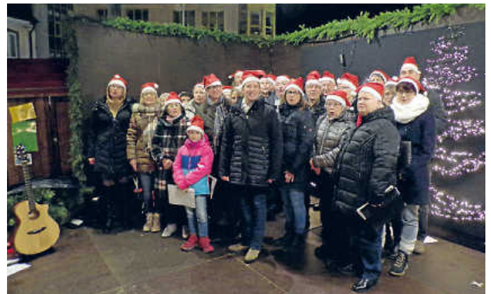
Weihnachtsmarkt – noch vor der Coronazeit