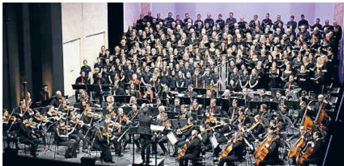
Auf der großen Bühne: der Unterstufenchor des St. Paulusheims mit drei weiteren Chören und dem Sinfonieorchester der DHBW Karlsruhe

Das Konzerthaus Karlsruhe war restlos gefüllt. Nicht nur im Saal, auch auf der Bühne selbst war einiges los. Es waren so viele Musiker/-innen, dass man gar nicht glauben konnte, dass alle Platz finden würden, schließlich bestand der PROMS-Chor aus vier Einzelchören und dazu kam das voll besetzte Sinfonieorchester an der DHBW Karlsruhe. Und mittendrin der Unterstufenchor des St. Paulusheims!