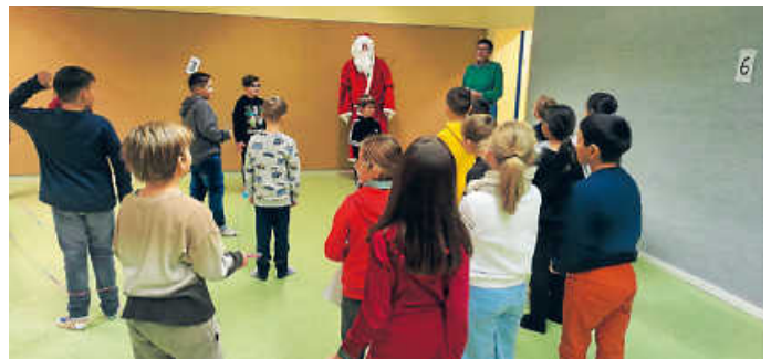
Der Nikolaus im Bewegungsraum

Für unsere Schülerinnen und Schüler begann der Morgen des 6. Dezembers mit einer Überraschung. Da stapfte doch tatsächlich der Nikolaus in unser Schulgebäude und besuchte jede Klasse. Die Kinder staunten nicht schlecht und unterhielten sich gern mit dem willkommenen Adventsgast. Spontan wurden dem Nikolaus dann weihnachtliche Lieder und Gedichte vorgetragen. Zum Dank zauberte der Nikolaus aus seinem Sack für jedes Kind eine Mandarine hervor. Wir freuen uns schon, wenn du uns nächstes Jahr wieder besuchst, lieber Nikolaus! TA