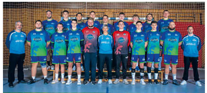
Erste Herrenmannschaft HSG Bruchsal/Untergrombach