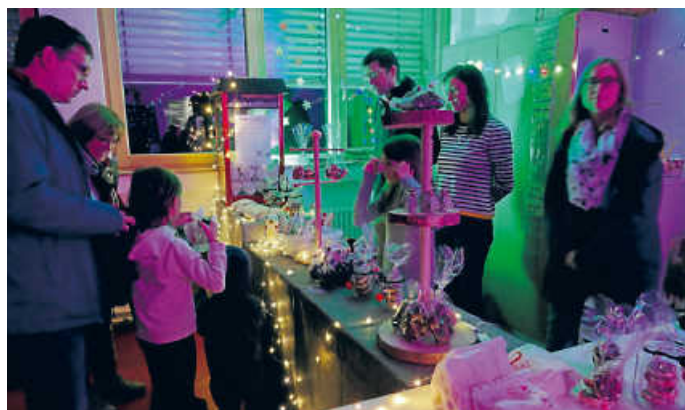
Candybar der Stufe 4