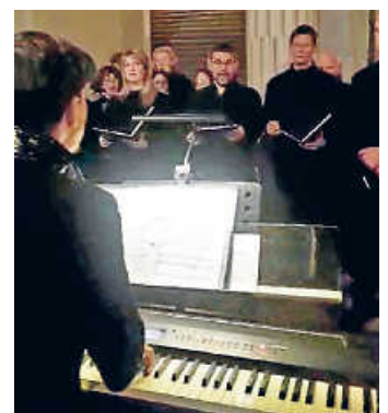
Der Chor genoss den barocken Rahmen und die tolle Akustik im Schloss

Am zweiten Adventswochenende standen zwei Auftritte auf dem adventlichen Programm des Chores, die unterschiedlicher nicht sein konnten. Am Samstagnachmittag „gastierte“ er auf dem heimatlichen Kirchplatz beim Adventssingen der Bürgerwehr. Trotz des strömenden Regens ließ es sich der Chor aber nicht nehmen, den zahlreichen Zuhörerinnen und Zuhörern ein weihnachtliches Programm zu präsentieren. Dem garstigen Wetter war trotz sangen die Sängerinnen und Sänger voller Herzblut, was das Publikum dankbar annahm.