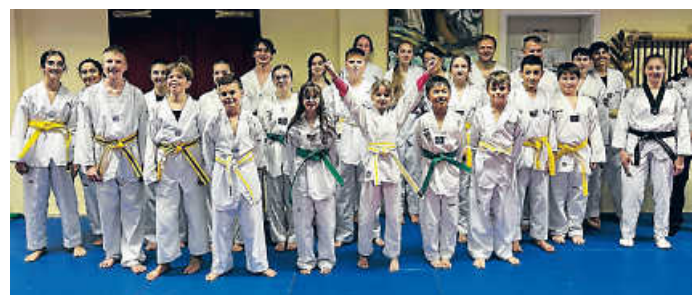
Prüflinge, Trainer und Prüfer

Am Freitag, 8. Dezember, fand für die Abteilung Taekwondo die letzte Gürtelprüfung in diesem Jahr statt.