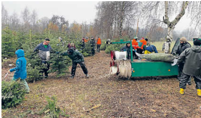
Viele helfende Hände holen die Bäume frisch aus dem Weihnachtsbaumwald und verkaufen sie vor der Lutherkirche

Und am Sonntagabend, 17. Dezember zu „Voices and Brass“, dem traditionellen Weihnachtskonzert mit dem CVJM Posaunenchor ebenfalls in der Lutherkirche, Beginn 18 Uhr. Der Eintritt ist frei. Der CVJM freut sich aber über Spenden für seine Jugendarbeit.