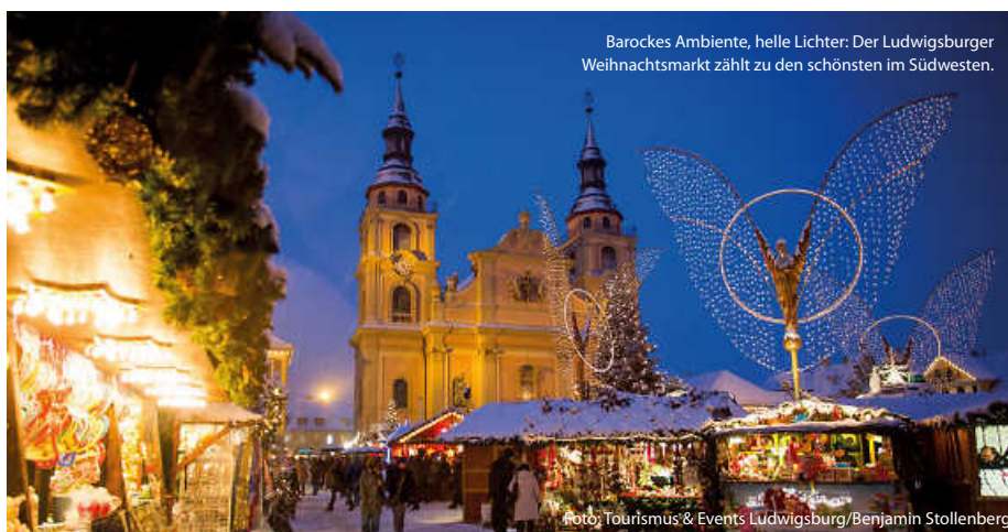
Barockes Ambiente, helle Lichter: Der Ludwigsburger Weihnachtsmarkt zählt zu den schönsten im Südwesten.

Oder kleine, liebevoll inszenierte Adventsmärkte in stimmungsvoller Kulisse, zum Beispiel im Maulbronner Klosterhof zum 2. Advent, oder der Adventsmarkt im Bruchsaler Schlosshof unter der erleuchteten Schlossfassade. Ein Besuch lohnt sich ... (jr/su/red)