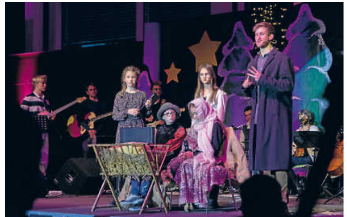
Weihnachten & mehr

Gemeinsam Heiligabend feiern. Mit Musical, Live-Band und einem großen Chor aus Kindern und Jugendlichen laden die Bruchsaler Gemeinden Paul Gerhardt und Luther zu einem tief sinnigen und gleichzeitig erlebnisreichen Gottesdienst in die TSG-Halle ein. Der Gottesdienst möchte Menschen von Jung bis Alt miteinander verbinden und ein gemeinsames Weihnachtserlebnis für ganz Bruchsal und Umgebung ermöglichen.