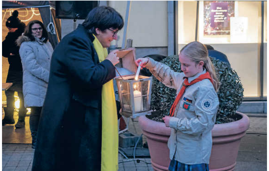
Auch im vergangenen Jahr wurde das Friedenslicht wieder übergeben