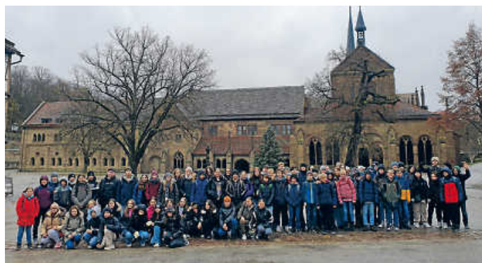
Klassenstufe 7 im Kloster Maulbronn

den strengen Tagesablauf und die strikte Aufgabenverteilung innerhalb des Klosters. Beim Rundgang durch die Klosterkirche erfuhren wir, dass müde Mönche während des Gebets manchmal von ihren (Klapp-)Stühlen rutschten, woraufhin sie dann von ihren Kollegen ermahnt wurden: „Halt die Klappe!“