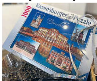
Geschenkideen aus der Touristinformation

Legendäre Klänge, waghalsige Darbietungen und ein außergewöhnliches Show-Event – all das kann man vom 7. bis 9. April 2024 im