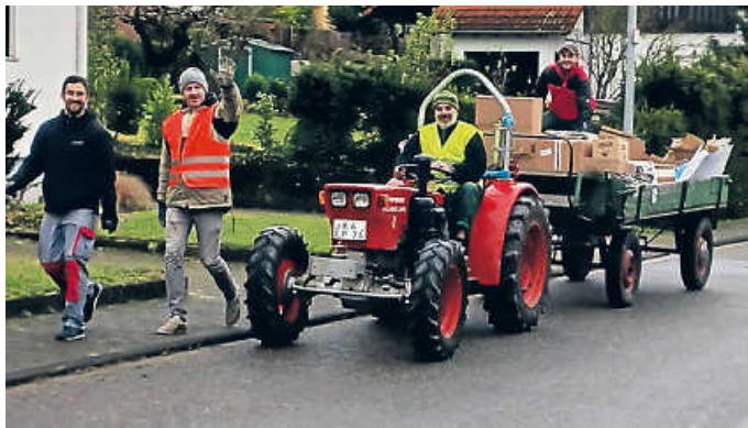
Fleißige Helfer beim Einsatz