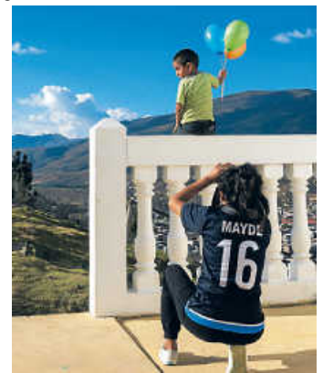
Peruanische Jugendliche lernen, mit der Kamera umzugehen

https://www.facebook.com/weltladen.bruchsal/