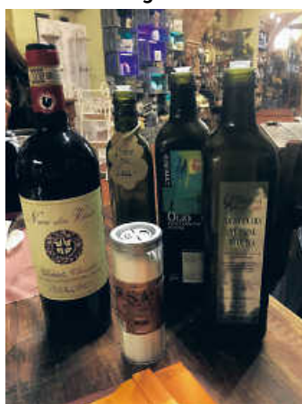
Leckereien aus Volterra zur Verkostung

Am Mittwoch und Donnerstag 27.+28.4. kommt die Cantina di Fabio aus Volterra zu uns nach Bruchsal und wird an den zwei Abenden jeweils um 19:30 Uhr eine Verkostung Toskanischer Weine und Leckereien machen.