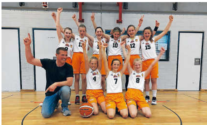
Die glücklichen Finalistinnen

Letztendlich gewannen die Mädchen des Otto-Hahn-Gymnasiums Ludwigsburg nach einem umkämpften Spiel. Verdient nehmen sie nun am Bundesfinale in Berlin teil - dazu herzlichen Glückwunsch! Für die Spielerinnen ist klar: „Nächstes Jahr greifen wir erneut an.“