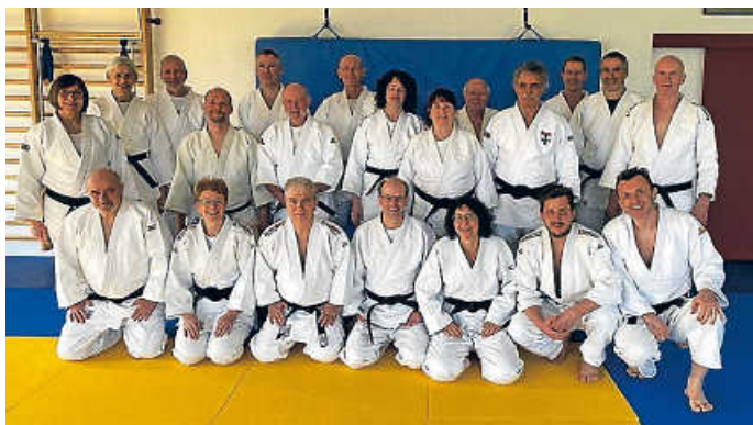
Teilnehmende Kata Workshop