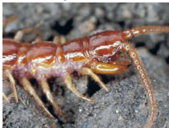
Steinläufer