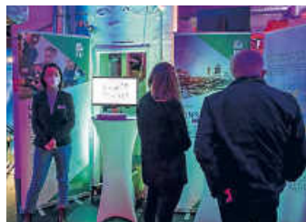
Die Projektpartner entwickelten eine benutzerfreundliche App

Die efeuCampus Bruchsal GmbH informiert regelmäßig über Neuigkeiten aus dem Gesamtprojekt. Sie erfahren etwas über seine Partner, zukünftige Veranstaltungen und was es sonst Neues gibt. Mit dem Projekt haben die Stadt Bruchsal, die efeuCampus Bruchsal GmbH und das Konsortium mit der SEW-Eurodrive, der big. bechtoldgruppe, dem FZI Forschungszentrum Informatik in Karlsruhe, der Hochschule Karlsruhe – University of Applied Sciences (HKA), dem Karlsruher Institut für Technologie (KIT) und der PTV Group eine Idee entwickelt, wie sich Gütermobilität zukünftig im städtischen Raum emissionsfrei, generationengerecht und wirtschaftlich tragfähig gestalten lässt.