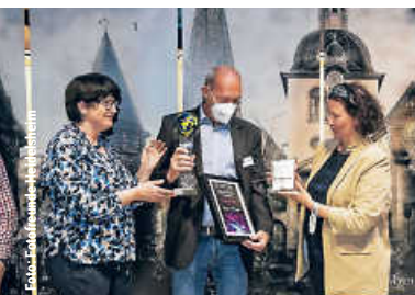
22. Ausstellung Foto- freunde Heidelberg | 2