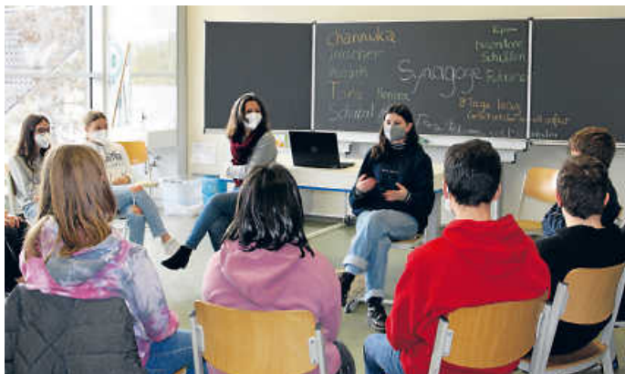
„Meet a Jew“ am HBG