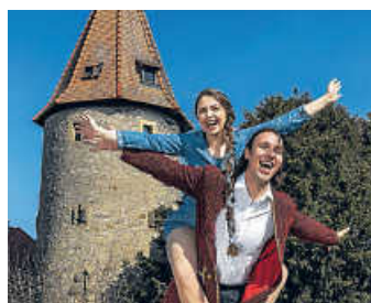
Rapunzel oder Wen die Liebe trifft

Friedrike und Friedrich gehen zu zweit durchs Leben. Sie sind Zwillinge. Gemeinsam schlagen sie das Buch ihrer märchenhaften Familiengeschichte auf und blicken in die Vergangenheit: Ihre Großmutter Grete wünscht sich von Herzen ein Kind. Endlich schwanger, überkommt sie der Heißhunger auf die Rapunzeln aus dem Garten ihrer Nachbarin. Gretes Mann wird beim Diebstahl von der Zauberin Gotel erwischt. Nun hat er den Salat, denn die Zauberin fordert dafür das Neugeborene! Sie liebt das Mäd-