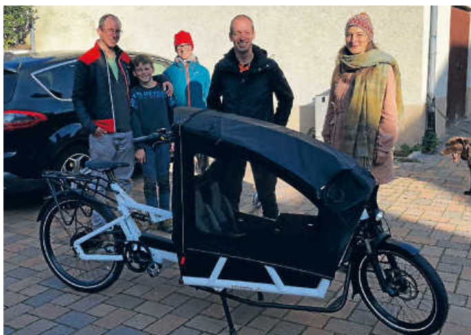
Heildelshemer starten Lastenradangebot