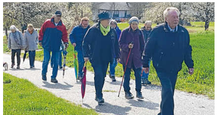
Blütenwanderung des OGV

Am 10. April fand nach zwei Jahren Corona-Pause endlich mal wieder die Blütenwanderung mit dem OGV statt. Mit ca. 25 Personen ist man bei gutem Wetter durch die schöne Blütenlandschaft rund um Obergrombach herum gewandert. Nach einem knapp zweistündigen Rundweg hat man sich noch in der OGV-Halle getroffen und den schönen Nachmittag gemeinsam ausklingen lassen.