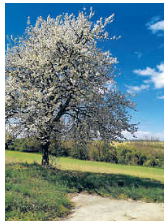
Baum in voller Blüte