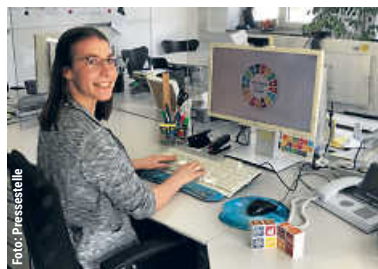
Couragiert und mit Elan für Nachhaltigkeit | 2

Alle wichtigen Infos zur Ukraine unter www.bruchsal.de/ukraine