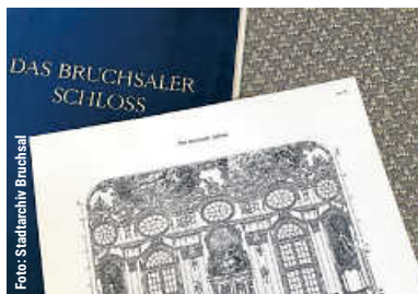
Ausstellung - Schloss im Großformat | 6