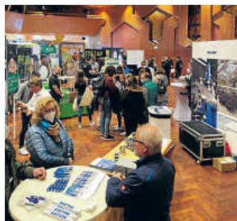
Unternehmen, Jugendliche, Eltern und Schulen nutzten die letzte Regionale Ausbildungsbörse Bruchsal als Vermittlungs- und Kontakt-drehscheibe