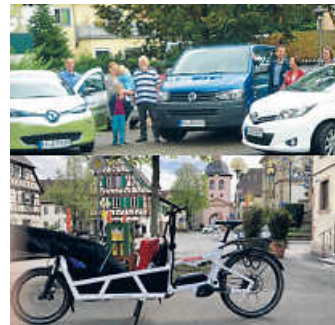
Mobilitätsangebot Heildelshelm

Colectivo! Carsharing gratuliert Lastenkarle zur Eröffnung der Lastenradstation in Bruchsal-Heildelshelm. Hiermit steht den Bürgern der Gemeinde Heildelshelm ein nach unten abgerundetes Portfolio neuer Mobilität aus Bürgerhand zur Verfügung.