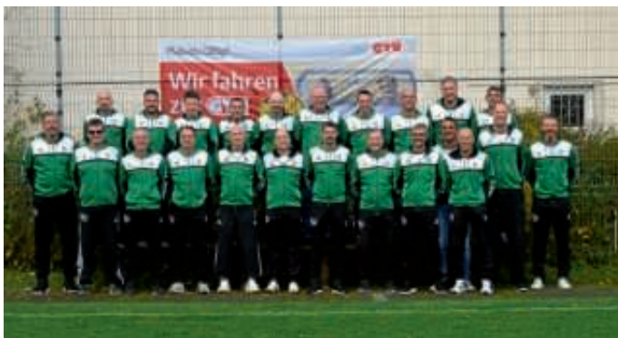
Die AH des SV62 im neuen Outfit