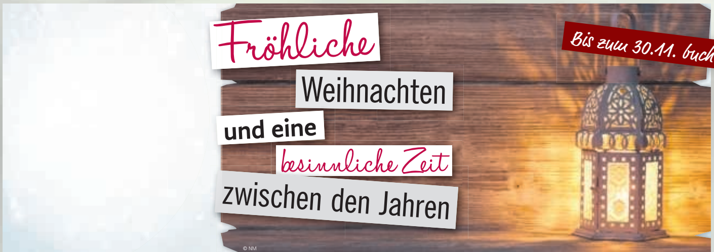
WA17_016: 4-spaltig, 65 mm