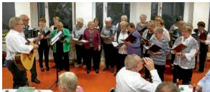
VSG-Stammtisch-Chor bei einem seiner gelungenen Liedbeiträge.