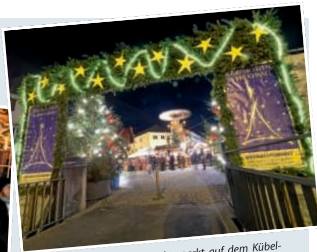
▲ Der Bruchsaler Weihnachtsmarkt auf dem Kübelmarkt hat wieder seinen traditionellen Platz auf dem Kübelmarkt und auf dem Otto-Oppenheimerplatz eingenommen. Er ist bis einschließlich Samstag, den 23. Dezember, täglich von 12 bis 20 Uhr – freitags und samstags sogar bis 21 Uhr – geöffnet.