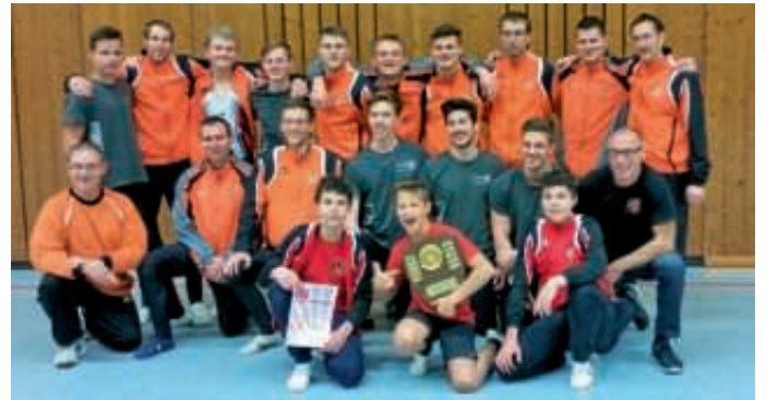
Teilnehmer der GMM