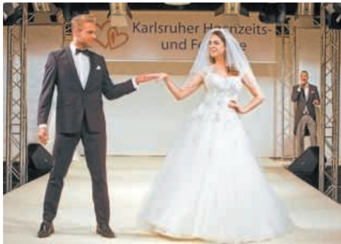
Ob klassisch, außergewöhnlich oder extravagant, für jeden ist das passende Outfit dabei.

se nach wie vor ungebrochen ist, liegt unter anderem am harmonischen Zusammenspiel der hochwertigen Aussteller, dem vielfältigen Rahmenprogramm und den ausgewählten Mitmachangeboten.