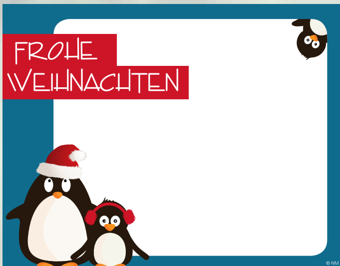
WA17_015: 2-spaltig, 70 mm