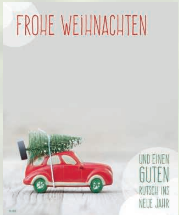
WA17_019: 2-spaltig, 110 mm