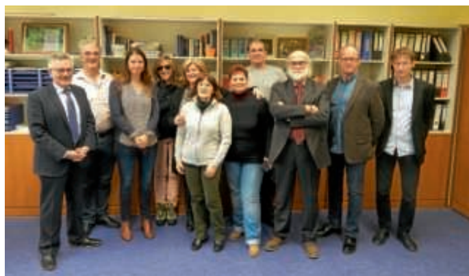
Schulleitungen der teilnehmenden Schulen