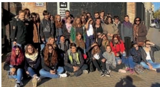
Austauschgruppe in Spanien