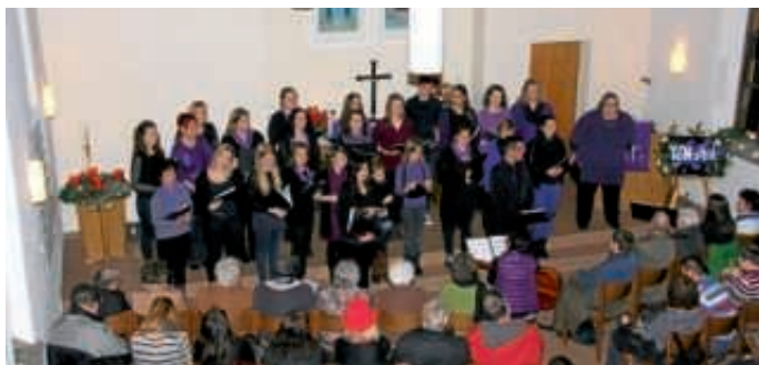
Ton-Art feiert Weihnachten