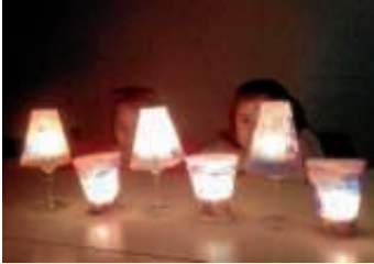
Die Aufräumhelfer

Die dunkle Jahreszeit ist angebrochen und es ist kalt geworden. Hier und da sieht man schon ein bisschen Weihnachtsdekoration.