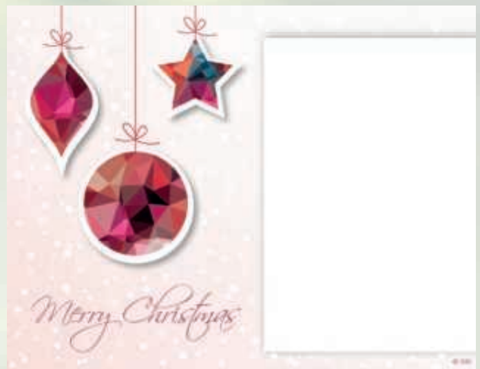
WA17_012: 2-spaltig, 70 mm