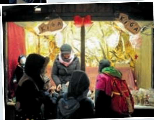
◀ In den „sozialen Hütten“ verkaufen Vereine und Förderkreise Weihnachtliches für einen guten Zweck.