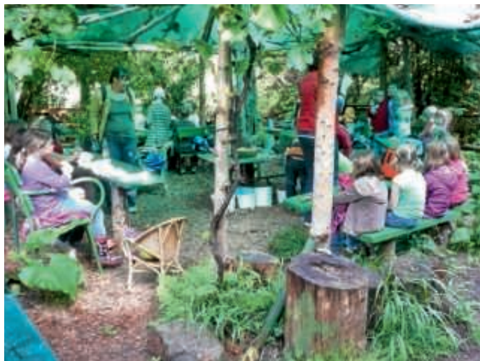
Im Projektgarten erleben Kinder die Natur.

Hierfür bedarf es einer Betreuung und helfenden Händen, im Idealfall von Freiwilligen die Erfahrung mit Kindern haben und sich gern in der Natur aufhalten. Hierbei können auch ältere Jugendliche erste Erfahrungen in der Jugendarbeit sammeln.