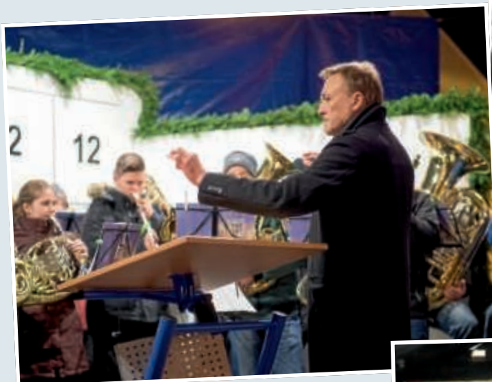
▲ Der Posaunenchor Heidelberg sorgte mit seinem allseits beliebten Auftritt für eine festliche Atmosphäre bei der Eröffnung des Weihnachtsmarktes. Die Kulturabteilung des Rathauses hat ein ansprechendes Programm zusammengestellt, so dass an jedem Abend Auftritte geplant sind.