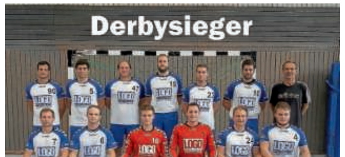
TV Büchenau Sieger im Derby gegen Neuthard