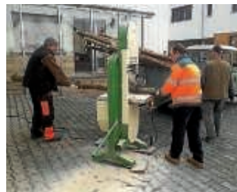
Hier sieht man die Helfer beim Aufsägen der Holzstämmе