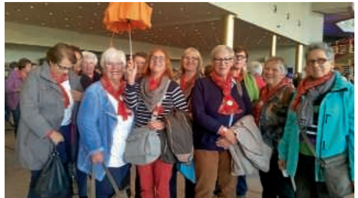
Ausflug der Kfd. nach Rust