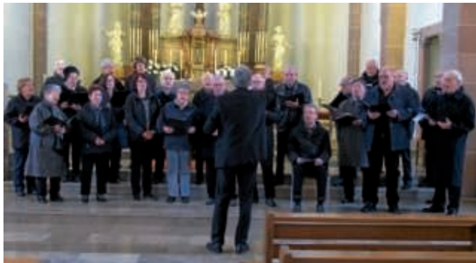
Choraufritt GV 1864