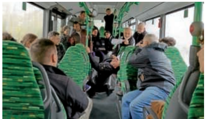
Lehrgang SV mit System III

Themenschwerpunkt: öffentliche Verkehrsmittel