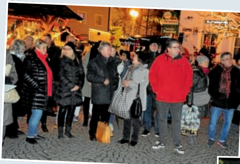
▲ Gäste bei der Eröffnung des Weihnachtsmarktes