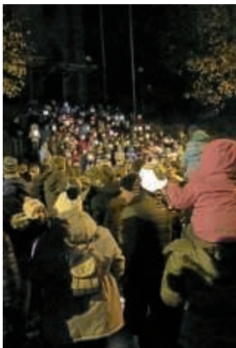
Viele bunte Laternen auf der Kirchentreppe in Obergrombach