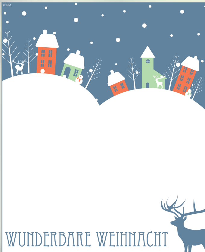
WA17_018: 2-spaltig, 110 mm