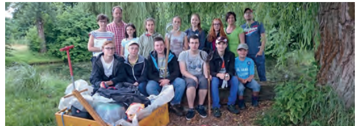
HFH Jugend bei Bosseltturnier