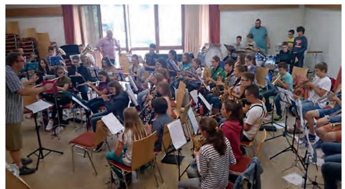
Die erste gemeinsame Probe der Jugendkapellen