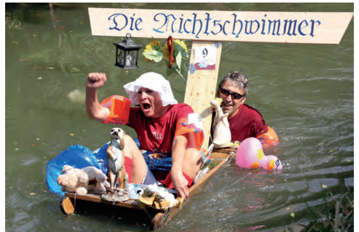
Der Kreativität sind keine Grenzen gesetzt