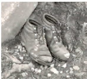
Nicht nur die Schuhe brauchen Pflege ...

Nicht nur die Schuhe und der Haushalt brauchen Pflege – auch die Partnerschaft läuft nicht von alleine so gut wie in der ersten Phase der Verliebtheit. Die Zufriedenheit im Paar ist jedoch eine zentrale Voraussetzung für das Glück in der Familie und die Leistungsfähigkeit im Beruf. An drei „Pflegetagen“ geben wir Anregungen für eine gelingende und glückliche Partnerschaft.