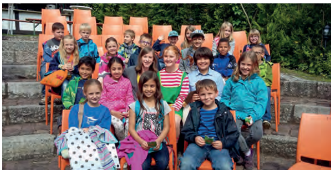
Begeisterte Burgschüler beim Theaterstück Pippi Langstrumpf