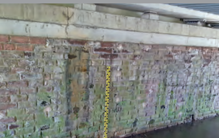
Installation von Pegelmesslatte abgeschlossen