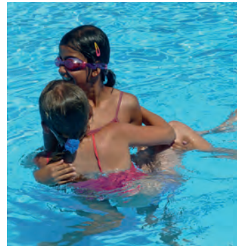
Abkühlung gefunden: Wassenixen im Bad