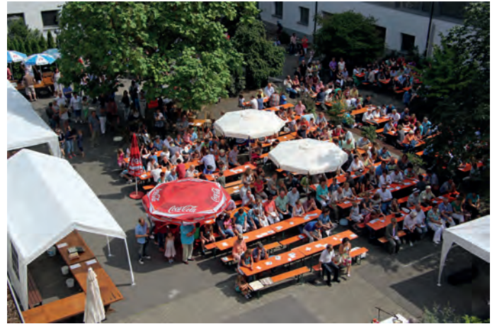
Auch im 101. Jahr des St. Paulusheims Bruchsal wird am letzten Sonntag im Schuljahr das traditionelle Schul- und Hausfest im Innenhof gefeiert

Auch im 101. Jahr des St. Paulusheims Bruchsal findet am letzten Sonntag des Schuljahres, am 24. Juli, wieder das traditionelle Schul- und Hausfest statt. Um 10.30 Uhr beginnt der Festgottesdienst, den die pallottinische Hausgemeinschaft zusammen mit allen Gästen feiern wird. Bei schönem Wetter findet die Messe open-air im Innenhof des St. Paulusheims statt. Im Anschluss an den Gottesdienst gibt es Mittagessen. Bis in den frühen Abend hinein werden verschiedene kulinarische Köstlichkeiten angeboten, außerdem warten die einzelnen Schulklassen des Gymnasiums mit Ausstellungen, Spielen und Projekt-Präsentationen auf. Das Fest mit seinem bunten Unterhaltungsprogramm ist eine Gelegenheit für Ehemalige, sich im St. Paulusheim wieder zu treffen und zusammen zu feiern. Der Erlös ist für den Aufbau einer pallottinischen Schule in Yaoundé/Kamerun bestimmt, hierzu hat sich eigens eine Projektgruppe aus der Schülerschaft gebildet, die verschiedene Angebote und Informationen bereit halten wird. Um 15.30 Uhr trifft sich der Freundeskreis St. Paulusheim zu seiner Jahreshauptversammlung mit Neuwahlen.