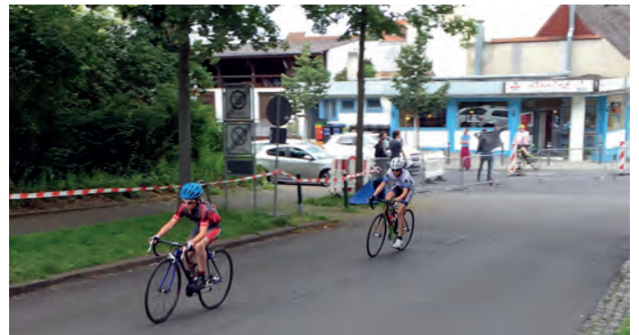
Links i. Bild H. Oechsler