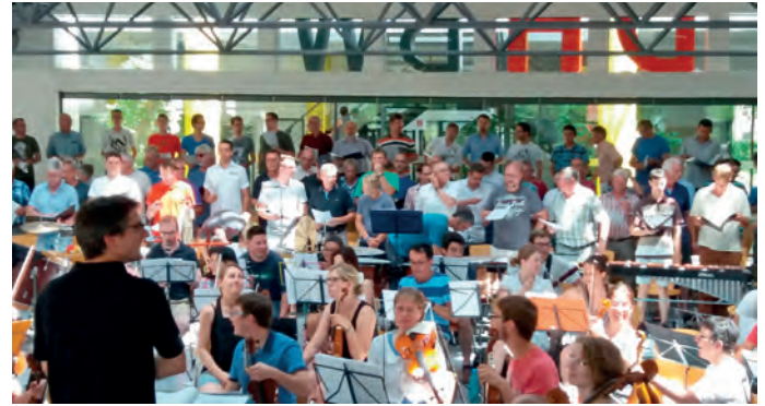
Probe mit Orchester

Wir freuen uns auf das bereits ausverkaufte Konzert am Samstag in Karlsruhe, in dem wohl akustisch besten Konzerthaus der ganzen Region. B.K.