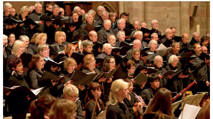
Auftritt in Wissembourg