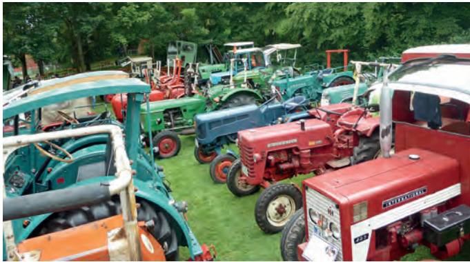
Bulldogtreffen in Helmsheim