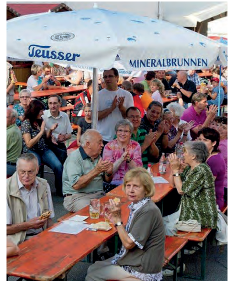
Die Interessengemeinschaft freut sich auf Besucher aus nah und fern beim 18. Kelterfest in Helmsheim.

11.30 Uhr: Handwerkermittagstisch ab 14.30 Uhr: Seniorennachmittag mit Unterhaltung 20 Uhr: Musikverein Helmsheim im Anschluss Ziehung der Tombola