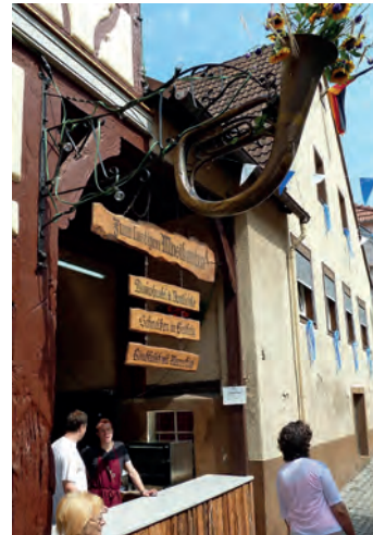
Auch dieses Jahr wieder begrüßt der MVO seine Gäste im Hof zum lustigen Musikanten

Der Musikverein „Eintracht“ Obergrombach lädt die gesamte Bevölkerung recht herzlich zum traditionellen und weit über die Grenzen der Region hinaus bekannten Burgfest 2016 im Obergrombacher „Städtl“ ein. Vom 23.-25. Juli ziehen die Obergrombacher Vereine wieder in die Höfe der Anwohner des historischen „Städtl“ ein und bieten dort den Festbesuchern eine große Auswahl an Speisen und Getränken an. Der MVO hat dieses Jahr unter anderem Rindfleisch mit Meerrettich, Kartoffel-taschen mit Frischkäsefüllung oder Dampfnudel auf der Speisekarte. Außerdem bieten wir wieder Langos in vielen Variationen an und beim Pilsstand und der Bar bekommen Sie die passenden Drinks zu einem gemütlichen Sommerabend.