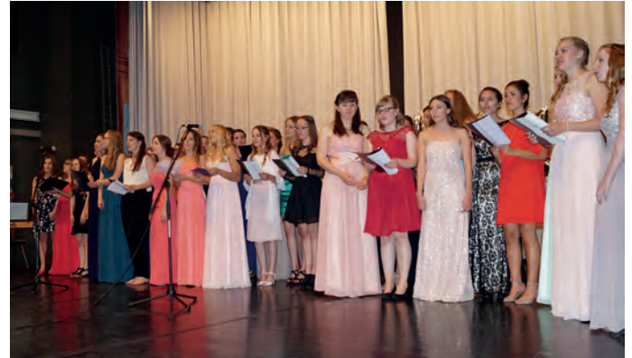
Der Chor der Abiturientinnen und Abiturienten