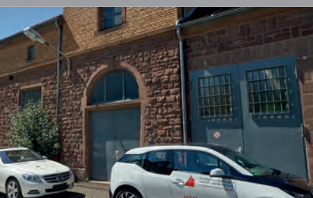
Testfeld automatisiertes Fahren in der Region Karlsruhe