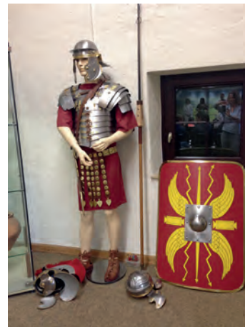
Rüstung der Soldaten