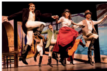
Der Graf von Monte Christo