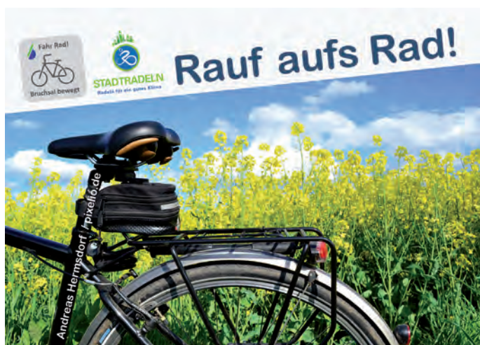
Stadtradel-Tour am 16. Juli 2016

Die nächste „Rauf auf's Rad“-Tour findet am Samstag, 20. August 2016 statt. Nähere Auskünfte erteilt das Agenda-Büro. Anmeldungen sind nicht erforderlich. Infos: Agenda-Büro, Telefon: (07251) 79-373 oder agendabuero@bruchsal.de.