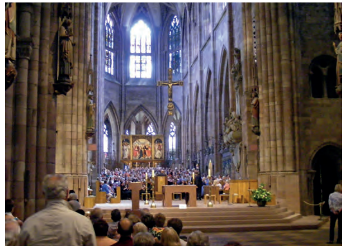
Singen im Freiburger Münster