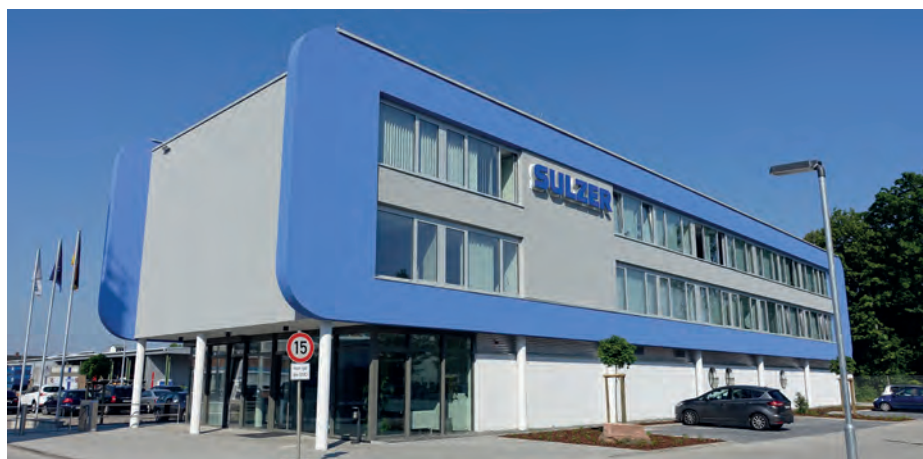
Neues Verwaltungsgebäude von Sulzer Pumpen auf seinem Werksgelände in Bruchsal

gungsverfahren zum Neubau. Zwischen Bauantrag und Fertigstellung des Gebäudes sind nur etwas mehr als ein Jahr vergangen.