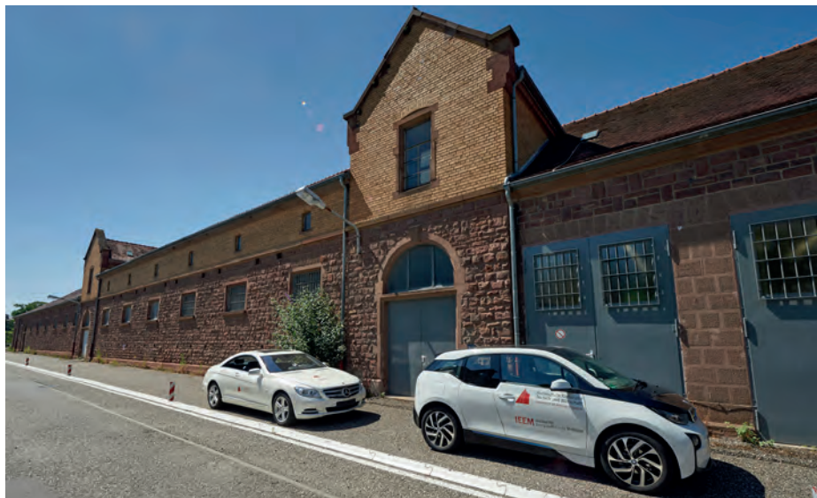
Das Testfeld bietet Firmen und Forschungseinrichtungen die Möglichkeit, zukunftsorientierte Technologien und Dienstleistungen rund um das vernetzte und automatisierte Fahren im alltäglichen Straßenverkehr zu erproben.

können Firmen und Forschungseinrichtungen zukunftsorientierte Technologien und Dienstleistungen rund um das vernetzte und automatisierte Fahren im alltäglichen Straßenverkehr erproben. Karlsruhe und Bruchsal sowie die beteiligten Partner haben die notwendigen Eigenmittel für das auf insgesamt 4,2 Millionen Euro veranschlagte Projekt bereits freigegeben. Die Stadt Bruchsal ist dabei mit einem Anteil von 50.000 Euro beteiligt. 38.000 Euro entfallen auf den Eigenanteil im Konsortium. Darüber hinaus werden 12.000 Euro für die Vermessung der Strecke aufgewendet. Das Land bezuschusst das Projekt mit zusätzlich 2,5 Millionen Euro. Auf dem Forschungscampus hat das Institut für Energieeffiziente Mobilität der Hochschule Karlsruhe (IEEM)