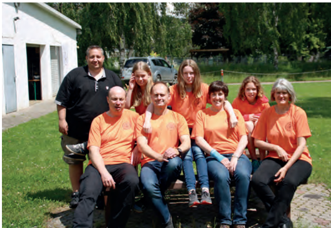
Der 1. TSC Bathyscaphe stellt sich vor

Am kommenden Sonntag, dem 17. Juli findet anlässlich des vierzigjährigen Jubiläums der Stadtwerke das Freibadfest im SaSch statt, bei welchem wir als Verein vertreten sein werden. Geplant sind neben der Präsentation der Leistungssportart Finswimming auch Mitmach-Aktionen zum Apnoe- und Gerätetauchen. Wer also das Flossenschwimmen bzw. Tauchen mal ausprobieren möchte, kommt einfach vorbei. Das Programm -inklusive Zeitplan- ist vor Ort erhältlich. Wir würden uns freuen. Infos unter: www.bathyscaphe.de