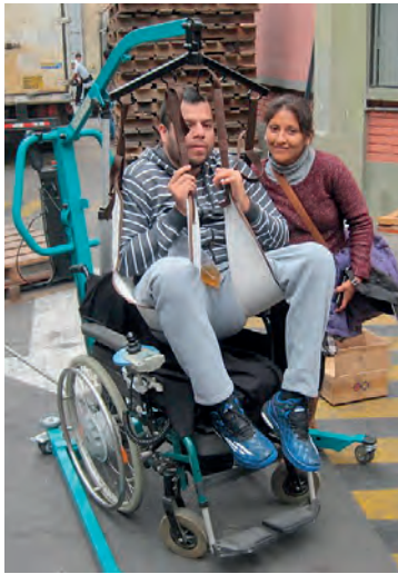
Peru: Krankenlifter und Rollstuhl helfen behindertem Mann und seiner Frau!