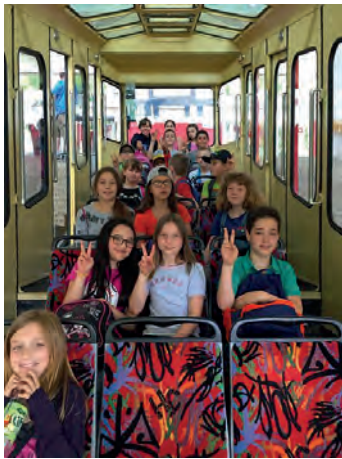
Talfahrt mit der Zahnradbahn

Am Dienstag, den, 28.06.2016 unternahm unsere Klasse einen Ausflug auf den Turmberg in Karlsruhe-Durlach.