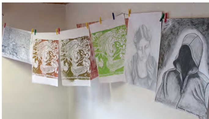
Im Linoldruckverfahren hergestellte und von Hand gezeichnete Bilder

Bei der Ausstellung „Praktische EigenART“ der Kreativgruppe des Ehrenamtsnetzwerks „Praktisches Miteinander e.V.“ wurden zahlreiche von Bewohnern der Gemeinschaftsunterkunft Heidelberg angefertigte Zeichnungen sowie im Linoldruckverfahren hergestellte Bilder gezeigt. Außerdem ermöglichten die ausgestellte Druckmaschine sowie Nähmaschinen und Arbeiten aus der Nähgruppe des Vereins einen Einblick in die praktische kreative Arbeit mit den Geflüchteten