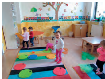
Farbkleckse Bruchsal

Morgens früh um 8.00 Wird begrüßt und viel gelacht. Morgens früh um 9.00 Das Frühstück, ein Grund zum freun`. Endlich dann um 10.00 Gibt's im Garten, viel zu sehn. Gespielt wird dann bis 11.00 Getanzt, gelacht bis 12.00 Aufgeräumt, gegessen und gepackt, um 13 Uhr auf den Heimweg dann gemacht. Bei Interesse kommt vorbei, wir, die Farbkleckse, haben noch Plätze frei. Text: Olga Kempf