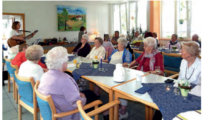
Singnachmittag im AWO-Haus Silbertal

Das Team und die Bewohner freuen sich jetzt schon auf viele Besucher.