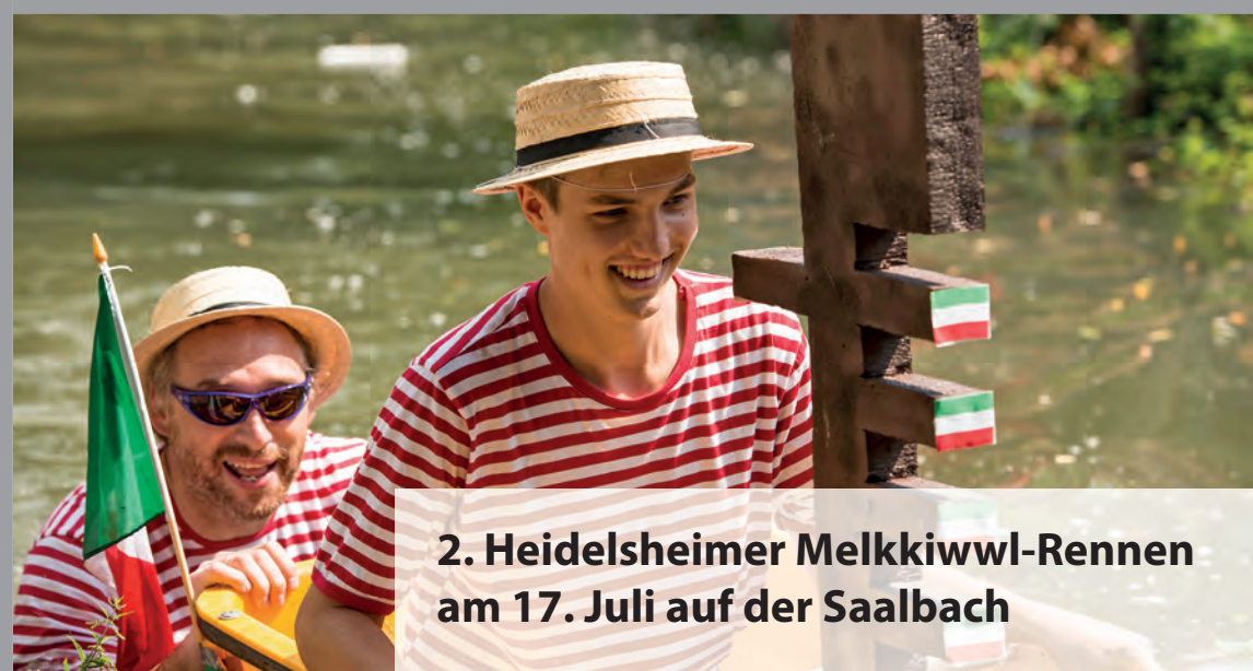
2. Heidelheimer Melkkiwwl-Rennen am 17. Juli auf der Saalbach