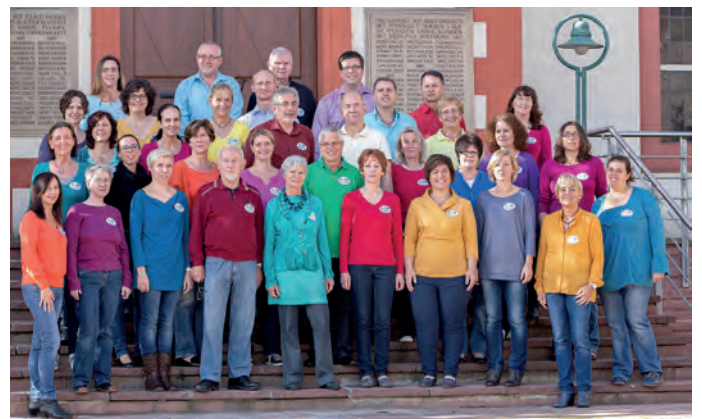
Der Rainbow Gospelchor freut sich am 17. Juli auf zahlreiche Konzertbesucher