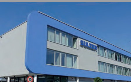
Sulzer treibt Standortausbau Bruchsal voran