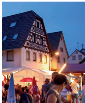
Kelterfest 2014