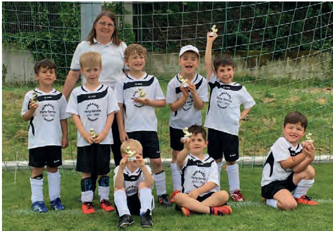
Stolz präsentieren unsere Minikicker ihren Pokal