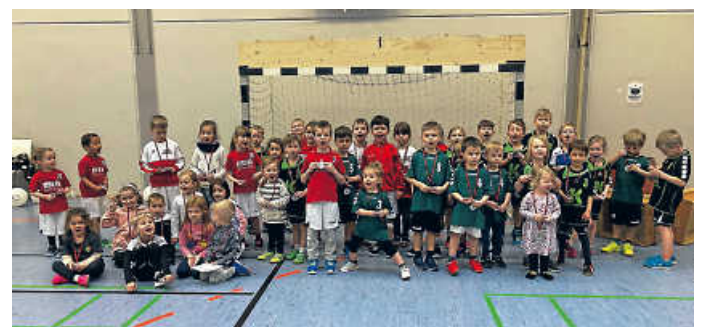
Die erfolgreichen Minis!

Weitere Fotos unter www.die-sghh.de (TM)