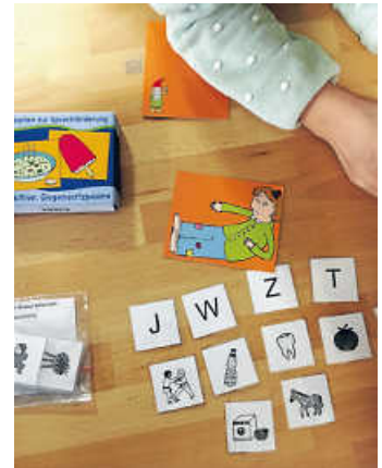
Kreative und einprägsame Förderung durch die Lernassistenten beim Erlernen der deutschen Sprache

Mit einem erheblichen Betrag unterstützt die BürgerStiftung Jahr für Jahr den Einsatz von Lernassistenten an der Konrad-Adenauer-Schule. Bei erkennbaren Lücken oder Sprachschwierigkeiten helfen Lernassistenten durch gezielte Einzelförderung. Kreative Wortspiele und Wiederholungen in Kleingruppen helfen, Defizite auszugleichen. In der Folge können die Kinder dem allgemeinen Unterricht besser folgen. Die Lernerfolge ermutigen die Kinder und stärken ihr Selbstvertrauen. Eine Positivspirale entsteht. Bei älteren Kindern helfen die Lernassistenten zum Beispiel im Fach Mathematik, indem sie Rechenvorgänge und Lösungswege eingehend erklären und üben – bis „es sitzt“.