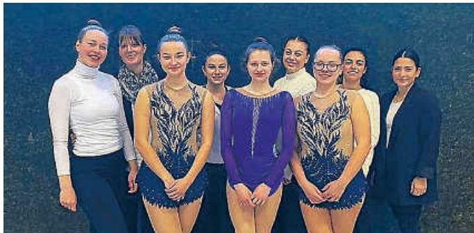
Unsere Gymnastinnen und Kampfrichterinnen