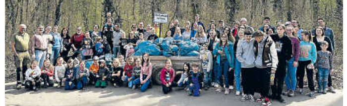
Waldputztag am Baggersee

Uferbereich des Untergrombacher Baggersees wieder aufatmen. Darüber hinaus wurden auch die Erfahrungen und Lernziele gefestigt, dass Umweltschutz im Kleinen und schon bei den GrundschülerInnen anfängt und dass praktisches Handeln einen spürbaren Beitrag für eine sauberere Umwelt leisten kann. Überrascht davon, was man in der Natur so alles findet, aber auch zufrieden mit dem überzeugenden Ergebnis der Waldputzete verließen die Schülerinnen und Schüler mit stolzen Eltern, Lehrkräften und Rotariern ihren Sammelplatz. Wer die Natur und Schöpfung schützen und unsere Umwelt schonen will, der muss auch etwas dafür tun. jobei