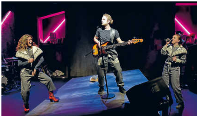
Loving the Alien

Die Aliens sind zurück! Im April zeigt die Badische Landesbühne nochmals einige Vorstellungen des gefeierten David-Bowie-Abends. Am 14./15. sowie am 28. und 29. April können Sie „Loving the Alien“ jeweils um 19.30 Uhr im Hexagon erleben.