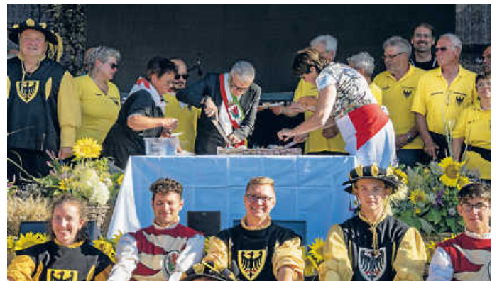
Nach der Unterschrift anlässlich der 1250-Jahrfeier wurde Kuchen von den Stadtoberhäuptern verteilt

Liebe Heildelheimer Freunde von Volterra, vergangenen Sommer waren unsere Voltterriner Freunde zu unserem Jubiläumsfest 1250 Jahre hier in Heildelshelm, um aus dem Freundschaftsvertrag einen echten Partnerschaftsvertrag zu machen. Jetzt haben wir eine Rückeinladung von Volterra für den 4. bis 7. Mai erhalten.