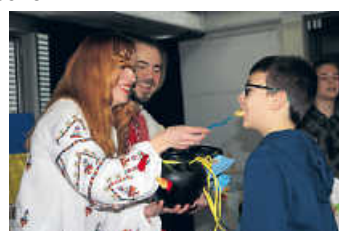
Kulinarisches aus der Ukraine