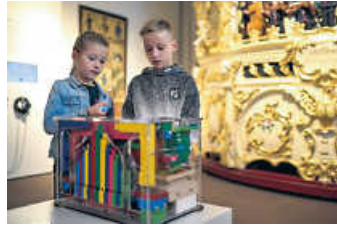
Drehorgel, Firma Jäger und Brommer, Waldkirch 2009

Tel: 072 51 74 26 52 (Di - Fr 9 bis 16 Uhr)