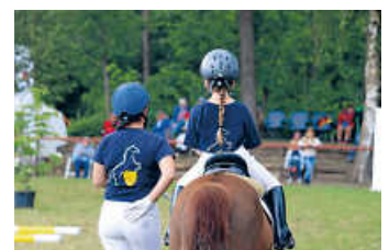
Beim Reiterstag am 7. Mai finden Wettbewerbe für alle Altersklassen statt.

Direkt darauf folgt unser Reiterstag für alle Altersklassen am Sonntag, den 7. Mai. Am besten direkt beide Termine vormerken. Wir freuen uns auf Ihren Besuch.