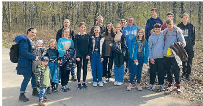
Frühjahrsputz der 8b