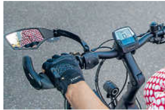
Cockpit eines Pedelec

Wichtig ist dabei, die eventuell ungewohnte Technik wie Schaltung, Bremsen und Fahrtechnik sicher zu beherrschen. Unsere kostenlosen Trainings tragen wesentlich dazu bei, dass die Teilnehmer am Ende besser mit der Technik vertraut werden und sich sicherer im Verkehr bewegen. Das Training gliedert sich in einen Theorie- und Praxisteil. Die Resonanz aller bisherigen Kurse war durchweg positiv. Unterstützt werden die Kurse durch die Sparkasse Kraichgau, AOK Mittlerer Oberrhein und der Badische Radsportverband. Reifen Burkhardt stellt uns freundlicherweise einen Seminarraum und das große Freigelände zur Verfügung. Hier wird extra ein Parcours aufgebaut, auf dem verschiedene Fahrsituationen geübt werden können. Gefahren wird mit dem eigenen Pedelec. Für Teilnehmer, die noch kein Pedelec besitzen, stehen Leihfahrräder bereit.