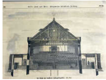
Zuchthaus Bruchsal, Querschnitt