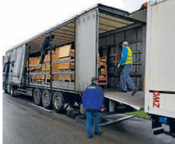
Unser Team beim Umladen der Betten vom 7,5-Tonner in den Lastzug

www.konvoi-der-hoffnung.de/Wunschliste oder am Telefon.