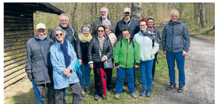
Kleine Pause bei Wind und Sonne am Aschberg

Bei Aprilwetter mit starkem Wind, Sonnenschein und Wolken machten sich 14 Wanderer auf eine Tour rund um Heildesheim zu laufen. Diese Tour wird auch zu unserem Jubiläumstag am 30. April gelaufen werden. Von der Sporthalle ging es über den Sennig am Schützenhaus vorbei nach Helmsheim. Dort bis zum Bahnhof und wieder Richtung Heildesheim, aber dann hoch zum Aschberg. Ein Motivationswanderschnäpsle ließ uns beschwingt weiter zur Laubigen Eiche laufen. Dort aus dem Wald raus und hoch zu den Obstanlagen, die L618 gequert und über den Waldspielplatz bis zur OWK-Hütte gewandert. Den Abschluss bei gutem Essen machten wir im FC-Clubhaus. Die zwölf Kilometer waren in gut 2 ¼ Stunden gelaufen.