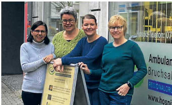
Das Hauptamtlichen-Team der Ambulanten Hospizgruppe freut sich auf Verstärkung

Haben wir Ihr Interesse geweckt? Auf unserer Homepage finden Sie die Kontaktdaten und nähere Informationen: www.hospizgruppe.de/kordinatorin-m-w-d-gesucht/