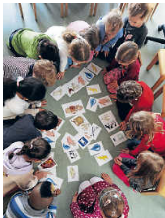
Foodsharing zu Gast im Kindergarten Obergrombach

Auf Initiative des Elternbeirats kam in der vergangenen Woche die Initiative Foodsharing zu uns. Gemeinsam mit den Kindern wurde über das Thema Lebensmittelherstellung und der Weg bis zu uns in den Kühlschrank gesprochen. Was bedeutet das Verfallsdatum und wie ist ein guter Umgang mit Lebensmitteln, wie können wir verhindern, dass Lebensmittel verschwendet werden. Zusammen haben wir den Fairteilerschrank auf dem Kindergartenengelände besucht und geschaut, was darin zu finden ist. Besonders lecker, was wir zusammen zubereitet haben. Wir haben viel gelernt. Vielen Dank an die Initiative für diesen Besuch und lehrreiche Stunden.