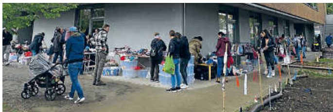
Kindersachen-Flohmarkt rund um die Kita Merlin

Organisiert wird der Flohmarkt vom Elternbeirat und Eltern der Kita Merlin mit Schulkindergarten. Informationen über die Kita Merlin unter www.reha-suedwest.de/kita-merlin .