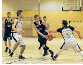
Herren 1 - noch ein Sieg fehlt zur Meisterschaft

Entsprechend heiß sind die Jungs schon jetzt und freuen sich über eure Unterstützung am kommenden Samstag in der Bahnstadtsporthalle. Um 20 Uhr geht's los, der Eintritt ist natürlich frei. Gespielt wird gegen die BG Karlsbad, den aktuell Drittplatzierten. Das Hinspiel vor Weihnachten endete mit einem knappen 5-Punkte-Sieg. Dabei sah Bruchsal lange wie der verdiente Sieger aus, am Ende wurde es aber noch einmal richtig knapp.