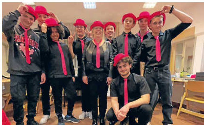
SBG - Combo „Pink Bowlers“