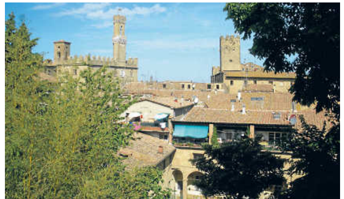
Blick von oben auf unsere Partnerstadt

Für diese Fahrt organisiert die Stadt Bruchsal einen Reisebus; für drei Übernachtungen muss man mit 150 bis 200 Euro pro Person rechnen. An zwei oder drei Abenden werden wir von den Volterrani zu gemeinsamen Abendessen eingeladen.