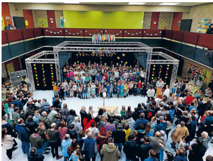
Frühlingsmarkt an der Hebelschule