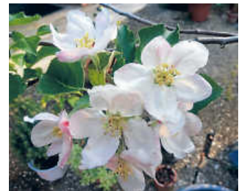
Blüten eines jungen Nashi-Baumes

Nach der langen Winterzeit fühlen sich viele Menschen im März und April schlapp und antriebslos. Die Frühjahrsmüdigkeit macht sich bei vielen bemerkbar. Dagegen kann man einiges tun: sich in der freien Natur viel bewegen. Die Sonne, die immer wieder zwischen den Wolken nach längeren Regenschauern hervorkommt, motiviert, sich längere Zeit draußen aufzuhalten. Mit viel frischem Grün und vielfältiger Blütenpracht sowie Vogelgezwitscher hat der Frühling nun Einzug gehalten.