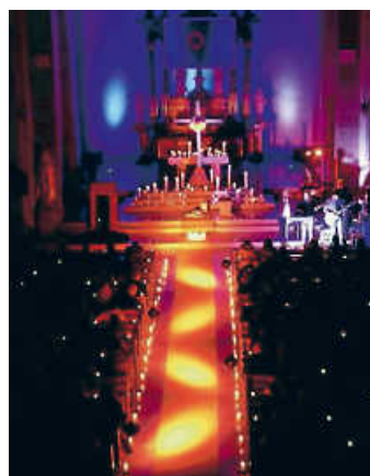
Liturgische Nacht

Im Anschluss an den Gottesdienst wird auf dem Kirchenvorplatz das Brot geteilt.