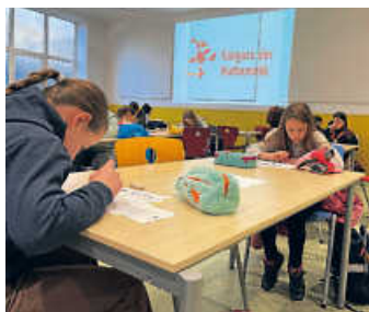
Cool und knifflig!

Am 16. März wurde in der Stirumschule besonders viel gerechnet und geknobelt. Mit Begeisterung nahmen 96 Dritt- und Viertklässler/-innen am Mathematik Känguru-Wettbewerb teil, bei dem vor allem die Freude und die Lust an mathematischen Aufgaben im Fokus stehen. Die Kinder der dritten Klassen starteten um 7.45 Uhr und knobelten für 75 Minuten in der Schul-Mensa. Kurz danach war der Raum bis 10.30 Uhr prall gefüllt mit den mathematischen Gedanken der Viertklässler/-innen.