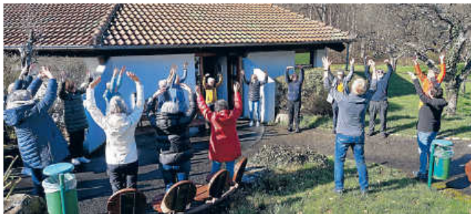
... erstes Aufwärmen im Hohenwart Forum