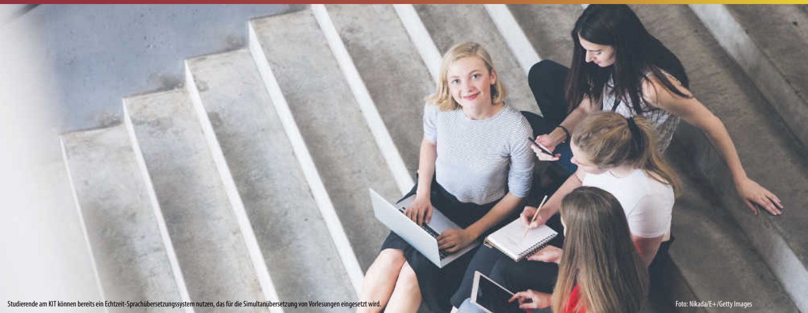
Studierende am KIT können bereits ein Echtzeit-Sprachübersetzungssystem nutzen, das für die Simultanübersetzung von Vorlesungen eingesetzt wird.