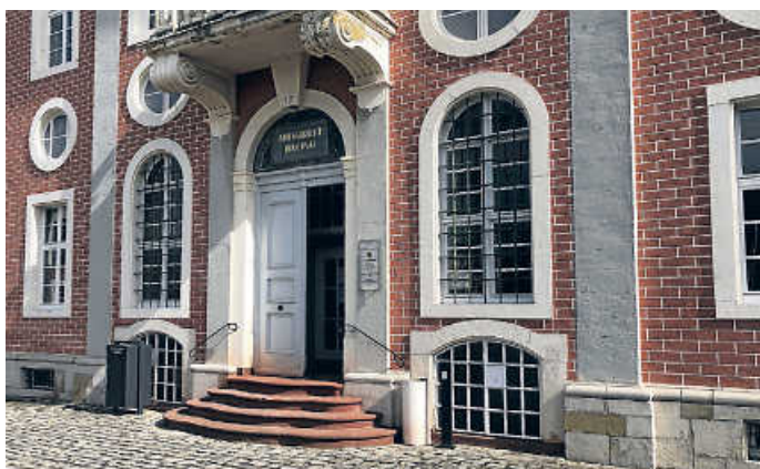
Eingang Amtsgericht gegenüber des Bruchsaler Schlosses in der Schönbornstraße

An diesem Donnerstag findet kein Internationales Frauencafé im Haus der Begegnung statt!