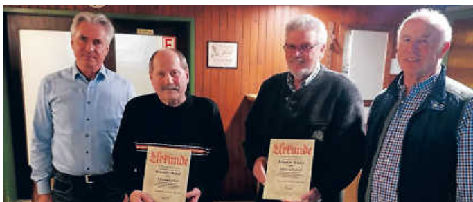
In der Bildmitte die neuen Ehrenmitglieder