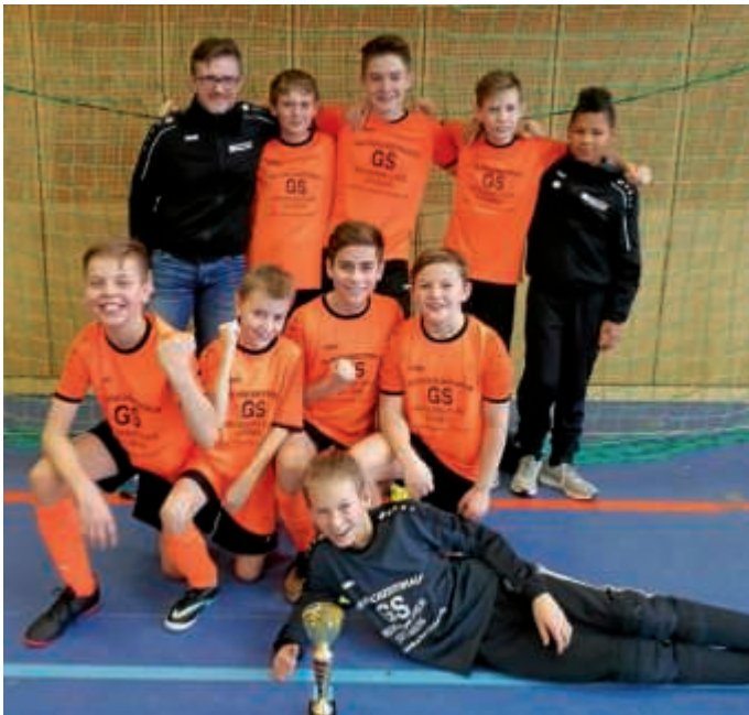
F-Jugend 3. Platz in Flehingen

Nach einem dramatischen Spiel um Platz 3, das mit 4:3 gewonnen werden konnte, belegt unsere F-Jugend Platz 3. Nach einer souveränen 2:0 Führung in den ersten drei Minuten gingen die Jungs zu sehr in die Defensive und lagen kurz vor Schluss mit 2:3 zurück. Ein langer Frust-Schuss über den Torwart: 3:3.... kurz vor dem Ende. In der letzten Minute dann ein echt schöner Lupfer und Obergrombach ging verdient als Sieger vom Platz. Die nötige schnelle Spielweise und das harte kämpferische Spiel an der Bande hat heute keine Mannschaft so schnell angenommen wie unsere F1. Im Halbfinale war unser Chefcoach gelegentlich lauter als der Hallensprecher und auch den Eltern hat man die Spannung angemerkt. Es waren durchweg tolle Kombinationen, schöne Tore und ein ganz, ganz toller Teamgeist, die heute zum Erfolg geführt haben. Nach dem letzten Spiel hat man dann auch gemerkt, wie ausgepowert die Jungs waren. Jeder Sieg war hochverdient und wenn man als 3. von 20 vom Platz geht hat man fast alles richtig gemacht. Die Location war etwas besonderes aber stark überlaufen - auch dies eine besondere Belastung für die Jungs, die sich in den Pausen auch neugierig alle Gegner angeschaut haben. Letztendlich ein toller Nachmittag und Trainer und Mannschaft können zu Recht stolz auf sich sein