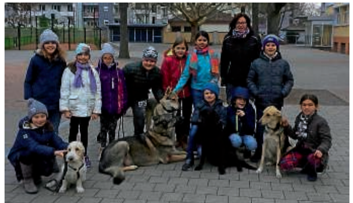
Hunde AG an der Stirumschule