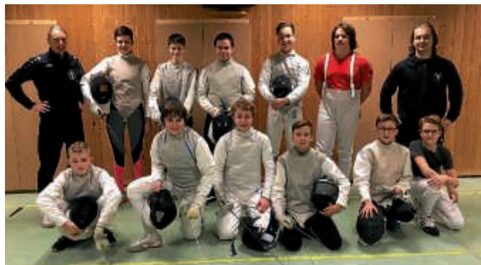
Fechter im Turnier Outfit