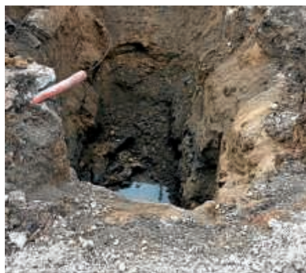
In diesem Erdloch befand sich die Bombe.