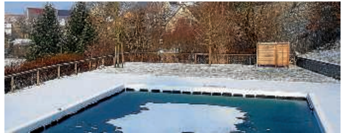
Die Arbeit für das noch verschneite Bad trägt Früchte