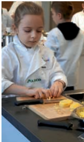
Miniköchin konzentriert bei der Arbeit

Am Freitag, 8. Februar, treffen sich die Minigärtner beim Raiffeisenmarkt in der Industriestraße 100, Bruchsal, von 15 bis 17 Uhr. Gerne können sich noch weitere Interessierte zwischen 9 und 11 Jahren anmelden. Infos unter www.minigaertner.de