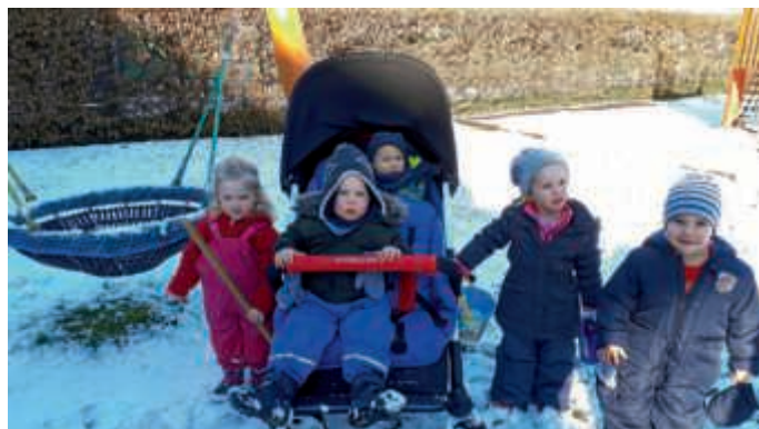
Der Buggy im Einsatz

Ein Dank der AWO Zwergenstube geht an alle Spenderinnen und Spender, die Eltern der Zwergenstubenkinder und die Volksbank Bruchsal-Bretten.