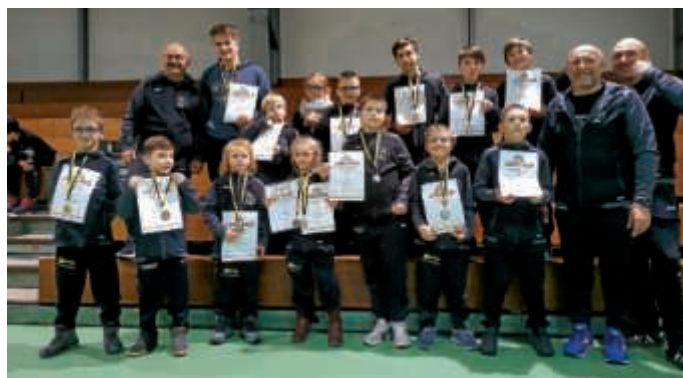
LM in Laudenbach

Bei den diesjährigen Landesmeisterschaften im griechisch-römischen Stil in Laudenbach konnten wir 15 Jugendliche und Kinder an den Start bringen. Ein weiterer dritter Platz fehlte und wir hätten die ganze