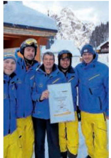
Zertifikat DSV Skischule

Weitere Informationen über den Skiclub gibt es über www.skiclub-bruchsal.de und über Facebook und Instagram.