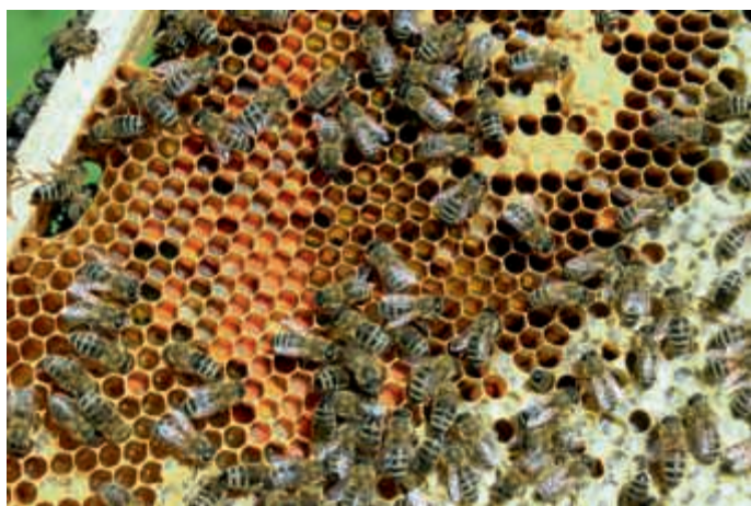
Für den Erhalt von Bienen in Bruchsal und Umgebung sucht der Projektgarten Heubühl Bienenpaten.

Die Bienenpaten (maximal fünf Teilnehmer) erhalten einen Einblick in die faszinierende Welt der Honigbienen. Ab März 2019 lässt Sie der Imker Martin Rausch bei vier Samstagsterminen an seinem Wissen über Theorie und Praxis der Bienenhaltung teilhaben. Die Patenschaft beinhaltet unter anderem vier Termine mit dem Imker, zwei Gläser Heubühl-Honig und eine persönliche Patenschaftsurkunde. Zusätzlich werden fünf Förderpatenschaften angeboten, für alle die das Bienenprojekt im Projektgarten Heubühl generell unterstützen möchten. Die Förderpaten erhalten zwei Gläser Heubühl-Honig sowie eine Förderpatenurkunde.