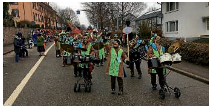
Nashörner in Ettenheim