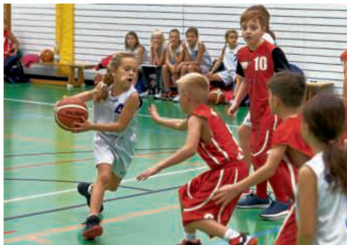
Bruchsal bedroht den Korb