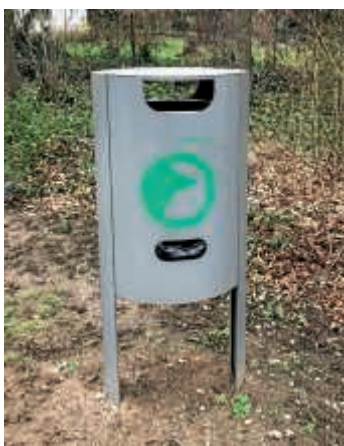
Bild der neuen Generation „Dog-Station“ am Bolzplatz Friedrichstallweg

Verrichtet Fiffi seine Notdurft auf Gehwegen, in Grün- und Erholungsanlagen oder in fremden Vorgärten muss der Kot unverzüglich beseitigt werden. Bei Nichteinhaltung drohen für die Verunreinigungen durch Hunde Bußgelder von bis zu 1.000 Euro für Herrchen oder Frauchen. Näheres regelt die Allgemeine Polizeiverordnung gegen umweltschädliches Verhalten, Belästigungen der Allgemeinheit und zum Schutz von Grün- und Erholungsanlagen der Stadt Bruchsal – zu finden unter Satzungen/Ortsrecht auf www.bruchsal.de