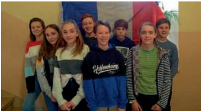
Die eifrigen Lesewettbewerbsteilnehmer

Der Januar steht am Schönborn-Gymnasium ganz im Zeichen der deutsch-französischen Freundschaft. Am Dienstag, 15. Januar, bekamen die Schülerinnen und Schüler der Klassenstufen 6 und 7 Besuch von FranceMobil, mit viel Spaß lernten sie so einiges über die Sprache und die Kultur des Nachbarlandes.