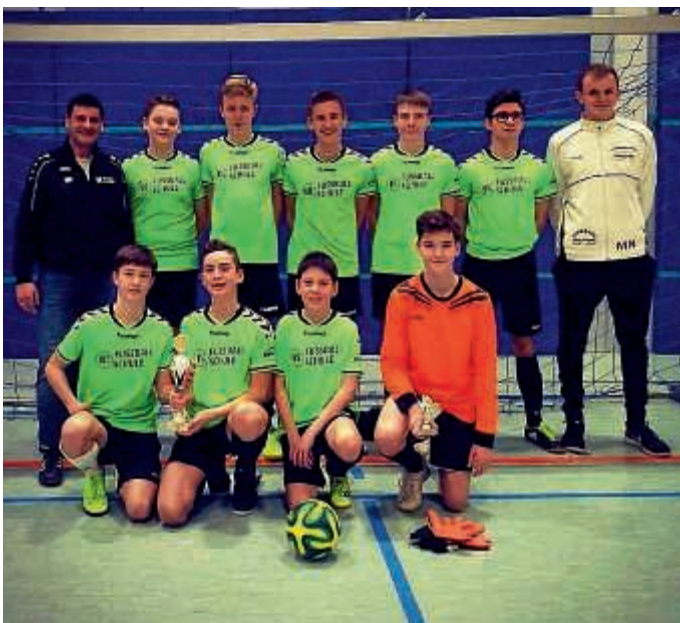
Platz 3 für C-Jugend in Ubstadt-Weiher

Platz 3 für C-Jugend der JSG FCO/FC Germania Untergrombach in Ubstadt-Weiher. Herzlichen Glückwunsch!