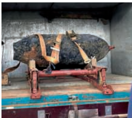
Die amerikanische Fliegerbombe