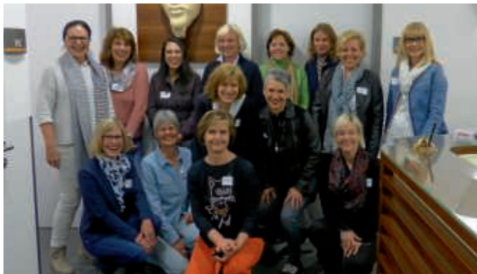
Unternehmerinnennetzwerk zu Besuch bei Dr. Schneeberg

Der Kommunikation mit dem Patienten wird große Bedeutung zugemessen. Eine durchdachte Praxisorganisation unterstützt bei optimalen Abläufen, modern ausgestattete Behandlungsräume und ein praxiseigenes Labor bieten beste Voraussetzungen für eine optimale Diagnose und Therapie. Und das Praxisspektrum ist breit gefächert. Durch Zusatzweiterbildungen in der Allergologie, Stimm- und Sprachstörung, der Umweltmedizin und der Psychosomatischen Grundversorgung reicht das Behandlungsspektrum über die klassische HNO-Heilkunde hinaus.