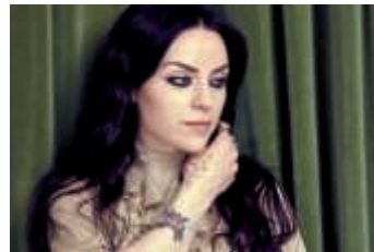
Amy Macdonald kommt nach Bruchsal in den Schlossgarten

Eine sanfte, aber eindringliche Stimme und ein großes Gespür für stilvolle Songs – Amy Macdonald versteht es, die Zuhörer in ihren Bann zu ziehen. Auf ihrer Open Air-Tour 2018 kommt sie am Samstag, 28. Juli nach Bruchsal in den Schlossgarten. Das Konzert beginnt um 19 Uhr. Sie ist ein Ausnahmetalent mit natürlichem Musikgespür, „in allen Ecken der Welt erfolgreich“, schreibt der Veranstalter. „Ihre aktuelle CD ‚Under Stars‘, die sie