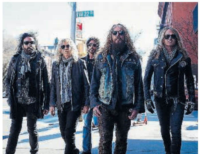
The Dead Daisies

In typischer Daisies-Manier kündigte die Band die ersten von vielen 2018er Burn It Down Tour-Daten kurz vor Weihnachten an, wobei Fans beim Verkaufstart in Scharen an die Vorverkaufsstellen stürmten. Viele weitere Termine werden bald