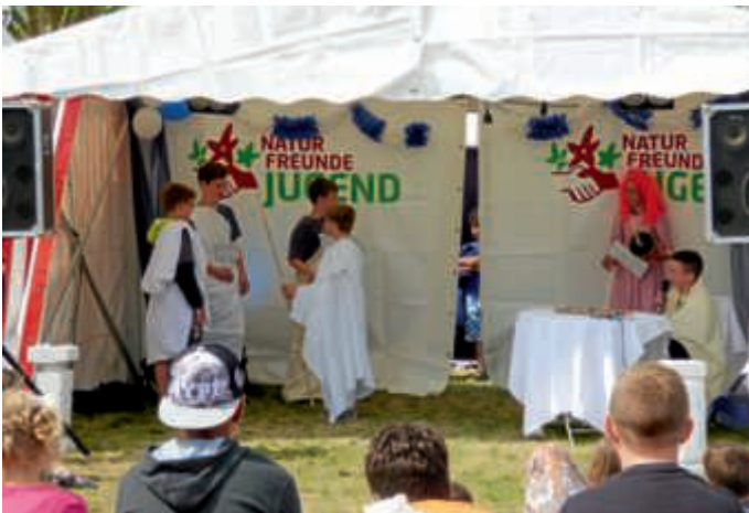
Zauberei und Kreativität: Theateraufführung beim Pfingstcamp