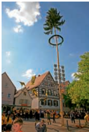
Maibaumaufstellung am Samstag, 28. April

Im Jahre 1978 wurde in Heidelberg der erste Maibaum aufgestellt. Deshalb feiern wir dieses Jahr unser 40-jähriges Jubiläum. Auf dem Marktplatz wird eine große Bühne aufgebaut. Die Heidelheimer Band „Flash“ wird für die musikalische Unterhaltung sorgen.