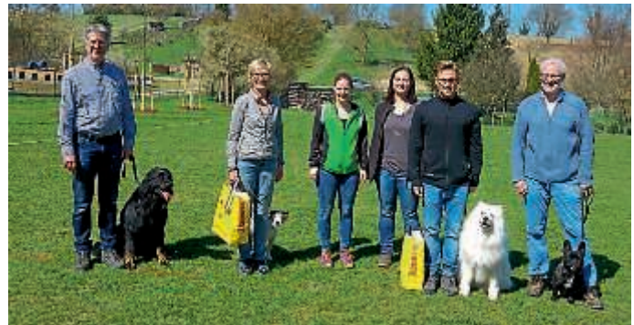
Teilnehmer der Begleithundeprüfung