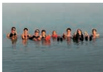
Baden im Toten Meer

Eine Exkursion führt die Schülerinnen und Schüler nach Nazareth im Nordosten und zum See Genezareth. Ein Besuch in Yad Vashem steht ebenso auf dem Programm wie Jerusalem mit der Grabeskirche.