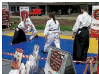
Schwungvolle Würfe und richtiges Fallen: Vorführung der Aikido-Abteilung

Bei schönstem Wetter präsentierte sich die Aikido-Abteilung beim Frühlingsfest in Bruchsal mit Vorführungen in der Innenstadt. Im Zuge des verkaufsoffenen Sonntags konnten sich die Besucher ein Bild von dieser Sportart machen. An Info-Ständen wurden Informationen über unseren Verein und unsere verschiedenen Sportarten angeboten.