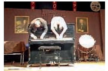
Gogol & Mäx auf ihrem Klavier