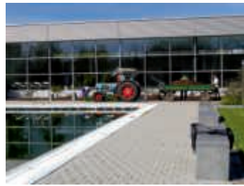
Neuer Rindenmulch für die Beete

Vielen Dank an alle Helfer, die damit beitragen, unser Heidelheimer Freibad zu erhalten!