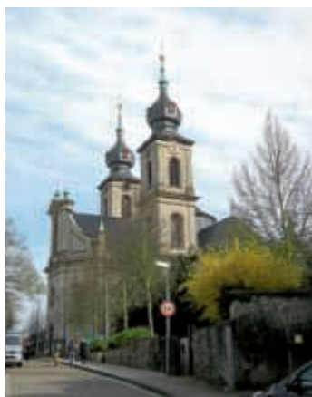
St. Peter in Bruchsal: Pfarr- und Grabeskirche sowie barockes Kulturdenkmal