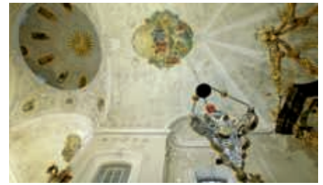
Peterskirche neu entdecken.

für den Film komponiert worden ist, soll sich ein Erlebnis ergeben, das den Zuschauer betrachten, mitdenken und mitfühlen lässt“, wünscht sich Weiler. Seine jüngste Arbeit setzt demgemäß die Filmreihe mit lokalem Bezug fort, die 2010 mit „Ein grauenhafter Tag liegt hinter uns“ über den Luftangriff von 1945 begonnen worden ist. Erstmals aufgeführt wird „Bruchsal neu entdecken“ am Sonntag, 13. Mai, um 18 und 20 Uhr im Kino 2 des Cineplex Bruchsal (Bahnhofstraße 13). Karten zum Preis zwischen 5 und 7,50 Euro sind erhältlich an der Kinokasse sowie online unter www.cineplex.de . (tam)