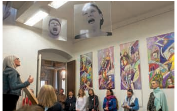
Breites Angebot in Bruchsal

staltungen und Besichtigungsmöglichkeiten zwischen 10 und 20 Uhr beteiligt. Gemeinsam gestalten die mitwirkenden Einrichtungen ein vielfältiges Programm: Schloss Bruchsal, Deutsches Musikautomaten-Museum, Städtisches Museum, Kunstverein Damianstor, Kindergartenmuseum, Graf-Kuno-Museum, schließlich das historische Schuhmacherhaus in der Klosterstraße sowie die Heimatmuseen in Heildelshaus und Untergrombach. Ebenfalls als Beitrag zum Museumstag vorgesehen sind um 18 und 20 Uhr die beiden erstmaligen öffentlichen Vorführungen des architektur- und stadtgeschichtlichen Films „Bruchsal – neu entdecken“ von Regisseur Dirk Weiler im Cineplex.