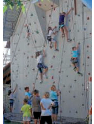
Unsere Kletterwand auf dem Gelände der Villa Kunterbunt

Wir sind nun bestens gerüstet und freuen uns auf die neue Klettersaison. Am Montag, 30. April, um 15 Uhr geht's los. Alle anderen Termine stehen auf unserer Homepage www.traumstart-ev.de . HHR.