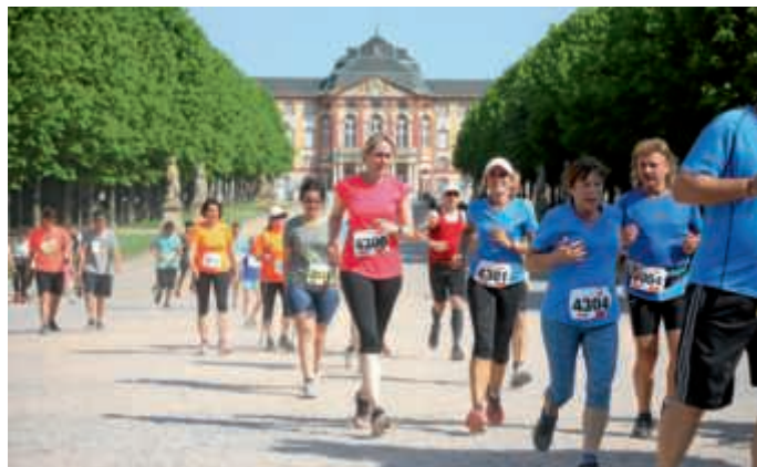
Rege Teilnahme am 21. Bruchsaler Hoffnungslauf

vor dem Start ein Ständchen sang, mit tatkräftiger Unterstützung von Handball-Weltmeister-Torwart Henning Fritz. Dieser hatte sich eingefunden, um die deutsche Blindentorball-Nationalmannschaft zu unterstützen.