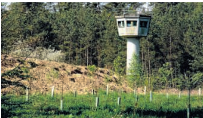
Der stehengelassene Wachturm als Relikt des Ost-West-Wettrüstens, der an den Kalten Krieg als Mahnmal erinnern soll.