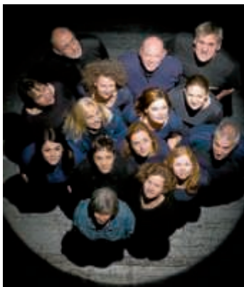
Die Insel, ein geschlossenes System, gerät aus den Fugen