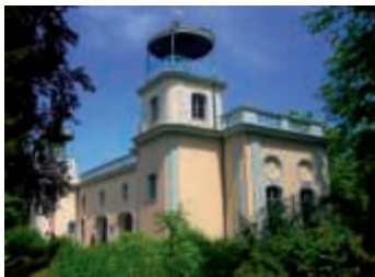
Führung durchs Jagdschlösschen Belvedere

Touristinformation Bruchsal, Am Alten Schloss 22, 76646 Bruchsal, Telefon (07251) 5059461, E-Mail: touristinformation@btm.de