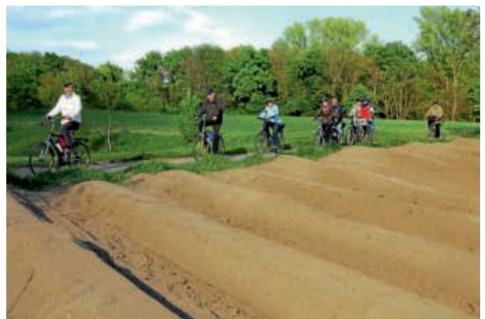
„Tour de Spargel“ - Beim Radeln zwischen Spargelfeldern Neues kennen lernen

Die Bruchsaler Tourismus, Marketing und Veranstaltungen GmbH (BTMV) lädt in diesem Jahr wieder alle Radbegeisterten zur geführten Spargel-Radtour ein. Die „Tour de Spargel“ ist die beliebteste Radroute der BTMV und wurde im Ideenwettbewerb Genießerland Baden-Württemberg 2010 preisgekrönt. Die Tour führt uns durch eines der größten Spargelanbaugebiete Nordbadens.