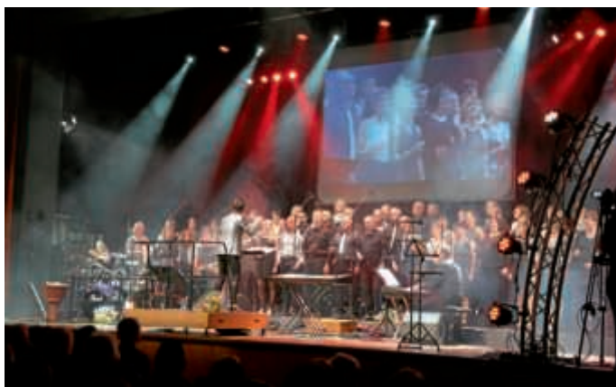
Begeisterndes Konzert vor vollem Haus