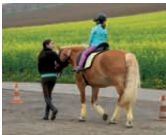
Maifest mit Ponyreiten