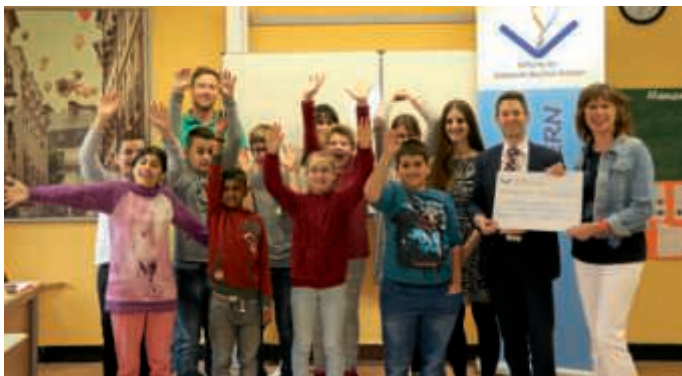
Freude über die Spende der Volksbank