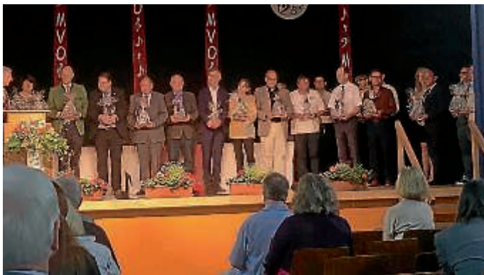
Ehrung der Vereinsvertreter