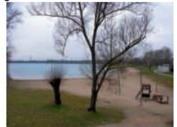
Blick über den Hardtsee

Die Wandergruppe trifft sich um 13.22 Uhr am Bahnhof Bruchsal. Mit der S 3 fahren wir um 13.44 Uhr nach Weiher. Vor hier aus wandern wir in zirka 2 Stunden am Hardtsee vorbei und durch den Lusshardt unsere Strecke von rund acht Kilometern zur Einkehr im Spargelhof.