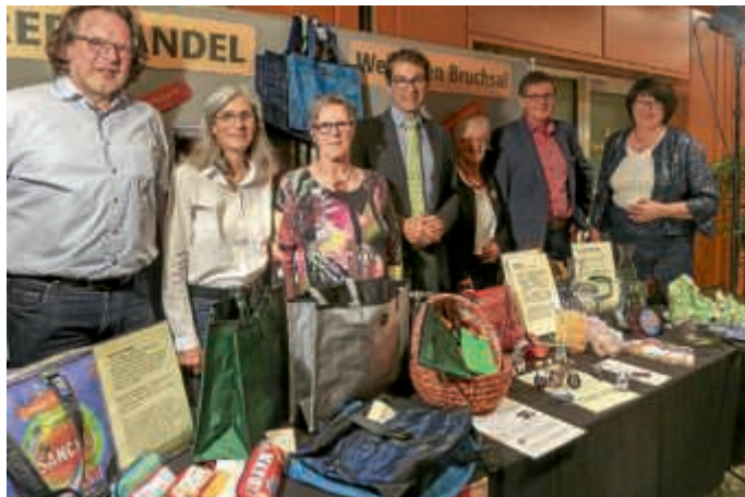
OB Petzold-Schick und Dr. A. Baumann, Staatssekretär im Ministerium BW. für Umwelt am Weltladenstand

Mit einem farbenfrohen Stand war der Weltladen Bruchsal auf dem diesjährigen Bürgerempfang der Stadt Bruchsal vertreten. In Anlehnung an das Thema des Bürgerempfanges mit den Aspekten des Natur- und Umweltschutzes konnte der Weltladen mit einer Vielzahl von Produkten das Engagement des Fairen Handels für Nachhaltigkeits- und Umweltthemen fühl- und sichtbar darstellen.