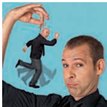
Helge und das Udo „Läuft!“

Und darauf „Läuft!“ es unter anderem hinaus: Filmklassiker wie Alien, E.T. oder Star Wars als gereimte Sketches in 3 Minuten (Sie dürfen