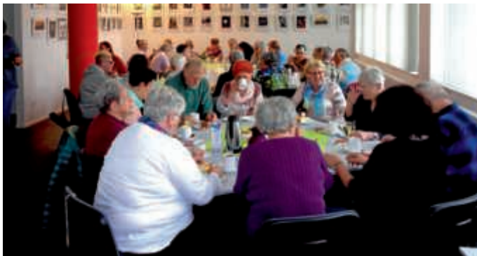
Ehrenamtliche der AWO in froher Runde