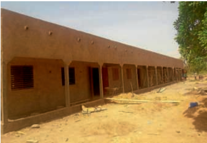
Die neue Schule erhält den Außenputz