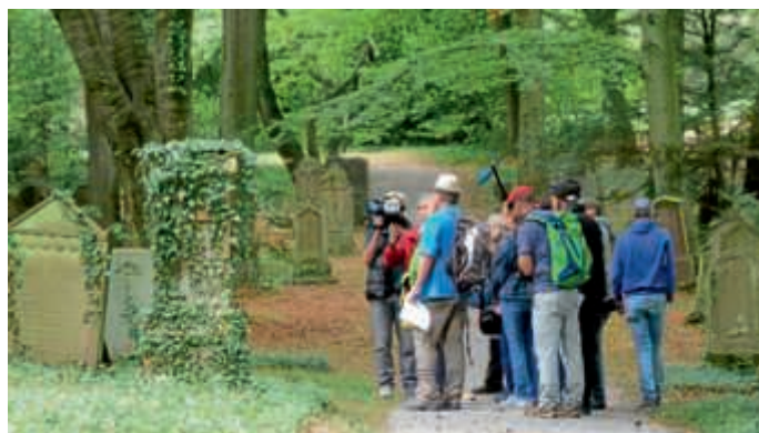
Führungen auf dem jüdischen Friedhof auf dem Eichelberg.