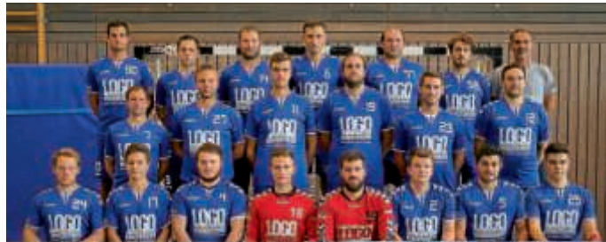
TV Büchenau siegt im Kreispokal gegen Neuthard