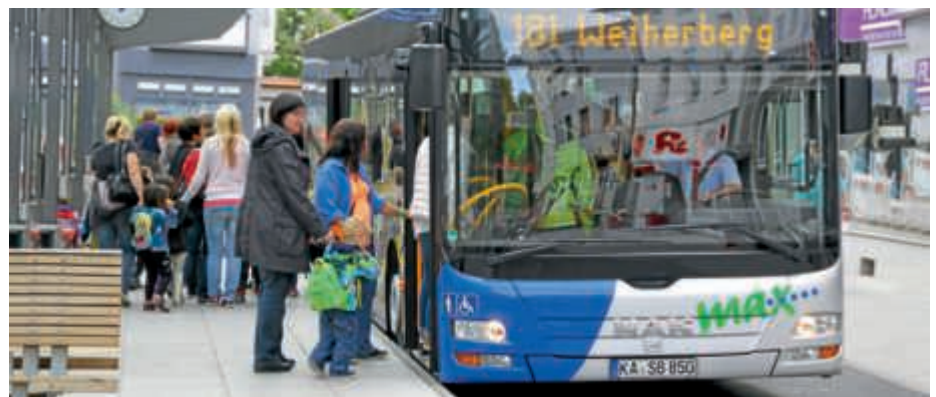
Das Herbstfest mit Verkaufssonntag bietet die günstige Gelegenheit, ohne eigenen PKW in die Kernstadt zu gelangen und das Mobilitätsangebot des Bruchsaler Stadtbusses unverbindlich kennenzulernen

gende Generationen ein bisschen blauer ist als anderswo. Infos hierzu sowie den Stadtbushaltestellenplan gibt es zeitnah vor dem Herbstfest auf der Stadtwerke- und auf der Stadtbus-Homepage, stadtwerke-bruchsal.de beziehungsweise stadtbus-bruchsal.de, im Internet. tw