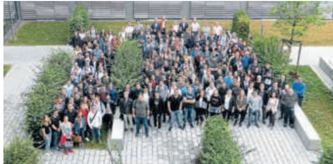
Einige der rund 270 neuen Azubis und dual Studierenden am Siemens-Standort in Erlangen.

„Die Ausbildung ist bei Siemens eine der tragenden Säulen für die Zukunft unseres Unternehmens. Mit der Digitalisierung erleben wir in puncto Ausmaß und Geschwindigkeit den größten Strukturwandel seit Jahrzehnten. Deshalb passen wir unsere Ausbildung stän-