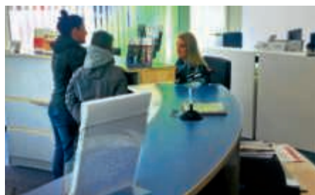
Auch wenn draußen nicht mehr nur Stadtbus draufsteht: Drinnen gibt's weiterhin Infos und Tickets für Stadtbus MAX!