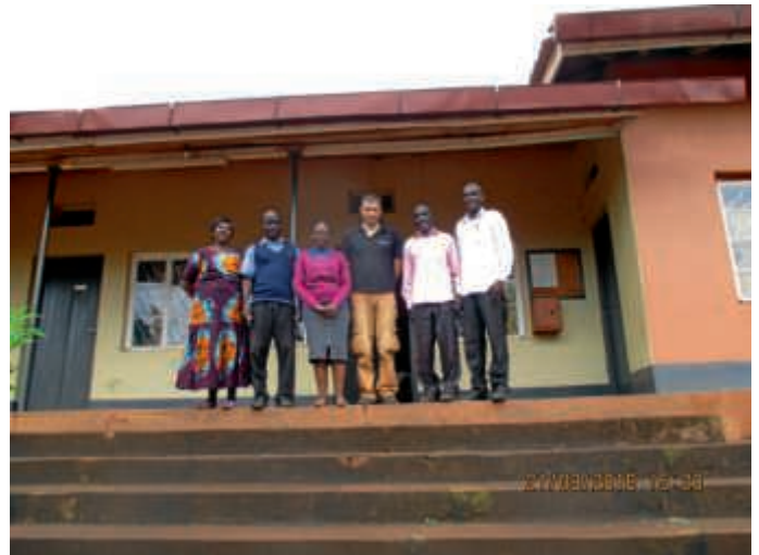
Kyamulibwa, Uganda: Projektteam für das gemeinsame Projekt nimmt Arbeit auf.

In Kyamulibwa, Uganda hat sich eine vielversprechende Partnerschaft für den Umweltschutz zwischen der dort ansässigen KAB-Gruppe und unserer Partnerorganisation KAP entwickelt. Noch diesen Monat werden vier Schulen ausgewählt, an die eine Baumschule angegliedert werden soll. Man möchte so den Umweltschutz in den Unterricht einfließen lassen und einen Schritt Richtung Wiederaufforstung gehen.