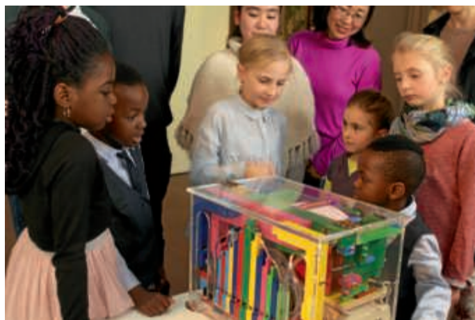
Wie klingt wohl eine moderne Drehorgel?