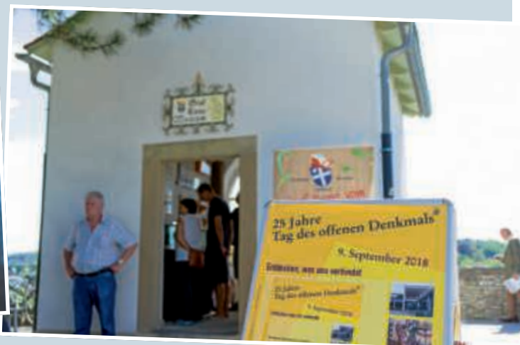
▲ Mit dem Graf-Kuno-Museum oberhalb der Andreasstaffel und dem Schuhmacherhaus in der Klostersgasse präsentierte Bruchsal zwei der kleinsten Museen in der Region