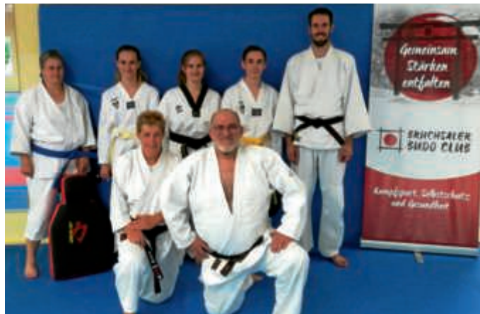
Trainer des 1. BBC