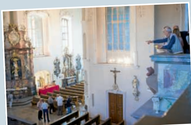
▲ Annähernd 500 Besucher zählte allein die barocke Peterskirche, die mit einer Ausstellung an ihren Erbauer Damian Hugo von Schönborn erinnerte und den Denkmaltag mit einem abendlichen Konzert beschloss