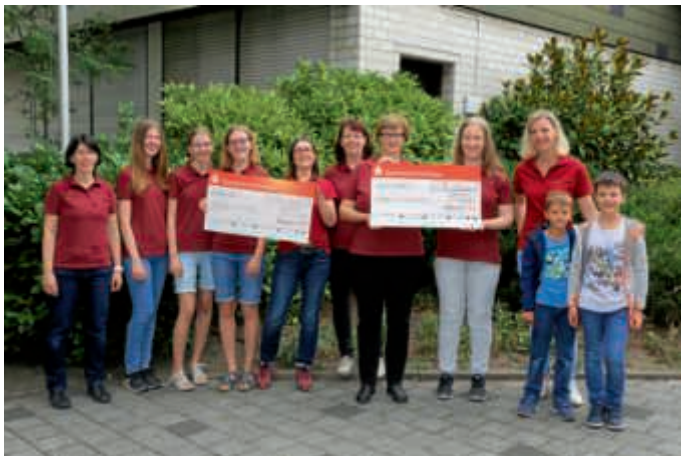
Mitglieder der AG Kleidermarkt und Seelsorgeeinheiten Bruchsal und Bruchsal-Michaelsberg

Das Kleidermarktteam St. Paul fördert mit den Erlösen aus den zweimal jährlich stattfindenden Flohmärkten soziale Projekte für Kinder und Jugendliche in der Region Bruchsal, Karlsruhe und Heidelberg. In diesem Jahr fiel die Wahl nun erstmals auf Hilfsprojekte im entfernten Südamerika.