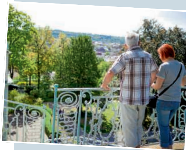
▲ Der Blick von der Rokoko-Preziose Belvedere auf den Stadtgarten und die Stadt zog besonders viele Besucher an