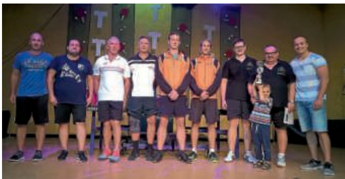
Glückliche Sieger des Tischtennis Ortsturniers