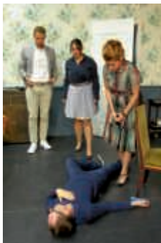
Wer ist die fremde Leiche, die plötzlich nach einem Stromausfall im Salon des Hauses liegt?

Der Vorverkauf bei der Buchhandlung Braunbarth Bruchsal und die Reservierungen unter www.diekoralle.de sind seit 8. September möglich. Die Karten für die Silvestervorstellung sind erst ab 30. November erhältlich.