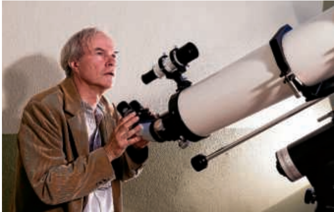
Leben des Galilei