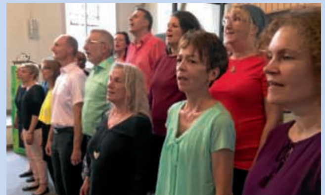
Der singfreudige Chor begeistert die Zuhörer.