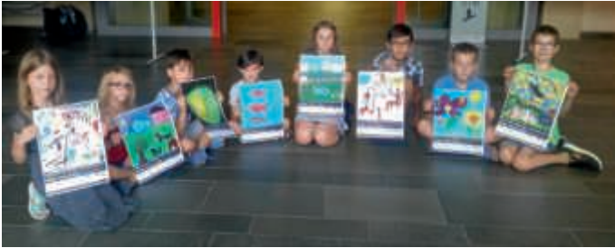
Mitglieder des KinderCouncil bei der Jury-Sitzung.

Jury bestand aus acht Mädchen und Jungen im Alter von 8 bis 12 Jahren. Gefördert wird die Aktion „de.mocrazy“ aus dem Programm „Demokratie leben“ des Bundesfamilienministeriums, vom Landkreis Karlsruhe sowie der Stadt Karlsruhe.