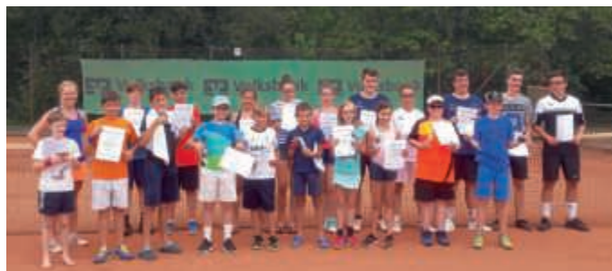
Teilnehmer der Jugendclubmeisterschaften zeigen stolz ihre Urkunden

Am ersten Ferienwochenende vom 28. und 29. Juli fanden beim TC BW Untergrombach die diesjährigen Jugendclubmeisterschaften statt. 23 Kinder und Jugendliche kämpften um den Titel des Clubmeisters in ihrer jeweiligen Altersklasse. Die jüngsten Teilnehmer waren dabei gerade mal fünf Jahre alt. Für sie wurde eine kleine Tennisolympiade mit verschiedenen Spielen veranstaltet. Alle anderen Teilnehmer spielten im Midi- bzw. Großfeld, zum Teil mit Unterstützung durch Helferinnen aus der zweiten und dritten Damenmannschaft, zum Teil selbstständig. Nach den Spielen am Samstag wurde traditionell mit allen Teilnehmern gegrillt. Im Anschluss daran durften natürlich die Marshmallows über dem Lagerfeuer nicht fehlen. Ein paar Kinder übernachteten in mitgebrachten Zelten auf der Anlage des Tennisclubs, für die anderen ging es dann pünktlich um 10 Uhr am Sonntag mit den Spielen weiter. Um 13.30 Uhr standen alle Clubmeister fest: