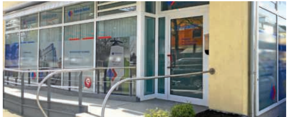
Im Servicecenter am Rendezvous werden die Kunden rundum beraten

Am 16. September, 13 bis 18 Uhr, ist es wieder so weit: Ganz Bruchsal feiert sich und seine Besucher mit einem dreifachen Hoch auf den Goldenen Herbst. Im Rahmen des zweiten Verkaufssonntags dieses Jahres präsentieren sich vorrangig die im BranchenbundBruchsal (B3) organisierten Unternehmen, Firmen und Geschäfte mit einer konzertierten wie individuellen Leistungsschau des Einzelhandels in der Innenstadt und den Gewerbegebieten. Nach einigen Intermezzi auf dem Marktplatz, mal mit, mal ohne Stadtbus, präsentieren sich die Stadtwerke Bruchsal getreu ihrem Slogan „Energie. Lebensqualität. Mobilität.“ auch zum Herbstfest wieder beim Servicecenter am Stadtbus-Rendezvous, in der Bahnhofstraße 1. Für die Stadtwerke und ihre Töchter sind die drei Begriffe gleichzeitig Selbstverständnis wie gesellschaftlicher Auftrag. Das im April neu eröffnete Servicecenter hat übrigens das Stadtbüro nicht ersetzt, sondern bietet neben dem Service rund um den Stadtbus Bruchsal