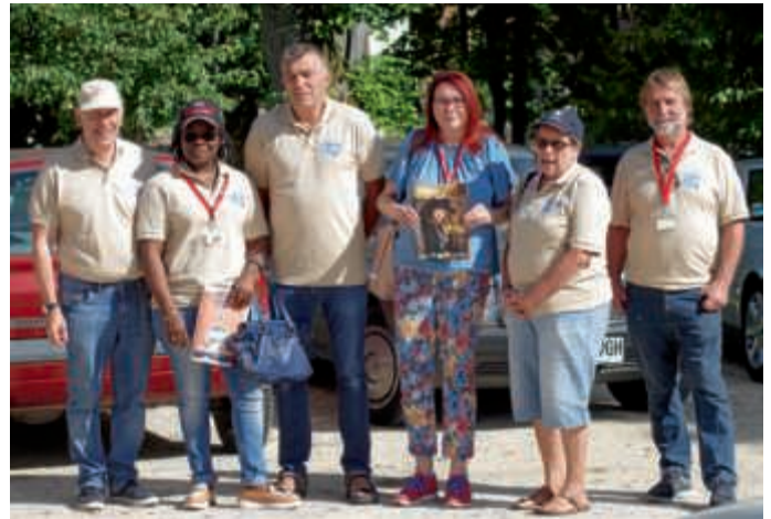
Die drei Bruchsaler Teams