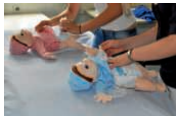
Den richtigen Umgang lernen

Weitere Gesprächstermine können nach Vereinbarung gerne auch zu anderen Zeiten angeboten werden.