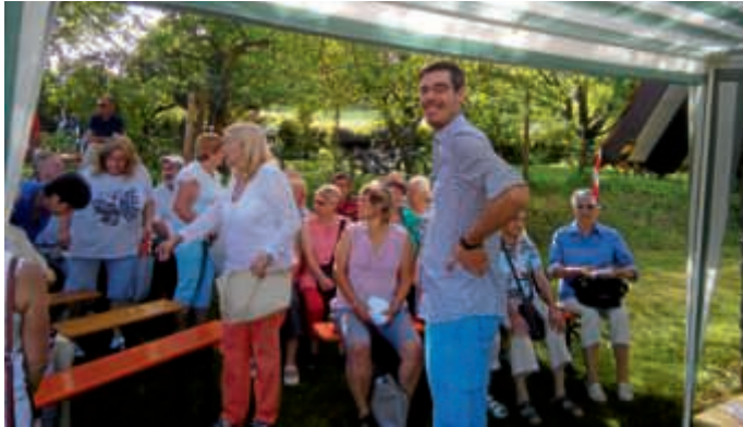
Bei der Bulldogsegnung

war beim Faschingsgottesdienst, der Traktorsegnung und den Gottesdiensten auf dem Michaelsberg dabei. Er versuchte uns Musiktherapie beizubringen, was manchmal sehr an das Erlernen einer Fremdsprache erinnerte. Er brachte uns Taizé-Lieder bei und schulte die Artikulation, welche, ob des örtlichen Dialektes, nicht überflüssig war. Er fror mit uns an Allerheiligen auf dem Friedhof und ließ seinen Schweiß an Christi Himmelfahrt auf dem Michaelsberg.