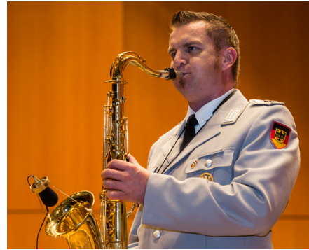
Alle Bilder: Orchester des Heeresmusikkorps Ulm, 2017 © Bundeswehr