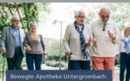
Bewegte Apotheke Untergrombach: