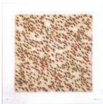
Hans Huwer: sEn – 2011 – Schnittlinien und Kreide auf Karton, 120x120cm

Der aus dem Saarland stammende Künstler Hans Huwer setzt den Schwerpunkt in seinen Werken vor allem auf Zufallsstrukturen, die bei ihm allerdings weit ab von Zufälligkeiten in einem aufwändigen und akribischen Arbeitsprozess entstehen. Durch Überlagerung von teilweise mehr als 20 Farbschichten entsteht ein dichtes Gewebe in sich geschlossener Farbformen, die beim Betrachter den Eindruck erwecken, sie würden sich in den Raum wölben. Auf anderen Blättern scheinen, erzeugt von Unschärfen in den Konturen seiner seriellen Arbeiten, seine Formen im Raum zu schweben.