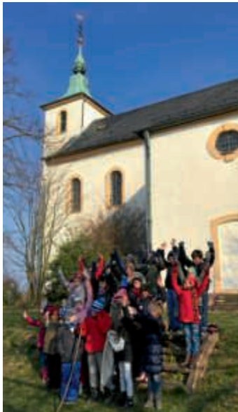
Winterwanderung der Klasse 3a

Die Klasse 3a machte am 23. Februar einen Ausflug zum Michaelsberg nach Untergrombach. Wir hatten einen langen Weg vor uns, den wir aber locker geschafft haben.