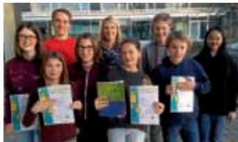
Strahlende Gesichter nach der Siegerehrung der Mathe-Olympiade!