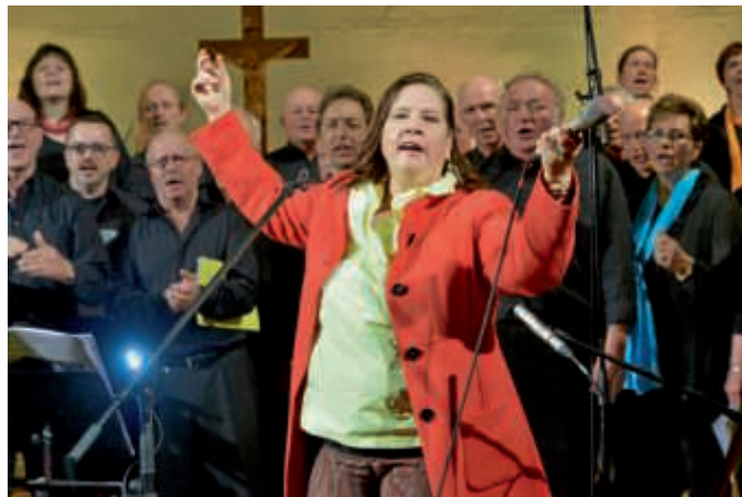
Ein neuer Kelly-Projektchor startet demnächst

Mit ihrem neuen Album »We Got Love« und mehreren gigantischen Konzerten feierte die Kelly Family 2017 nach mehreren Jahren Pause ihr großes Comeback. Passend dazu veröffentlicht die Folk-Popgruppe, die in den 1990er-Jahren ihre größten Erfolge feierte, nun ihren Backkatalog erneut auf CD. Mit dabei ist auch das Album »New World«, das ursprünglich bereits 1990 erschien. Damals waren die Kellys noch vor allem als Straßenmusiker unterwegs. Ein tolle Melodie, sehr passend zur Stimme von Kathy Kelly.