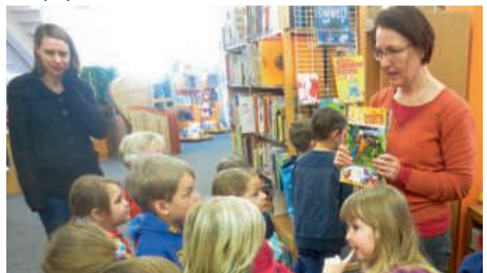
Besuch in der Stadt Bibliothek Bruchsal