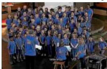
Der Schulchor der Bruchsaler Hebelschule