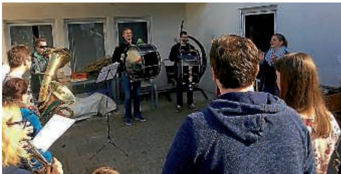
Abschlussprobe der Nashörner