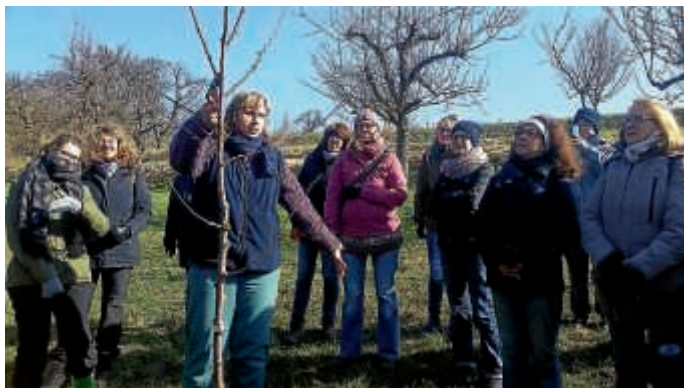
Schnittkurs im Schlosspark Obergrombach