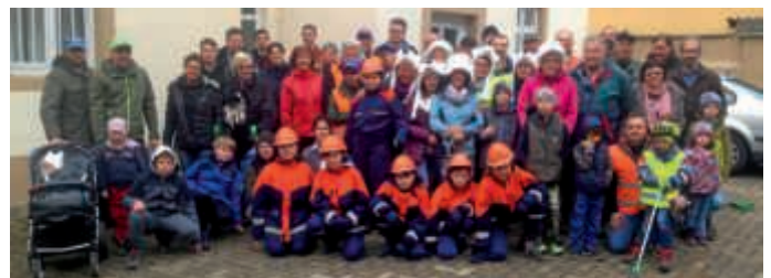
Großer Zuspruch bei der Putzete