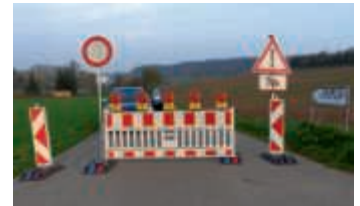
Nächtliche Sperrung von Feldwegen.

Bruchsal (pa) | Zum Schutz der Kröten, die zu ihren Laichplätzen wandern, werden demnächst auf Heidelheimer Gemarkung zwei Feldwege nachts zwischen 19 und 7 Uhr voll gesperrt. Es handelt sich um den Braunwiesenberg bei der Kläranlage zwischen Heidelheim und Bruchsal sowie die Geckentaler Hohle zwischen Heidelheim und Unteröwisheim. Die Sperrungen können im Voraus nicht genau terminiert werden, doch steigt der Wanderungsdruck in Abhängigkeit von den Witterungsverhältnissen. Auf die Sperrungen wird unübersehbar vorab durch Hinweisschilder in der Bruchsaler Bergstraße und an der Altenbergstraße in Heidelheim hingewiesen. Diese Schilder werden wie auch die Vollsperrungen an den Wandertagen der Amphibien aktiviert. Die Verkehrsteilnehmer werden gebeten, auf die Hinweisschilder zu achten und das übergeordnete Straßennetz zu benutzen. Hinweis: Feldwege sind keine öffentlichen Straßen, sondern dürfen nur zur Bewirtschaftung angrenzender land- und forstwirtschaftlicher Grundstücke befahren werden!