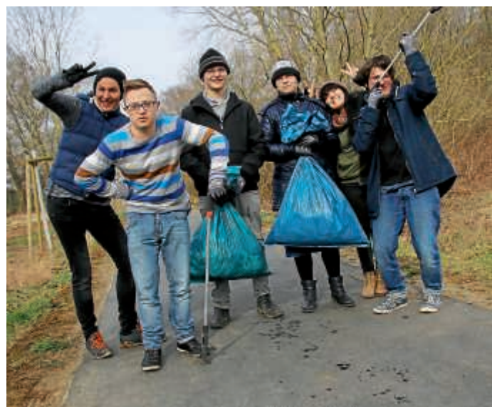
Voller Tatandrang auf Müllsammel-Mission

Sollten auch andere Schulklassen, Kindergärten oder Freiwilligen-gruppen Interesse an der Aktion haben, gibt es weitere Informationen über die Stadt Bruchsal, die Material zur Verfügung stellt und bei der Organisation und der Müllentsorgung unterstützt. Weitere Informationen erhalten Sie über das Agenda-Büro, E-Mail: Agenda-buero@bruchsal.de oder unter Telefon: (07251) 79-512.