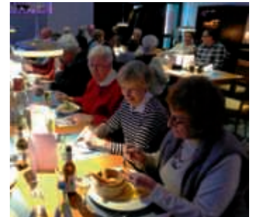
MSCler im Hopfengarten