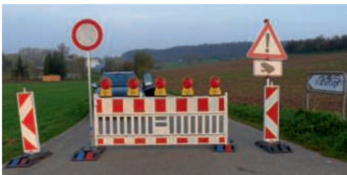
Nächtliche Sperrung von Feldwegen.

Die Sperrungen können im Voraus nicht genau terminiert werden, doch steigt der Wanderungsdruck in Abhängigkeit zu den Witterungsverhältnissen. Auf die Sperrungen wird unübersehbar vorab durch Hinweisschilder in der Bruchsaler Bergstraße und an der Altenbergstraße in Heidelberg hingewiesen. Diese Schilder werden wie auch die Vollsperrungen an den Wandertagen der Amphibien aktiviert. Die Verkehrsteilnehmer werden gebeten, auf die Hinweisschilder zu achten und das übergeordnete Straßennetz zu benutzen. Hinweis: Feldwege sind keine öffentlichen Straßen, sondern dürfen nur zur Bewirtschaftung angrenzender land- und forstwirtschaftlicher Grundstücke befahren werden!